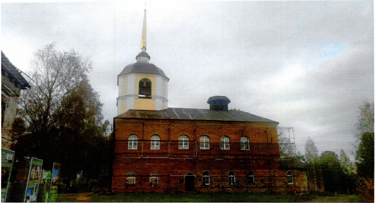
Фото 2. Фасад с южной стороны.