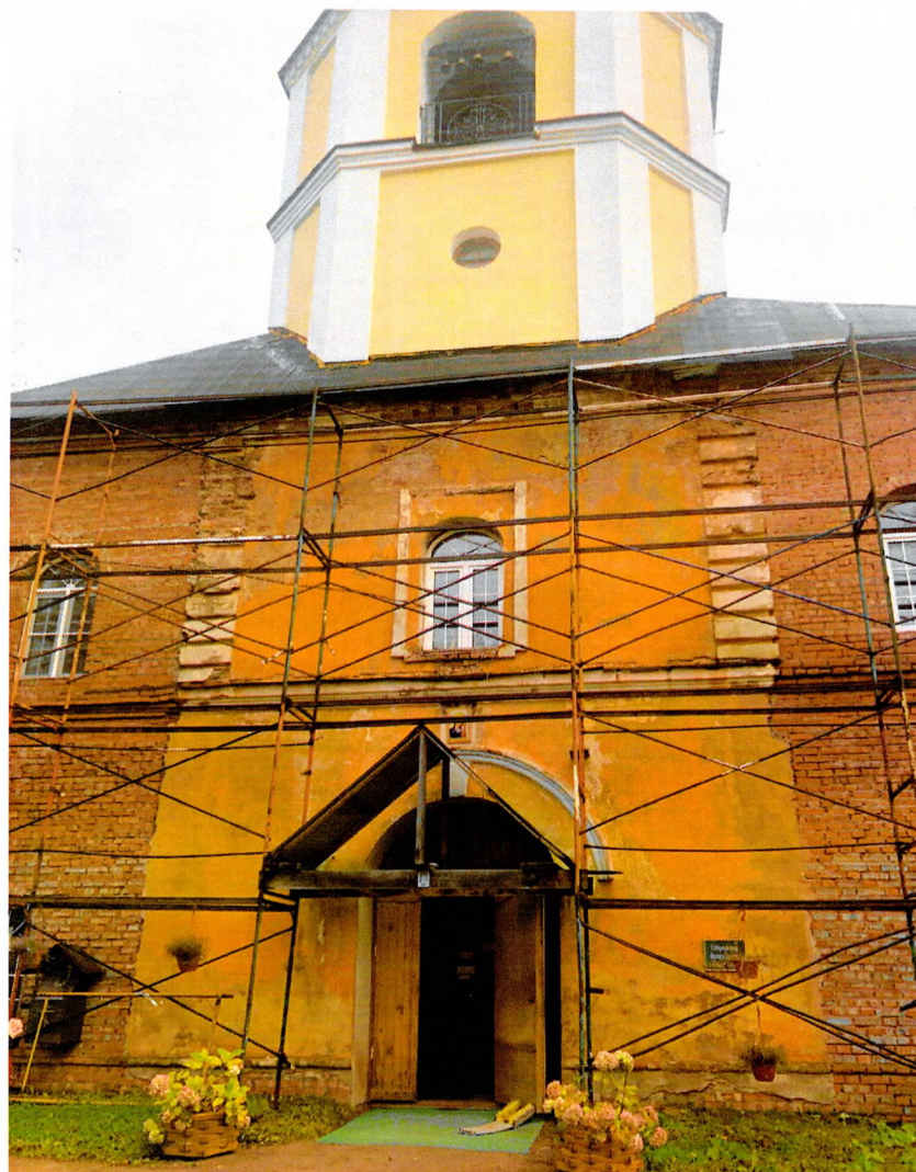
Фото 9. Центральная часть западного фасада.