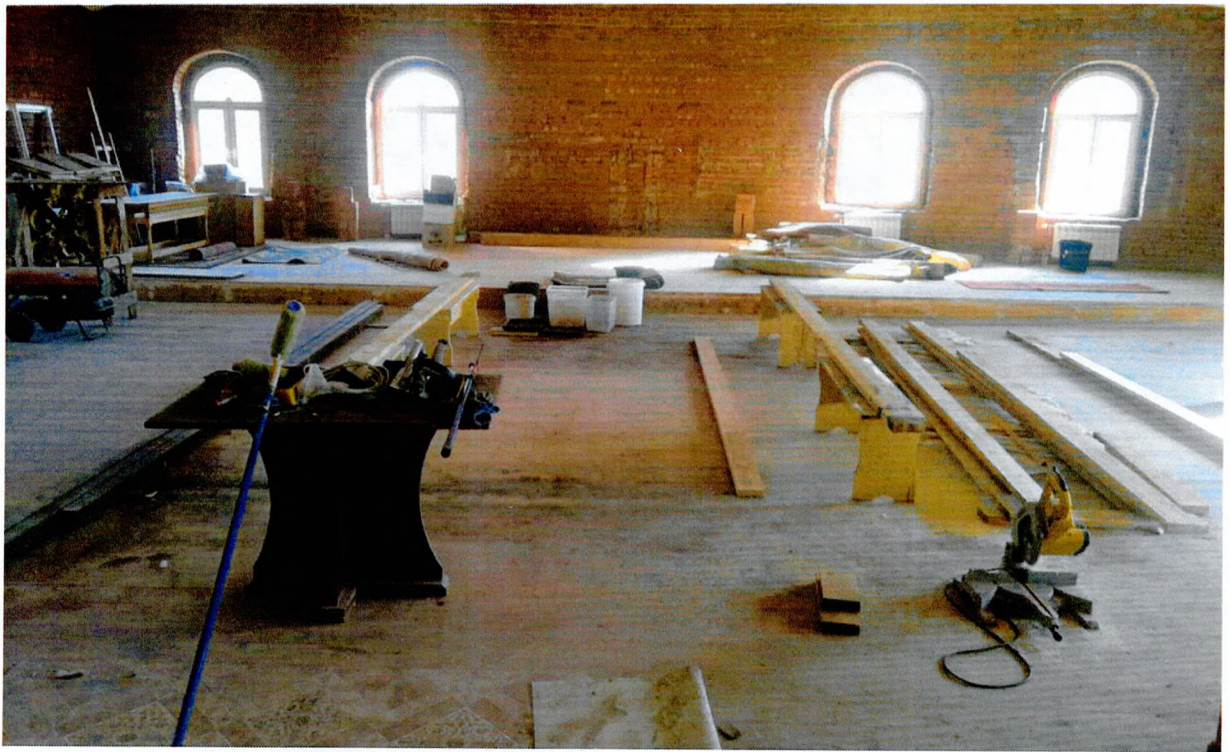
Фото 6. Вид второго этажа.