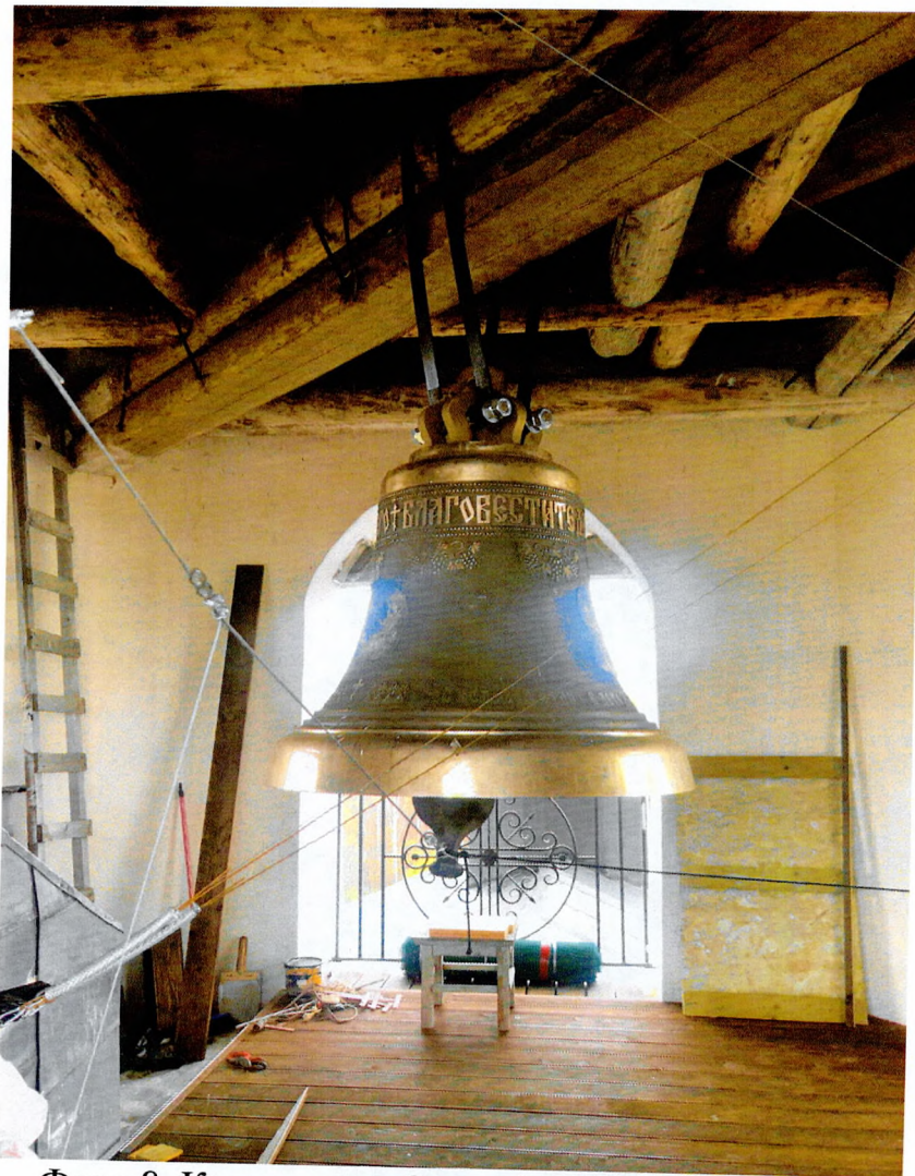
Фото 8. Колокольня Свято-Троицкого собора 4 ярус.