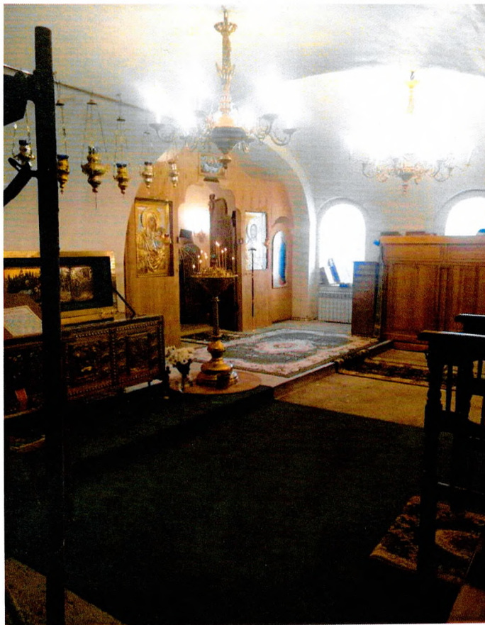
Фото 4. Первый этаж Свято-Троицкого собора