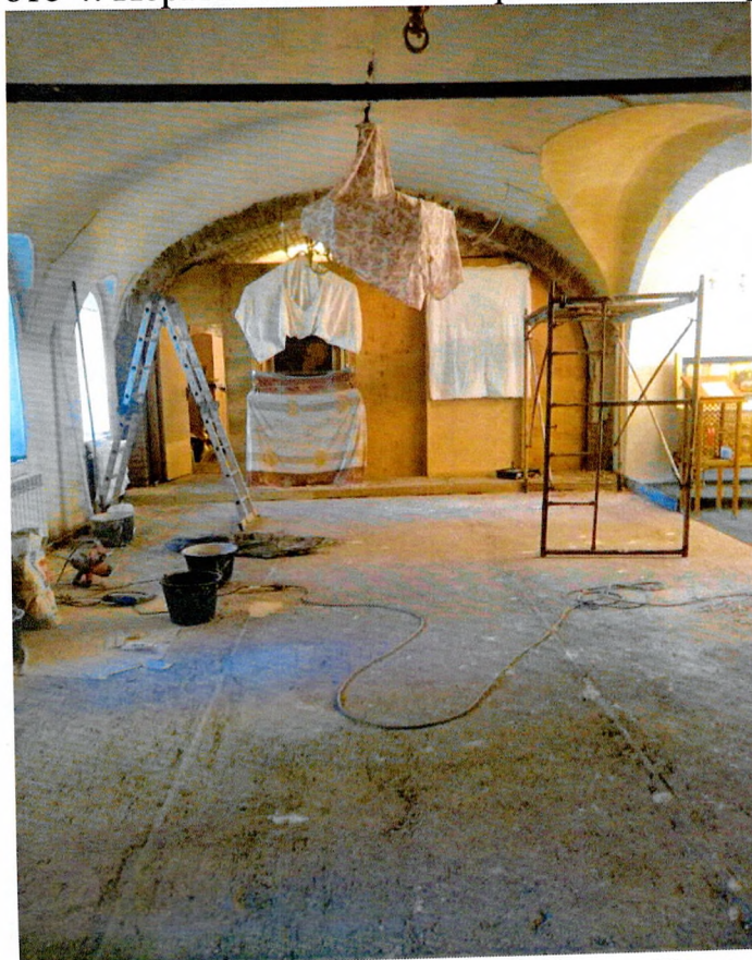
Фото 5. Пол - цементная плита, 1-й этаж Свято-Троицкого собора