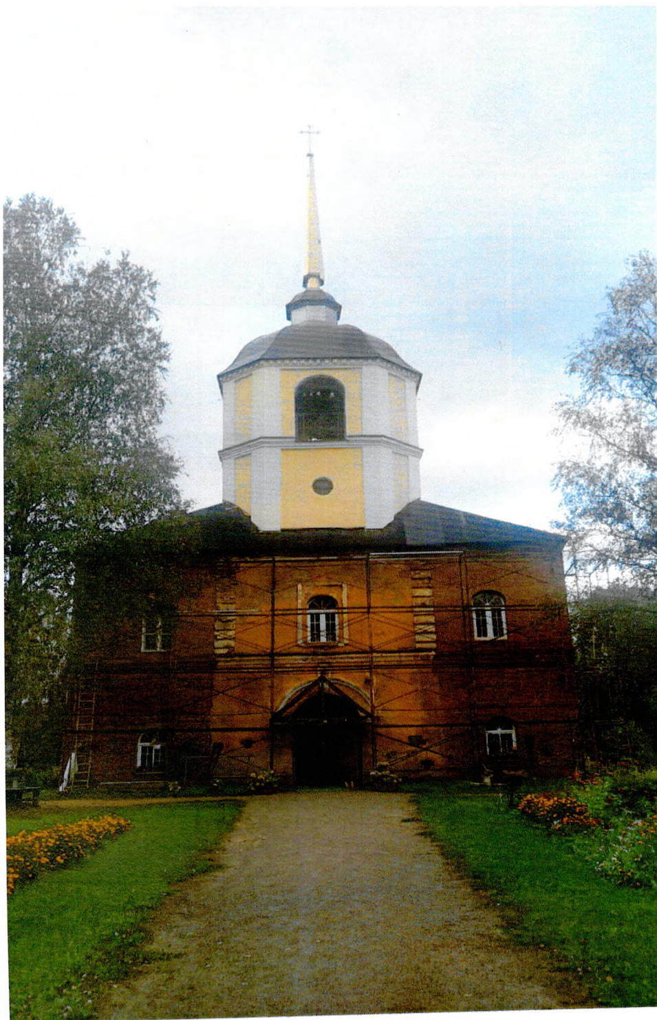
Фот 1. Фасад с западной стороны.

Приложение № 3 к охранному обязательству собственника или иного законного владельца объекта культурного наследия регионального значения «Свято- Троицкий собор (колокольня, основания стен основного объёма) середина XVII - начало XIX века» входящий в состав объекта культурного наследия регионального значения «Комплекс Антониево-Дымского монастыря, включенного в единый государственный реестр объектов культурного наследия (памятников истории и культуры) народов Российской Федерации