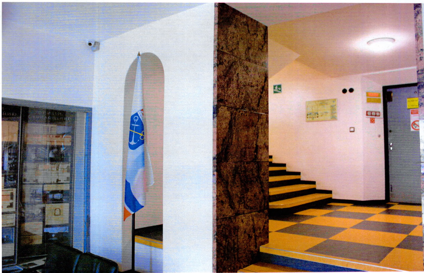
Фото 4. Портал прямоугольного сечения с облицовкой розовым гранитом