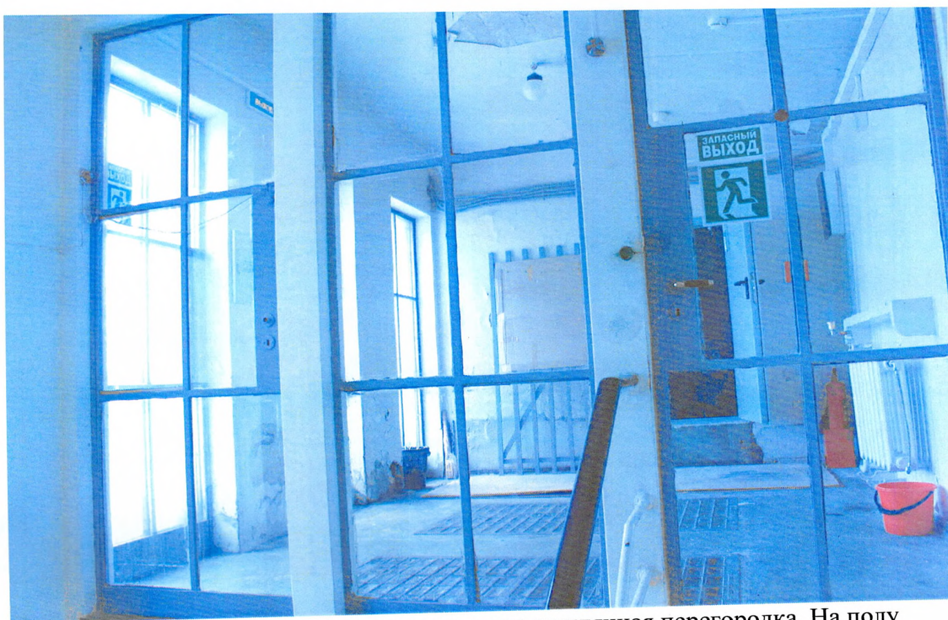
Фото 9. Выход на крышу, сохранившаяся стеклянная перегородка. На полу светоотражающая призма.