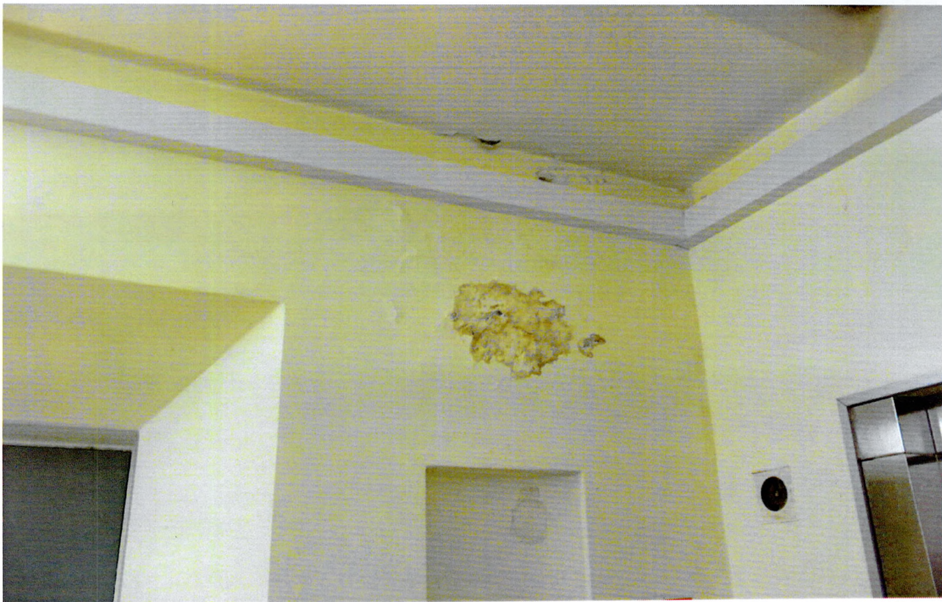
Фото 8. Следы намокания около выхода на крышу (6 этаж).