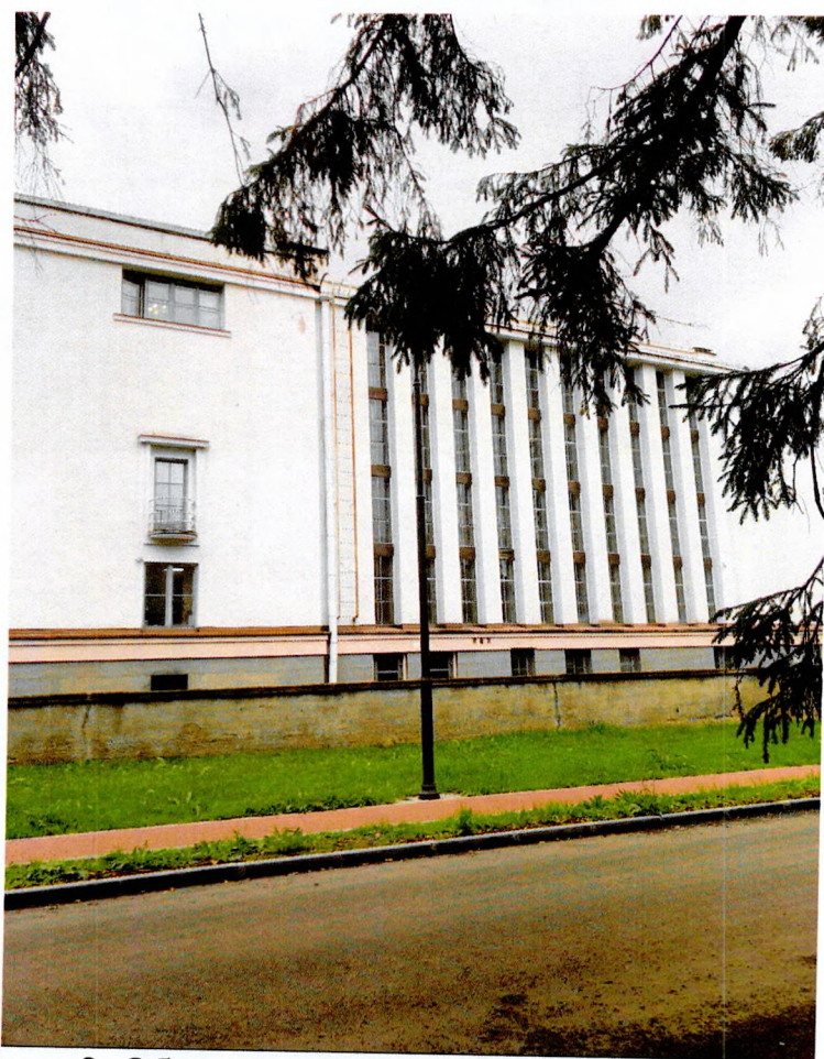
Фото 3. Общий вид здания с восточной стороны.