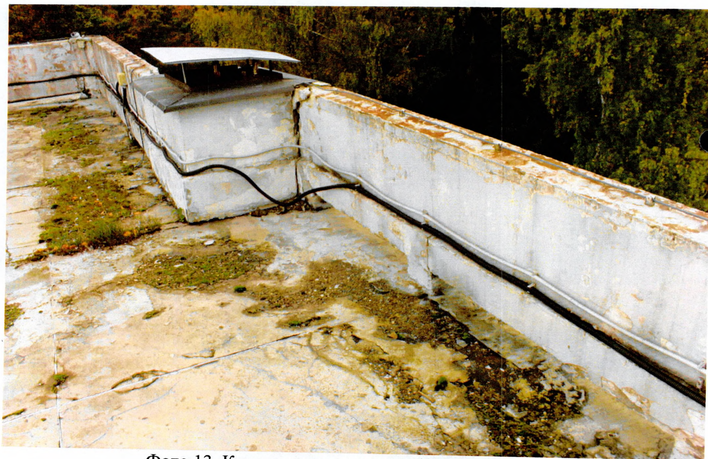
Фото 13. Крыша с трещинами и биопоражениями.