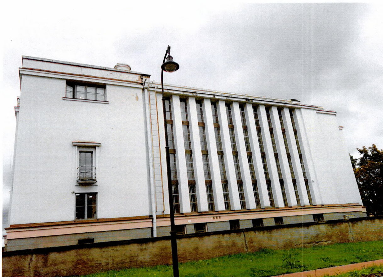
Фото 2. Западная часть здания.