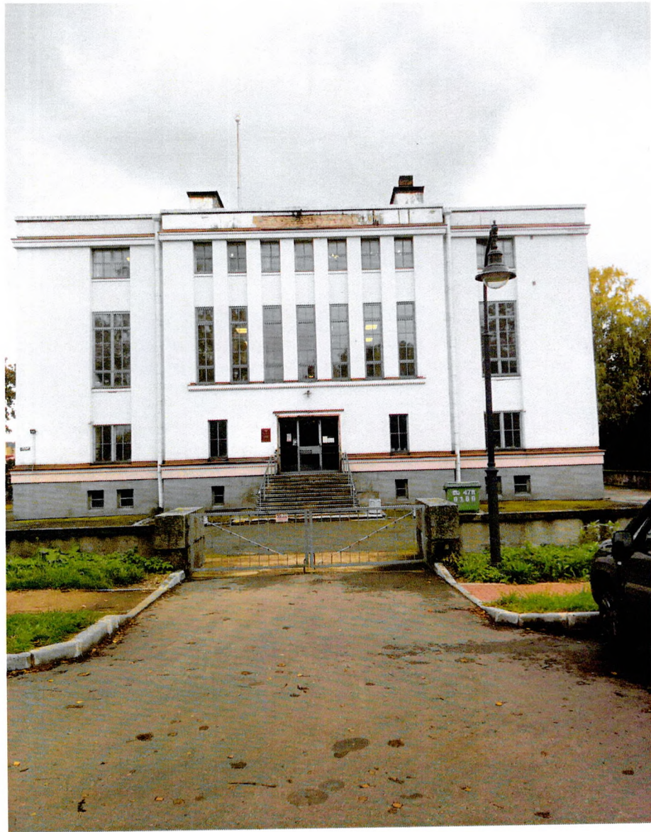
Фото 1. Главный фасад, вход в архив.