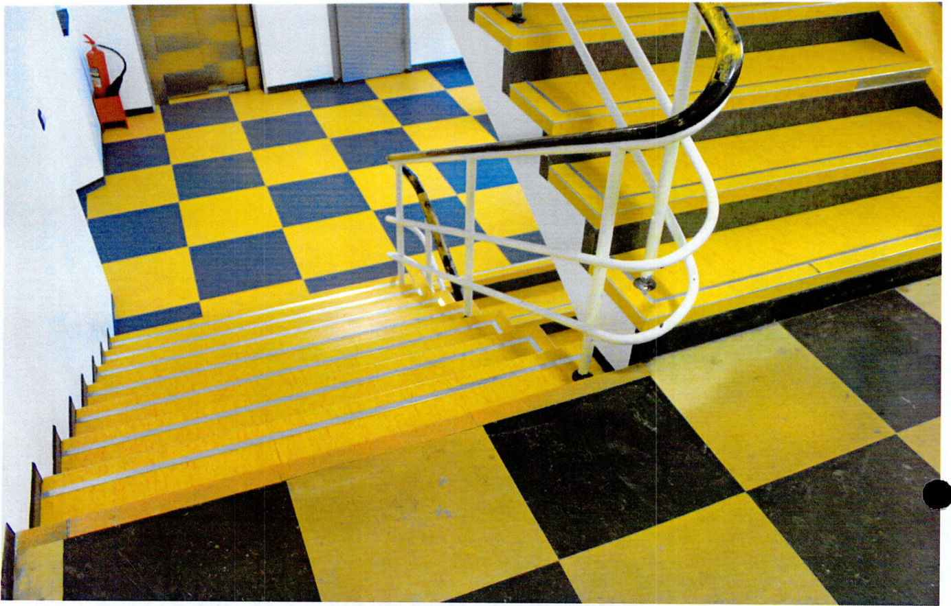
Фото 6. Лестница и лестничные пролеты между 4 и 5 этажами.