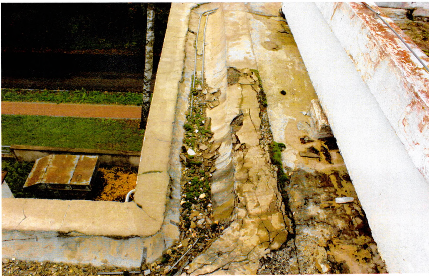
Фото 14. Водосточные желоба с разрушением верхнего штукатурного слоя, многочисленными трещинами и биопоражениями.