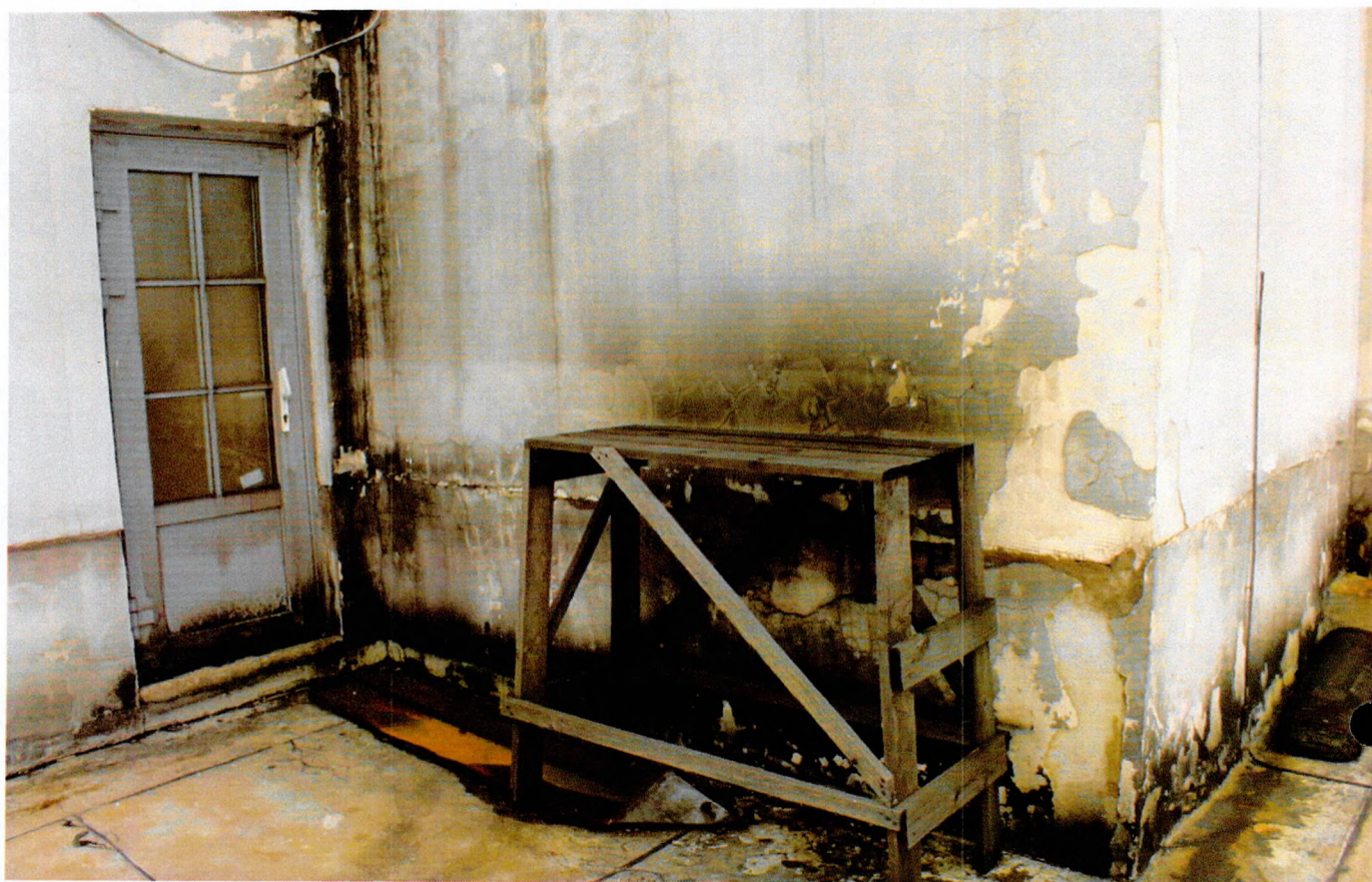
Фото 12. Стены надстройки с трещинами, отслоением штукатурного слоя, покрытые угольным налетом.