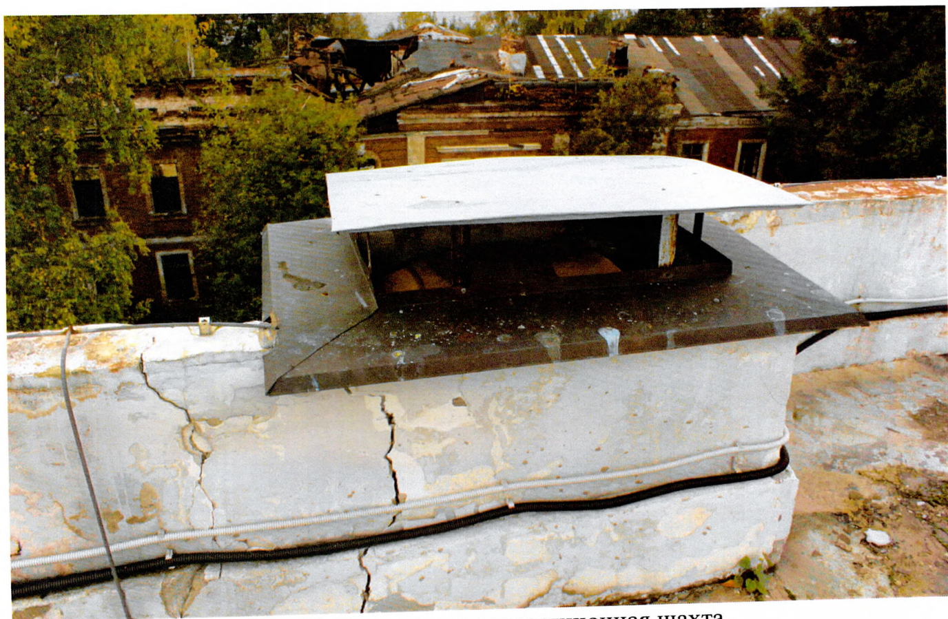
Фото 15. Встроенная вентиляционная шахта.