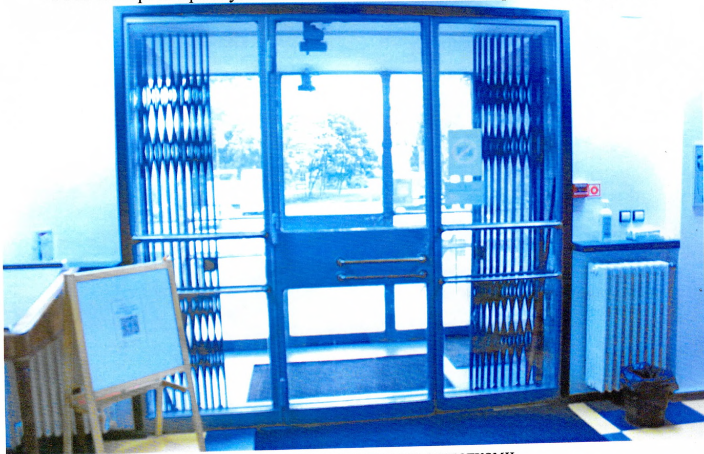
Фото 5. Входная дверь с раздвижными решетками.