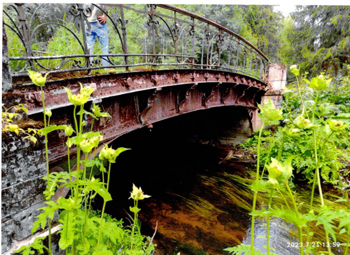
Фото 5. «Можжевеловый мост № 1». Пролётное строение моста, левый берег.