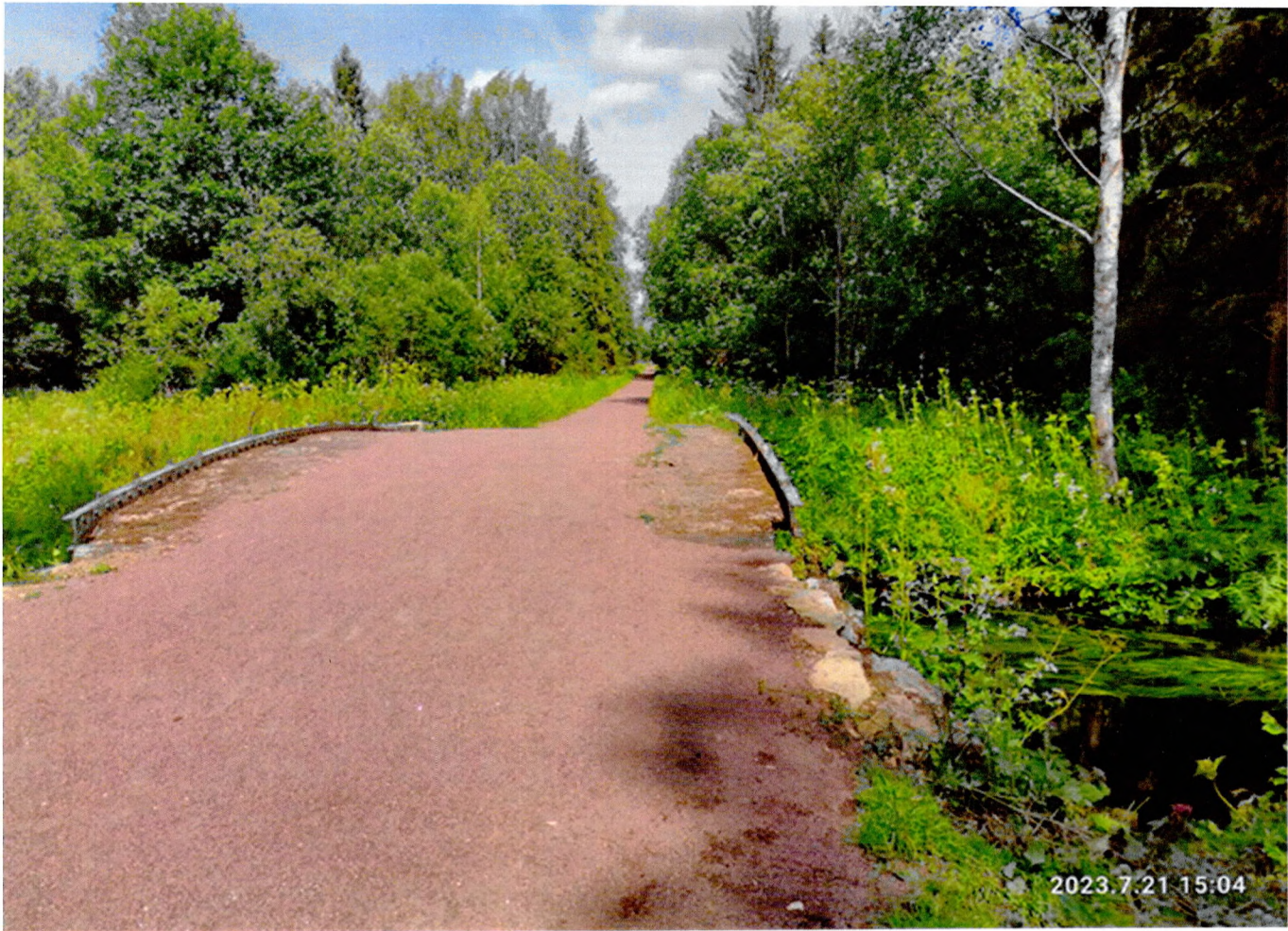
Фото 1. «Красный мост № 1». Общий вид с левого берега.

Фотографическое изображение объекта культурного наследия федерального значения «Разные парковые сооружения» в составе объекта культурного наследия федерального значения «Парк «Зверинец», местонахождение: Ленинградская область, Гатчинский муниципальный район, Гатчинское городское поселение, г. Гатчина, парк «Зверинец» (фотофиксация выполнена 21.07.2023)