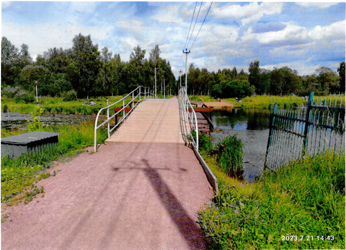
Фото 10. «Пильненский мост № 2». Общий вид левый берег