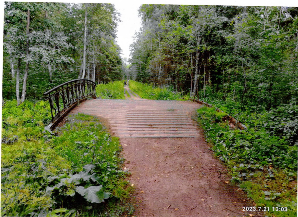
Фото 6. «Мост № 1» Общий вид на мост с левого берега.