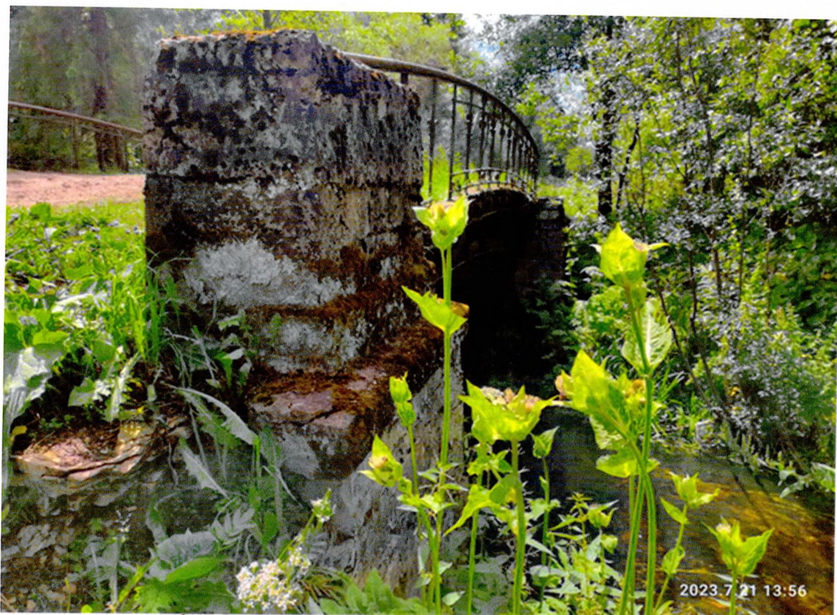
Фото 4. «Можжевеловый мост № 1». Устой моста, правый берег низовая сторона.