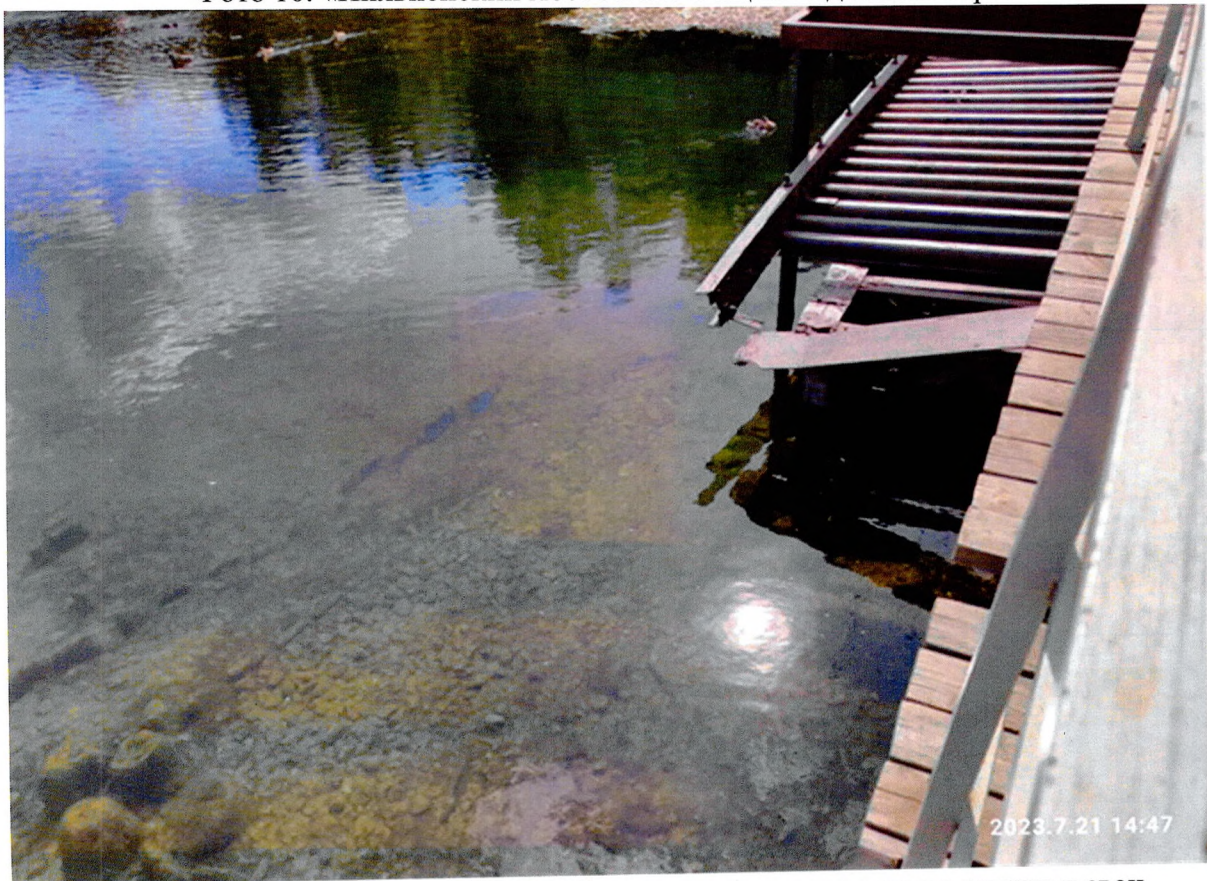
Фото 11. «Пильненский мост № 2». Сохранившаяся деревянные шпунт и сваи.