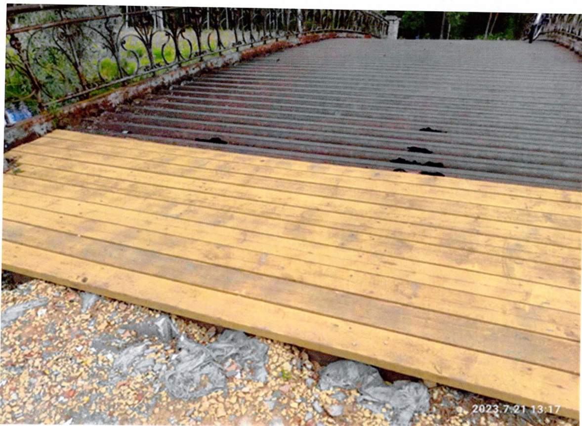
Фото 8. «Осиновый мост». Вид с левого берега, устроен дощатый настил на переходной плите к мосту