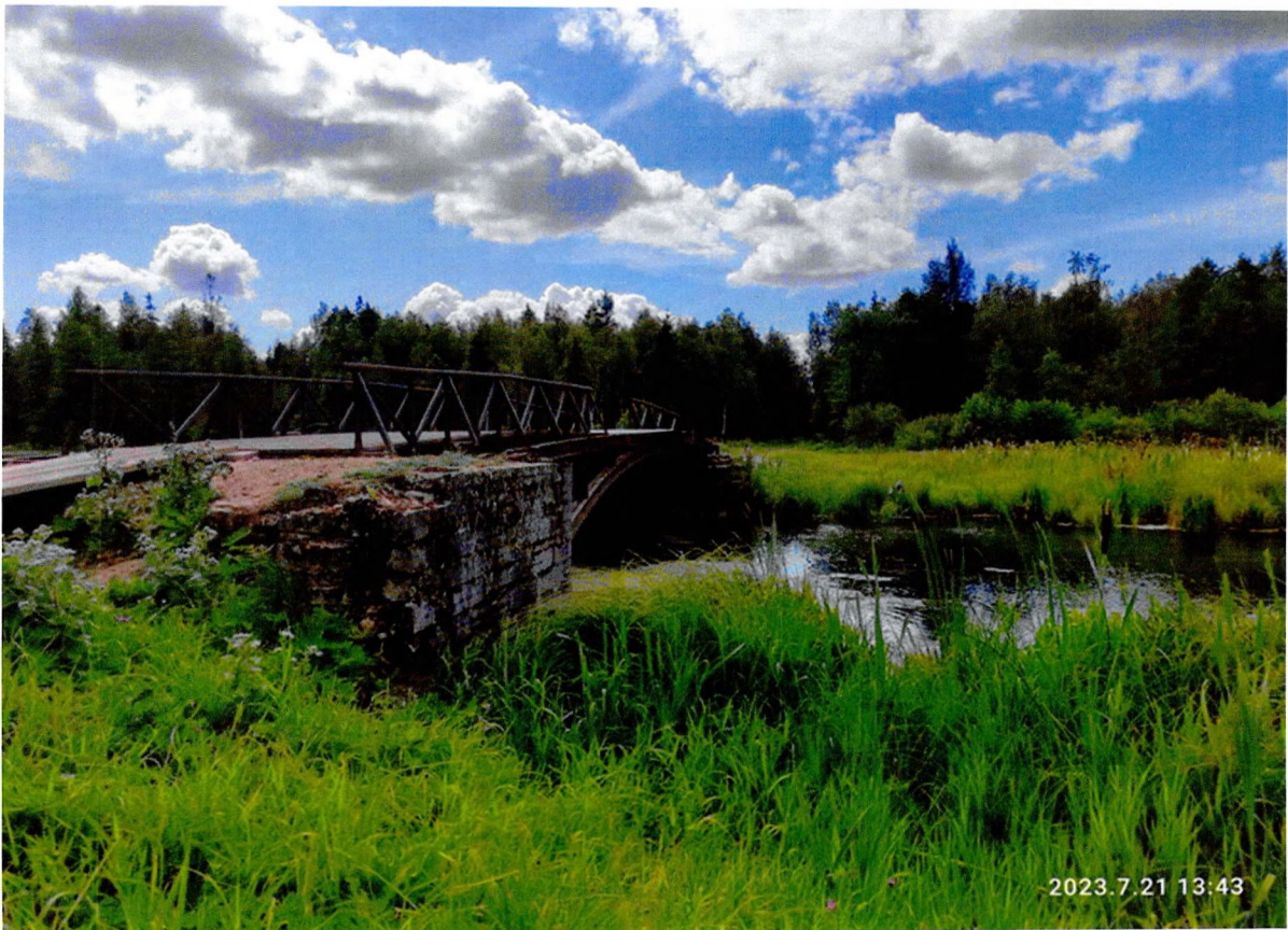
Фото 3. «Можжевеловый (Матюшкин) № 2». Правый берег.