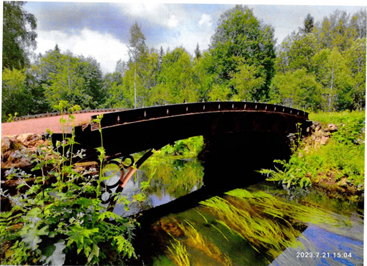
Фото 2. «Красный мост № 1». Береговые откосы.