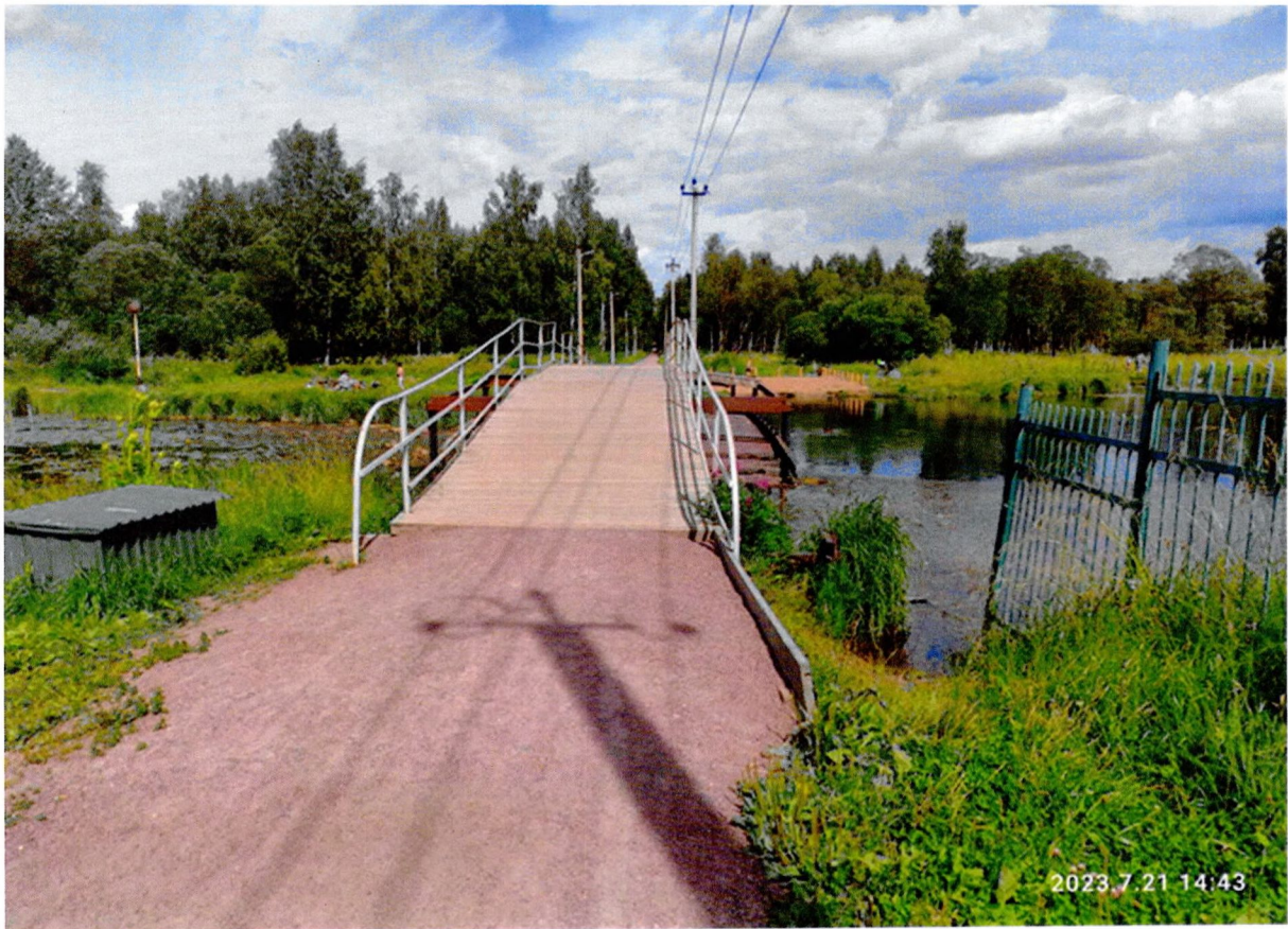
Фото 1. «Пильненский мост № 2». Общий вид с левого берега.

Фотографическое изображение объекта культурного наследия «Пильненский мост № 2» в составе объекта культурного наследия федерального значения «Разные парковые сооружения», входящего в состав объекта культурного наследия федерального значения «Парк «Зверинец», местонахождение: Ленинградская область, Гатчинский муниципальный район, Гатчинское городское поселение, г. Гатчина, парк «Зверинец» (фотофиксация выполнена 21.07.2023)