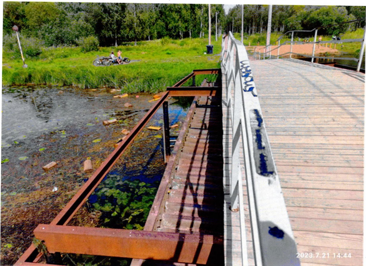
Фото 2. «Пильненский мост № 2». Сохранившаяся конструкция пролетного строения моста, низовая сторона.