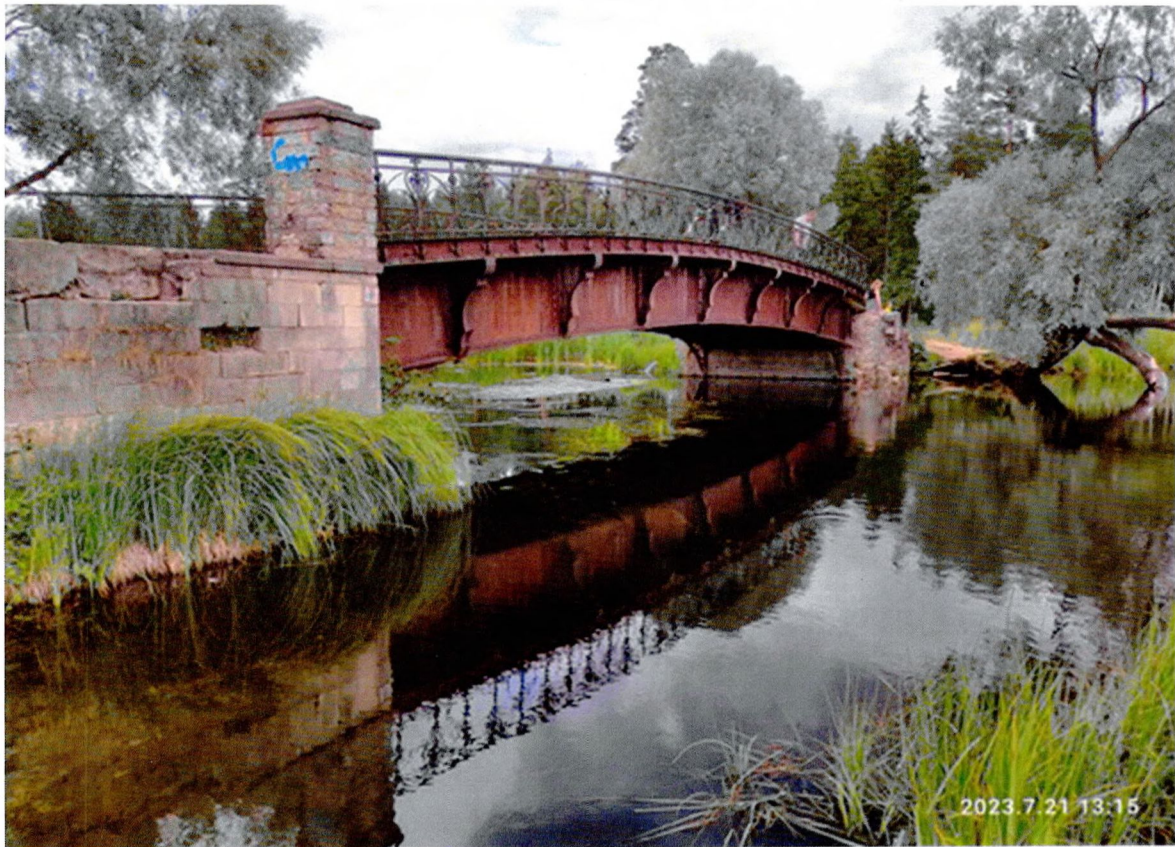
Фото 1. «Осиновый мост». Общий вид с левого берега.

Фотографическое изображение объекта культурного наследия «Осиновый мост» в составе объекта культурного наследия федерального значения «Разные парковые сооружения», входящего в состав объекта культурного наследия федерального значения «Парк «Зверинец», местонахождение: Ленинградская область, Гатчинский муниципальный район, Гатчинское городское поселение, г. Гатчина, парк «Зверинец» (фотофиксация выполнена 21.07.2023)