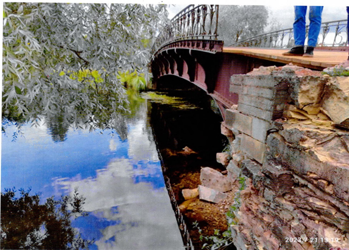
Фото 4. «Осиновый мост». Вид с правого берега по верхней стороне, зафиксированы вывалы каменных рядовых и карнизных блоков, обрушения каменной тумбы на устой.