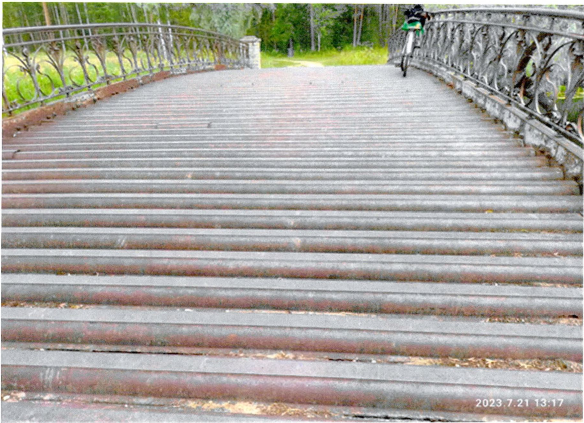
Фото 2. «Осиновый мост». Пролётное строение моста.