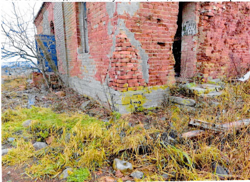
Фото 2. «Маяк с домом на о. Сухо», угол северо-западного фасада одноэтажного дома.