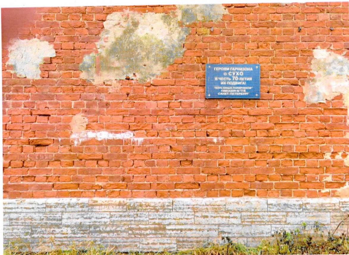
Фото 11. «Маяк с домом на о. Сухо», памятная доска на восточном фасаде одноэтажного дома.