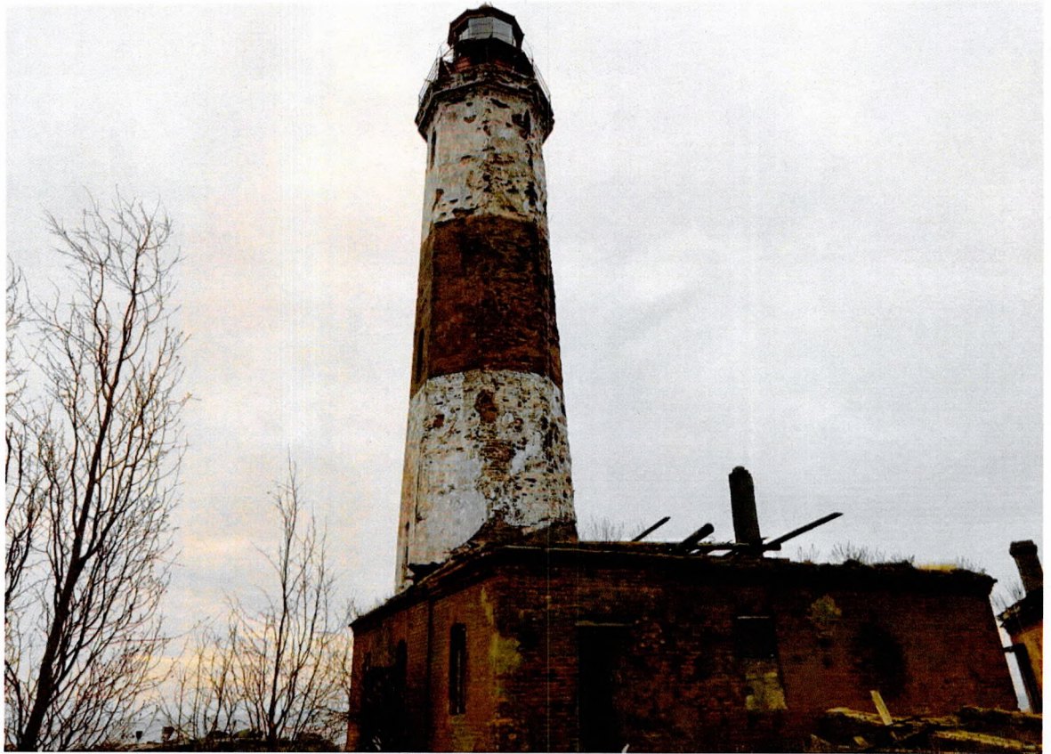
Фото 3. «Маяк с домом на о. Сухо», общий вид с северной стороны.