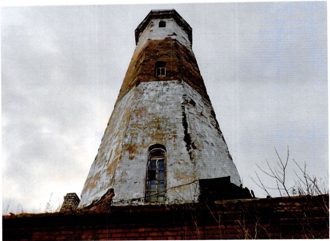
Фото 7. «Маяк с домом на о. Сухо».