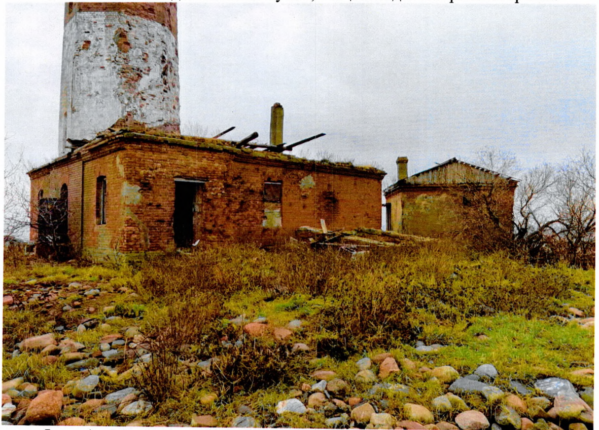
Фото 4. «Маяк с домом на о. Сухо», общий вид с северной стороны.