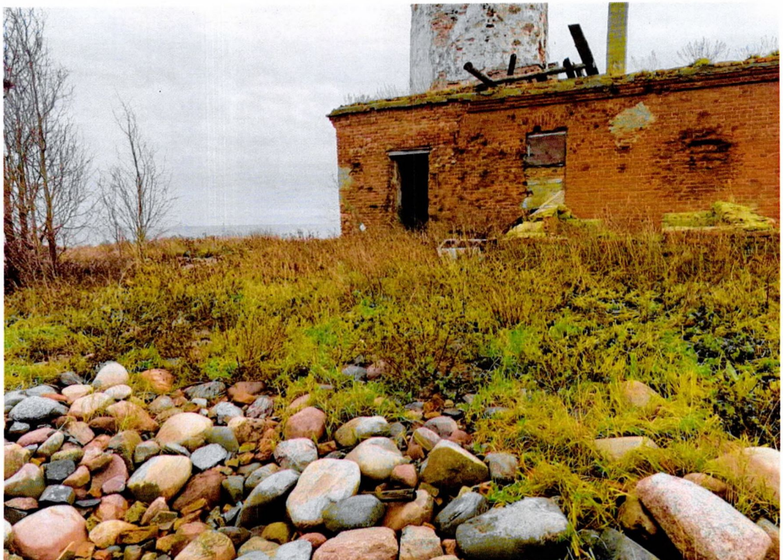
Фото 8. «Маяк с домом на о. Сухо», западный фасад одноэтажного дома.