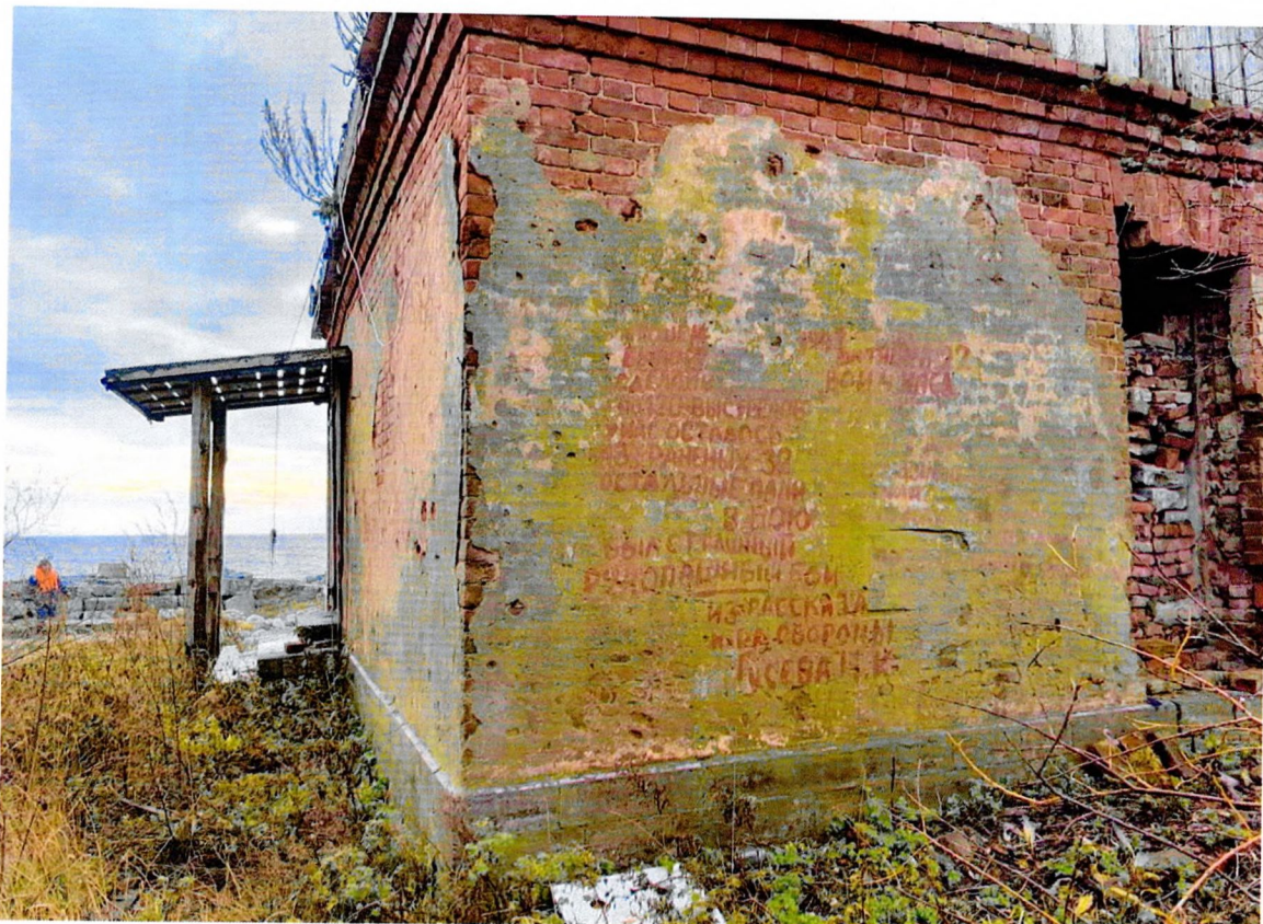
Фото 9. «Маяк с домом на о. Сухо», хозяйственная постройка, восточный фасад.