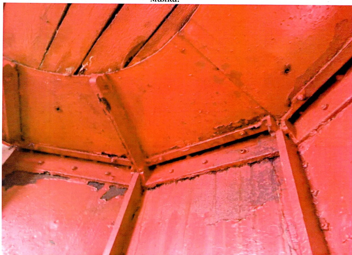
Фото 6. «Маяк с домом на о. Сухо», коррозия и утраты лакокрасочного покрытия внутренних стен верхнего помещения маяка.