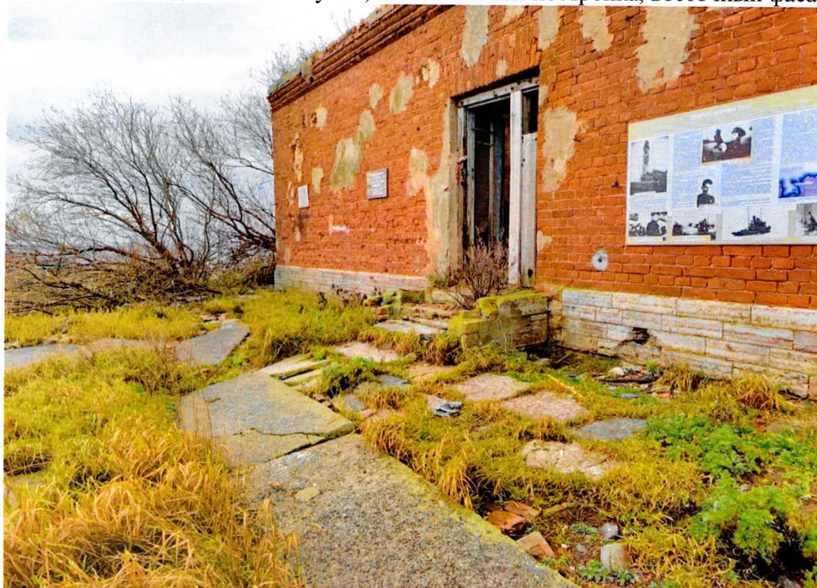
Фото 10. «Маяк с домом на о. Сухо», железобетонные плиты, ведущие к восточному входу в одноэтажный дом.