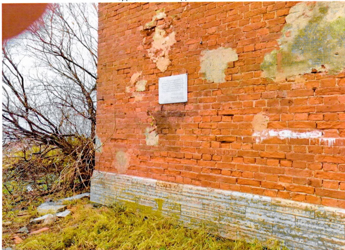
Фото 12. «Маяк с домом на о. Сухо», памятная доска на восточном фасаде одноэтажного дома.