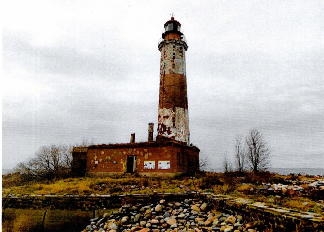
Фото 1. «Маяк с домом на о. Сухо», общий вид с восточной стороны.

Приложение № 3 к охранному обязательству собственника или иного законного владельца объекта культурного наследия регионального значения «Маяк с домом на о. Сухо», включенного в единый государственный реестр объектов культурного наследия (памятников истории и культуры) народов Российской Федерации