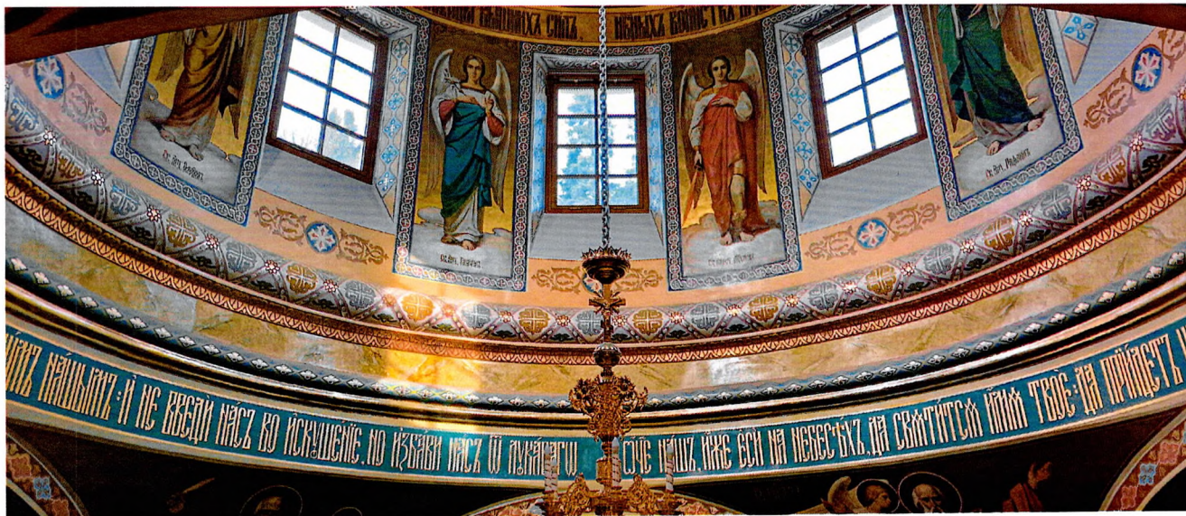
Фото 6. Вид на подкупольное пространство.