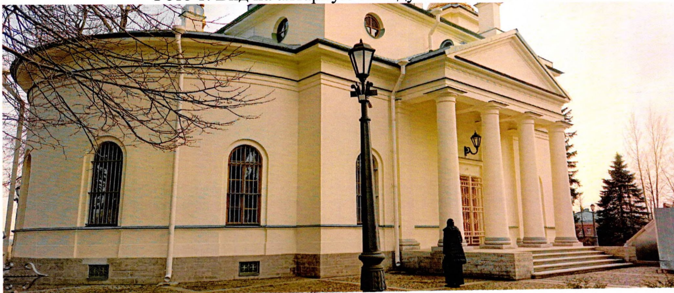
Фото 2. Вид с северо-востока.