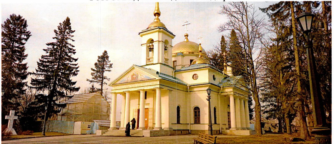
Фото 4. Общий вид с юго-запада на храм и прилегающую территорию.