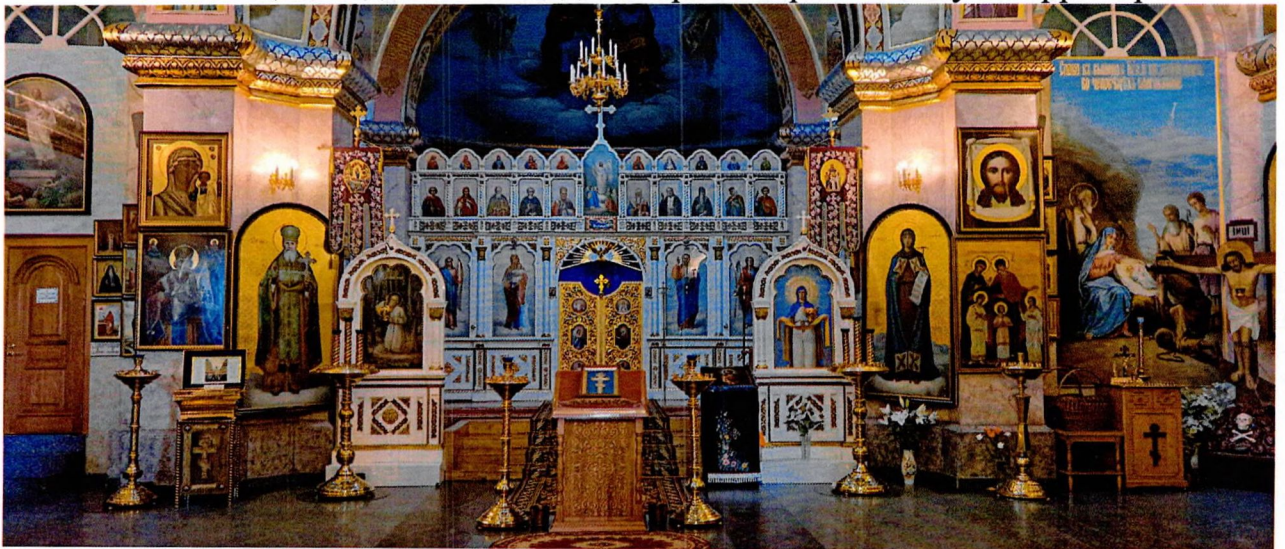
Фото 5. Интерьер храма. Вид на Царские врата иконостаса.