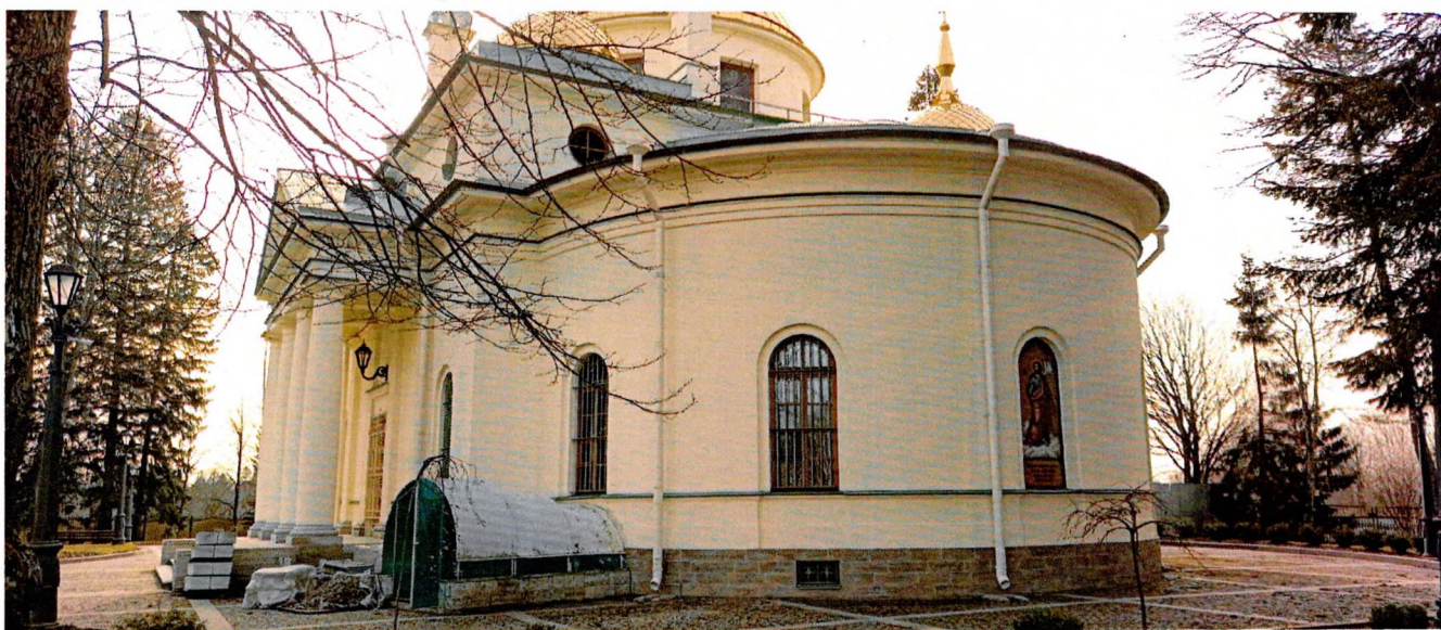
Фото 1. Вид на алтарную апсиду с юго-востока.

Приложение № 3 к охранному обязательству собственника или иного законного владельца объекта культурного наследия регионального значения «Церковь святых мучениц Веры, Надежды, Любви и матери их Софии», входящего в состав объекта культурного наследия регионального значения «Усадьба Вартемяки графов Шуваловых», включенного в единый государственный реестр объектов культурного наследия (памятников истории и культуры) народов Российской Федерации