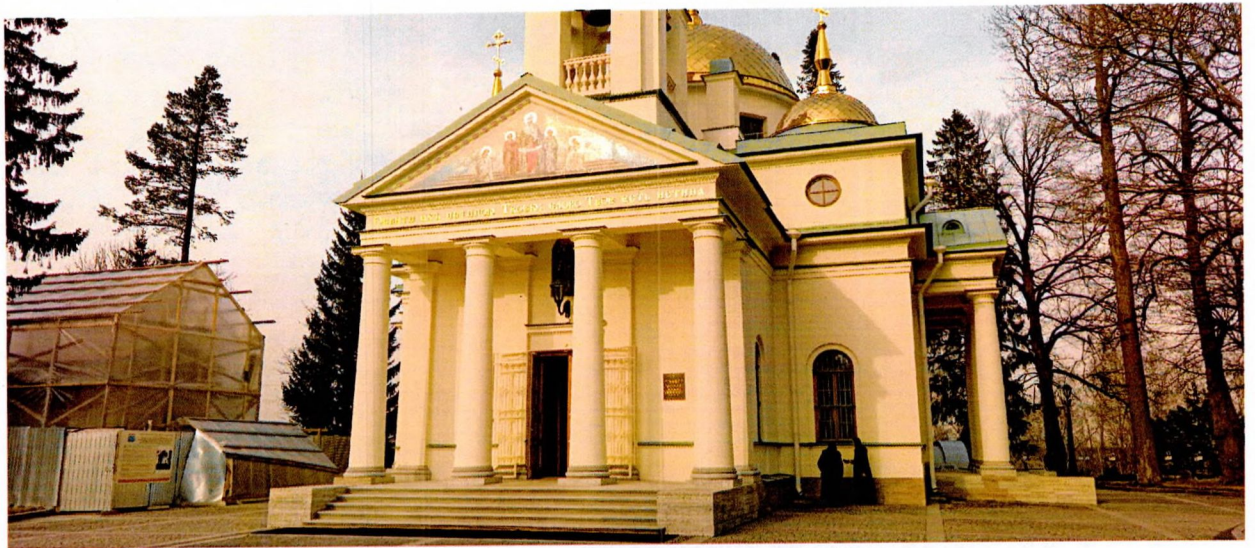
Фото 3. Вид на западный вход храма.