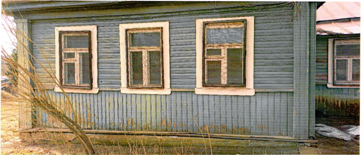
Фото 1. Вид на фасад, выходящий на Волховский проспект. Вид облицовки – доска с калевкой. Членение двухчастное: до низа окон – вертикальное, выше – горизонтальное. Торцы сруба декорированы пилястрами с капителями. Наличники окон – простые рамочные.