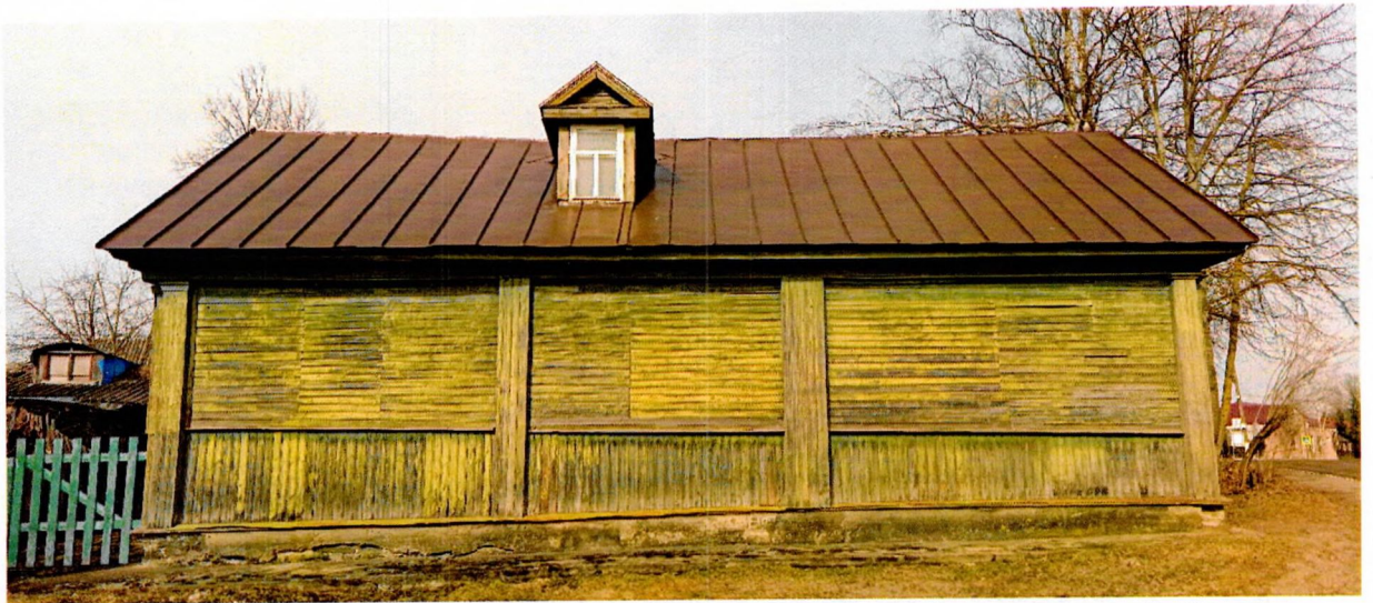
Фото 3. Вид на глухой фасад. Вид облицовки – доска с калевкой. Членение двухчастное: вертикальное и горизонтальное. Торцы бревен декорированы пилястрами.