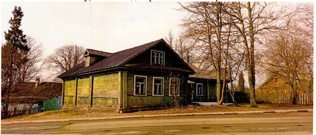
Фото 5. Общий вид на здание и прилегающую территорию со стороны Волховского проспекта.