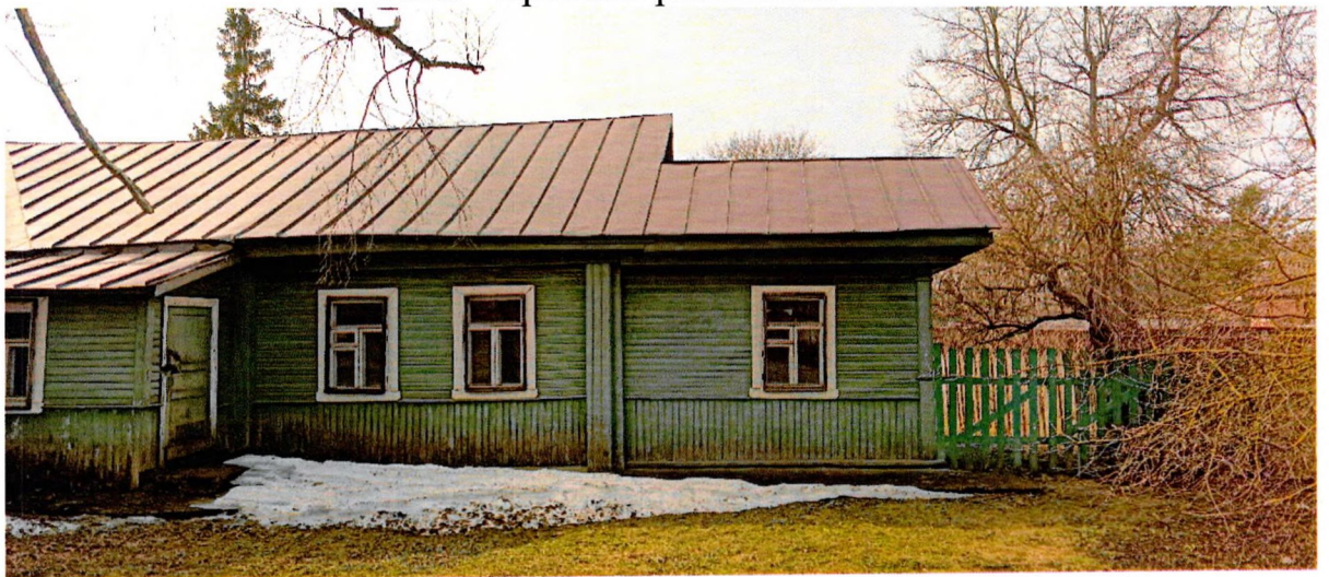
Фото 2. Вид на фасад, выходящий на Волховский проспект.