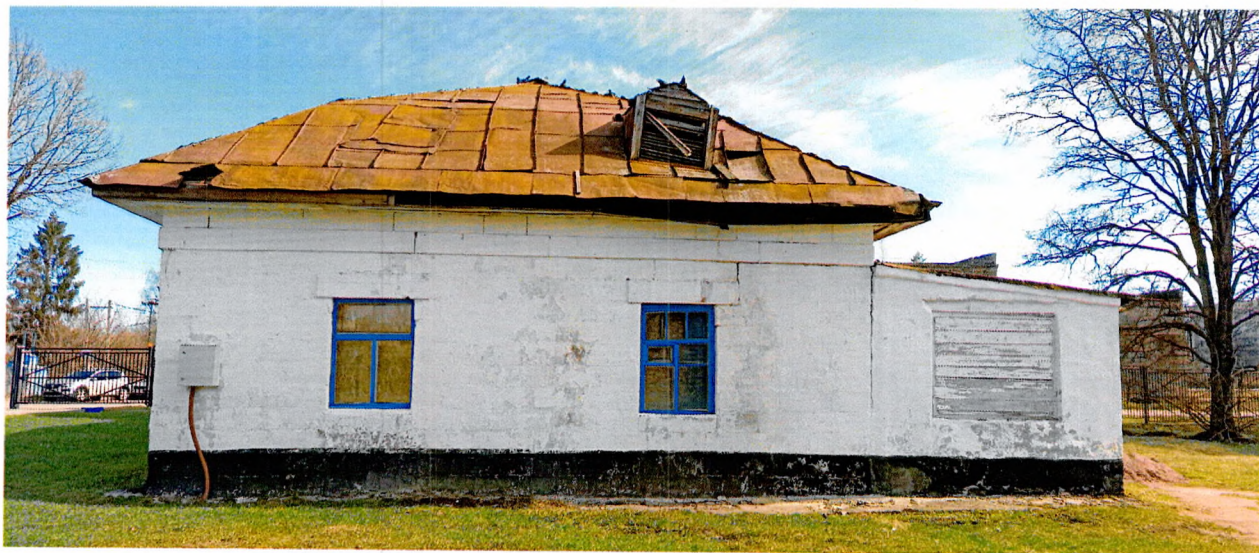
Фото 1. Вид на западный фасад.

Приложение № 3 к охранному обязательству собственника или иного законного владельца объекта культурного наследия регионального значения «Каменный корпус у перекрестка дорог (баня и столовая)», входящего в состав объекта культурного наследия «Усадьба Веймарнов - Комплекс построек земского сельскохозяйственного училища», включенного в единый государственный реестр объектов культурного наследия (памятников истории и культуры) народов Российской Федерации