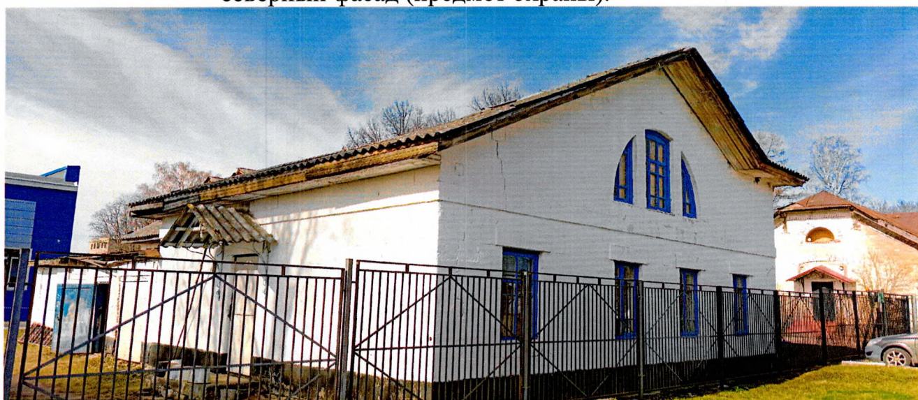
Фото 7. Вид с востока на двухъярусную часть здания.