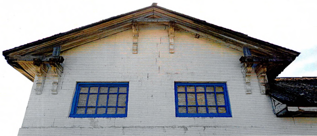
Фото 3. Фронтон двухъярусной части северного фасада. Два прямоугольных окна многочастной расстекловки. Свес кровли оперт на деревянные фигурные кронштейны (предмет охраны).