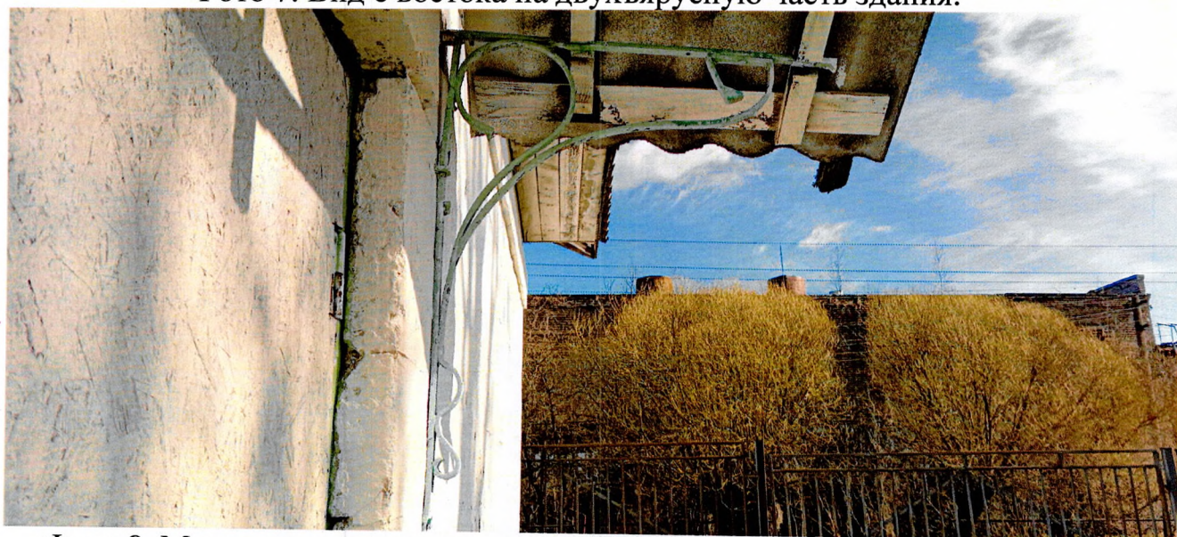
Фото 8. Металлические кованые кронштейны в стиле «модерн» южного крыльца, имитирующие растительный орнамент.