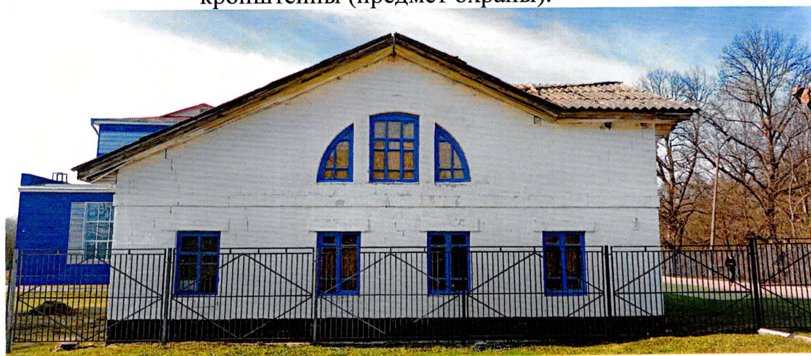
Фото 4. Вид на восточный фасад. Расположение окон в два яруса. Оконные проемы первого яруса прямоугольные, второго – полуциркульное трехчастное (предмет охраны).