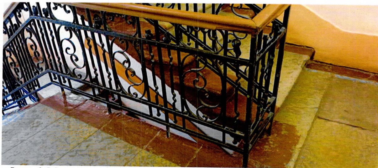
Фото 6. Металлическое кованное ограждение парадной лестницы (предмет охраны).