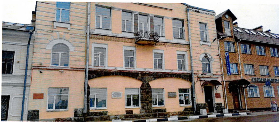
Фото 3. Вид на главный фасад. Облицовка – гладкая штукатурная поверхность и гранитные плиты с колотой текстурой.