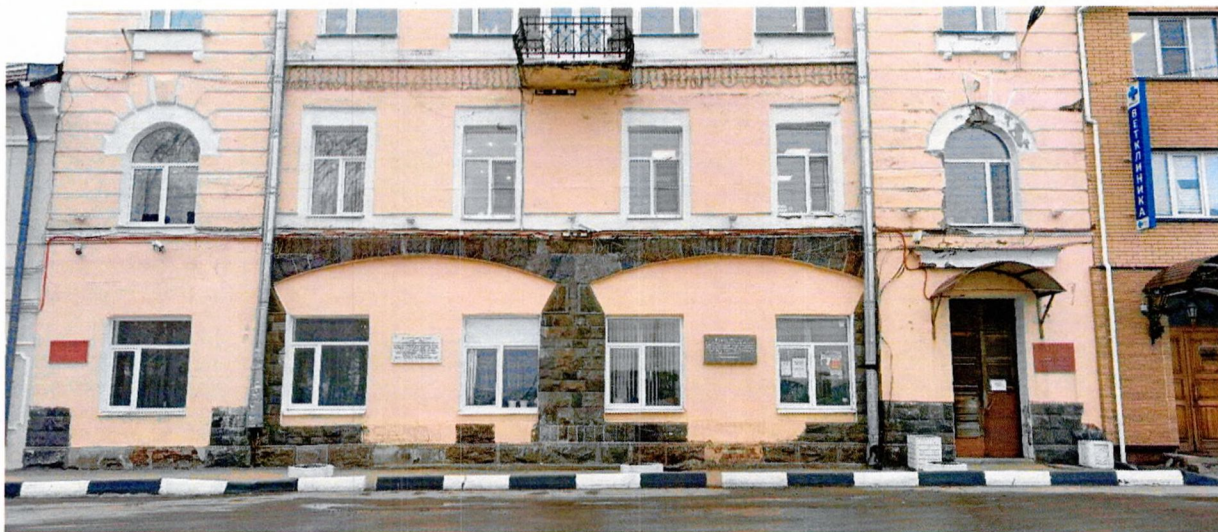
Фото 1. Вид на главный фасад, выходящий на ул. Жука.

Приложение № 3 к охранному обязательству собственника или иного законного владельца объекта культурного наследия регионального значения «Здание гостиницы с магазинами», включенного в единый государственный реестр объектов культурного наследия (памятников истории и культуры) народов Российской Федерации