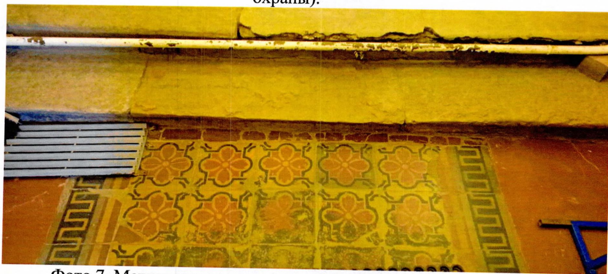
Фото 7. Метлахская плитка при главном входе (предмет охраны).