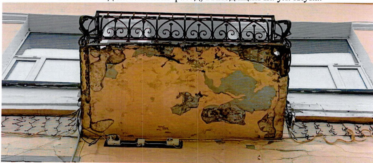
Фото 2. Балкон 3 этажа (предмет охраны).