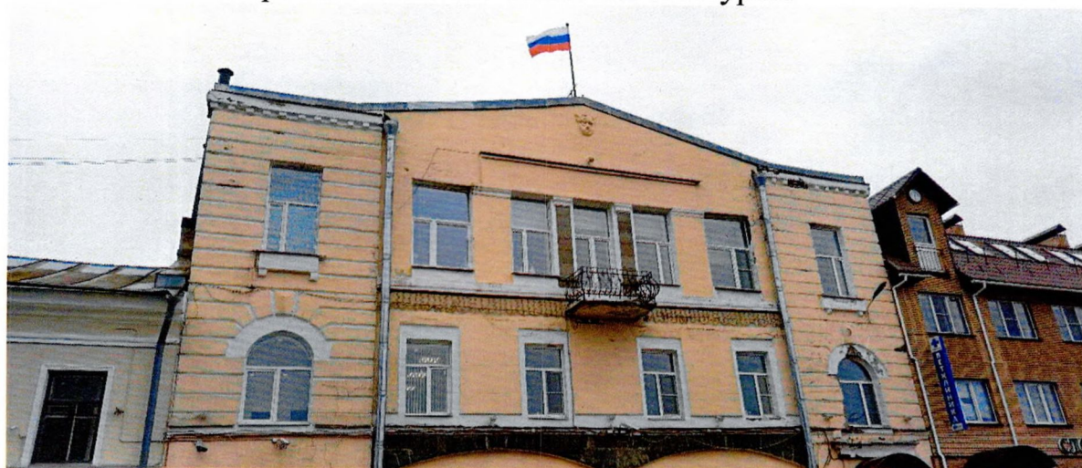
Фото 4. Вид на щипцовый фронто́н главного фасада. Декор в виде лепного барельефа (предмет охраны).