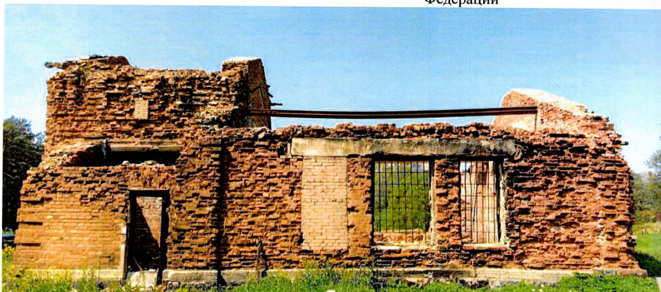
Фото 1. Общий вид восточного фасада. Наблюдается деструкция кирпича по всей плоскости фасада.