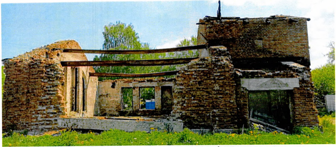
Фото 3. Общий вид западного фасада.