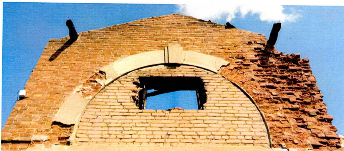
Фото 6. Арочный проем второго света декорирован архивольтом с трехчастным замковым камнем и уширениями в основании, поверхность оштукатурена (предмет охраны).