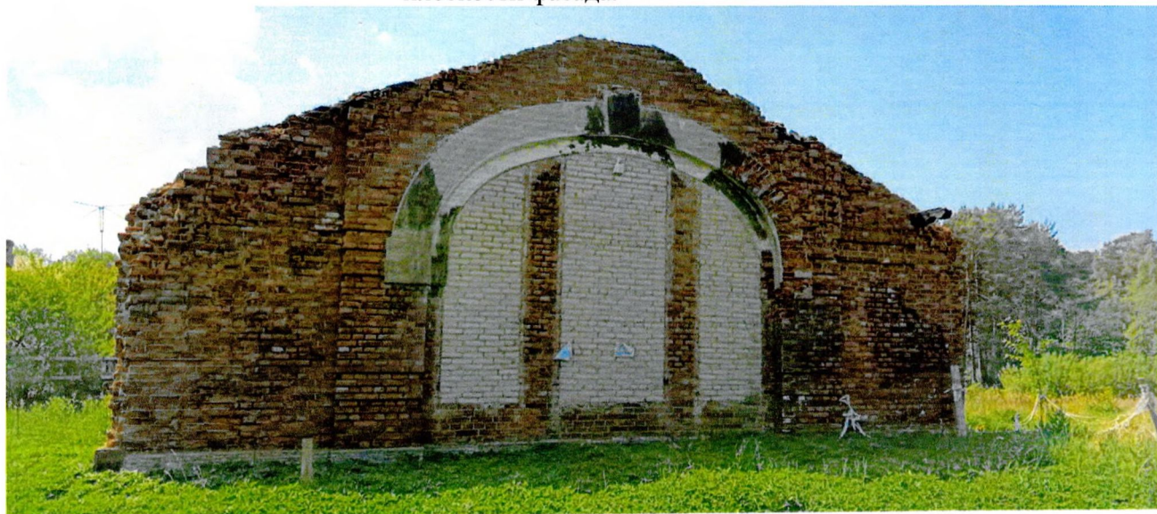
Фото 2. Общий вид северного фасада. Панорамное окно с двухцентровым арочным завершением, характерное для стиля модерн. Проем декорирован кирпичным архивольтом с замковым камнем и уширениями в основании, поверхность оштукатурена (предмет охраны).