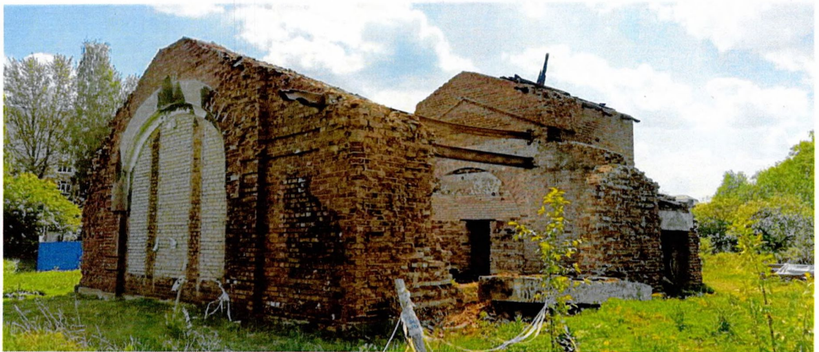
Фото 11. Общий вид с северо-запада.