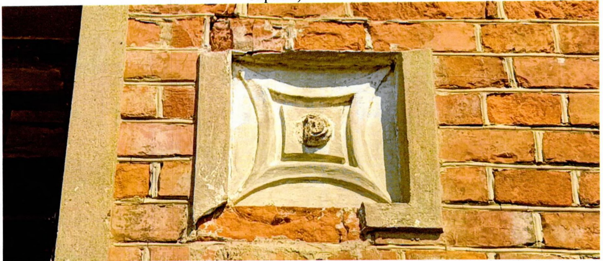
Фото 10. Декоративный элемент южного фасада в виде вставки лепной розетки (предмет охраны).