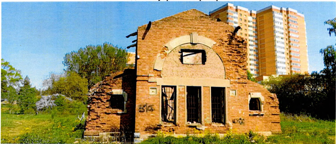
Фото 5. Общий вид южного фасада. К фасаду примыкает двухуровневый ризалит в два света.