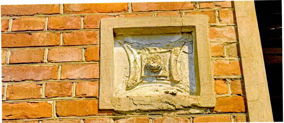
Фото 9. Декоративный элемент южного фасада в виде вставки лепной розетки (предмет охраны).