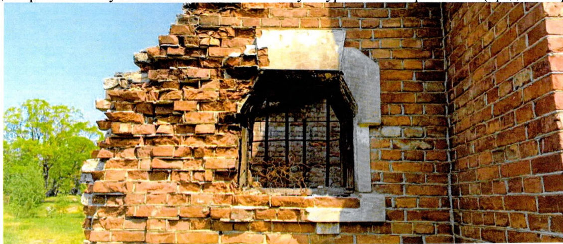
Фото 8. Трапециевидный оконный проем южного фасада в западном крыле здания. Декор в виде кирпичного ступенчатого наличника с оштукатуренной поверхностью (предмет охраны).