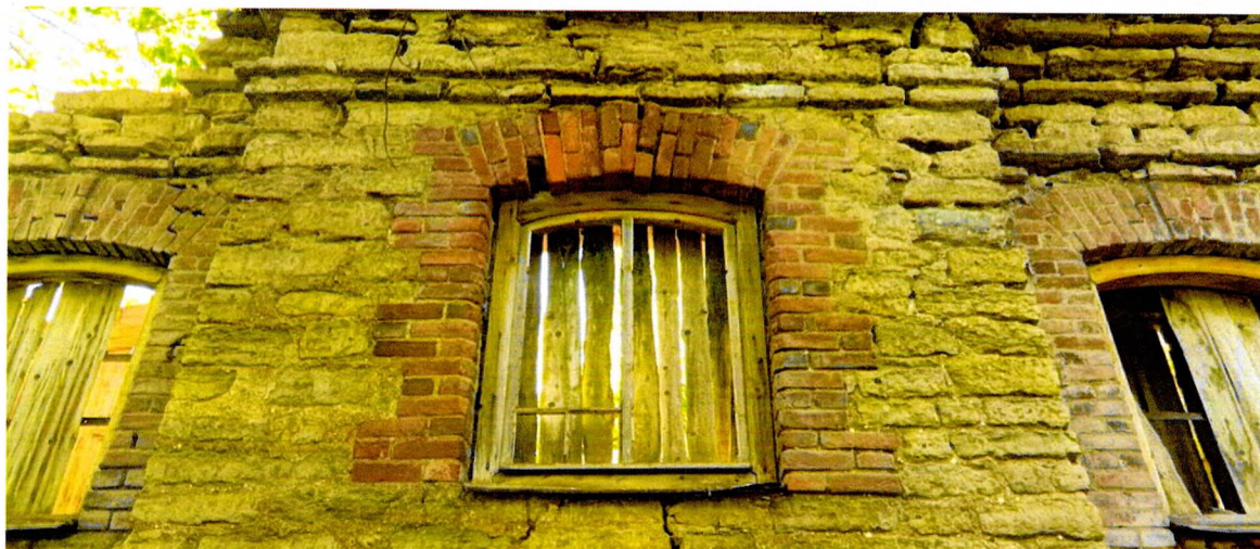
Фото 1. Фрагмент северного фасада. Вид на оконный проем ризалита. Обрамление из кирпичной кладки. Перемышка кирпичная клинчатая. Декор в виде кирпичного замкового камня.

Приложение № 3 к охранному обязательству собственника или иного законного владельца объекта культурного наследия регионального значения «Каретный сарай», входящего в состав объекта культурного наследия «Усадьба», включенного в единый государственный реестр объектов культурного наследия (памятников истории и культуры) народов Российской Федерации