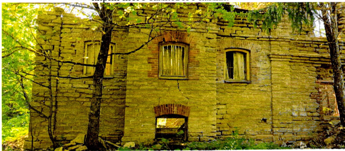
Фото 2. Фрагмент северного фасада. Выступающий ризалит в одну световую ось. Окно ризалита декорировано кирпичным замковым камнем. Оконные проемы обрамлены кирпичной кладкой.