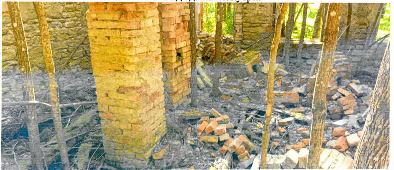
Фото 7. Вид здания изнутри.