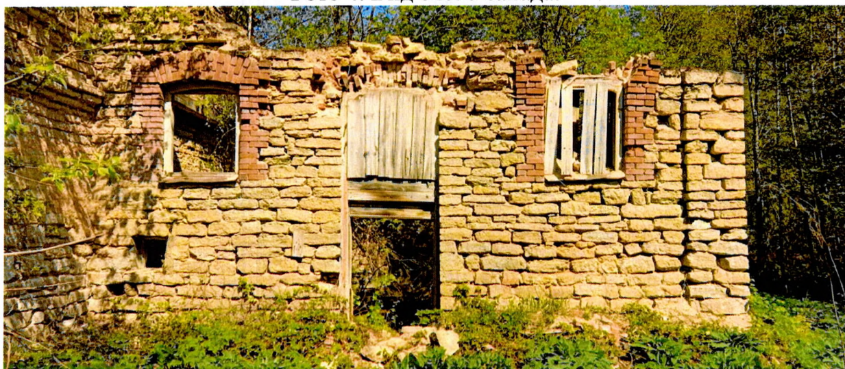
Фото 5. Фрагмент южного фасада.