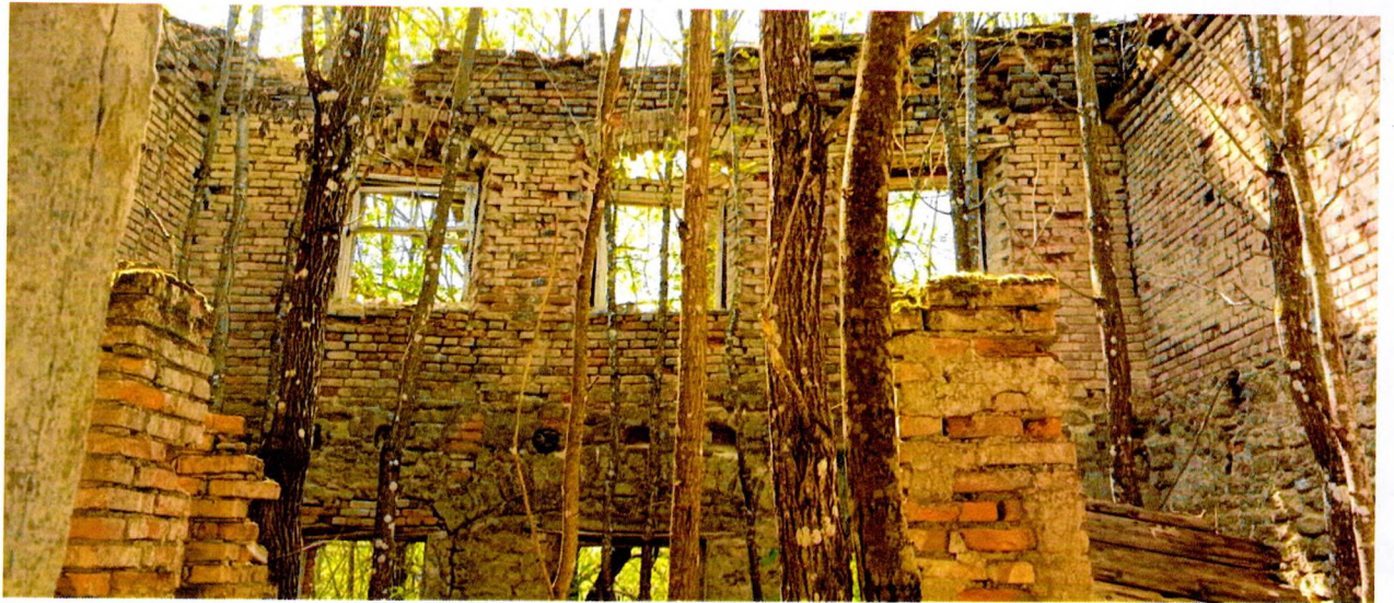
Фото 6. Вид здания изнутри.