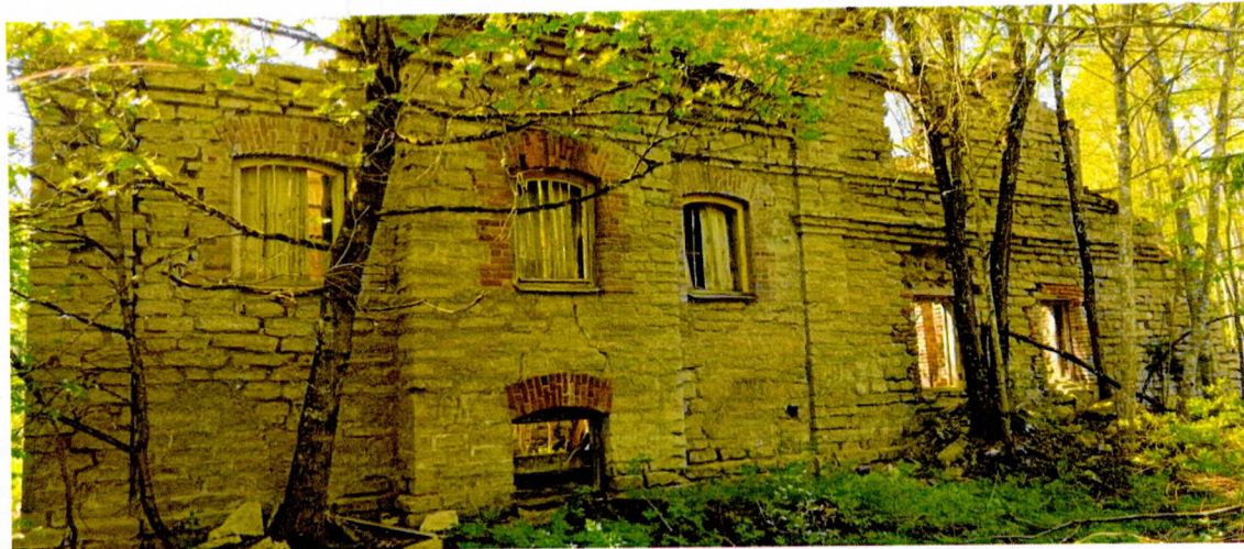
Фото 3. Общий вид северного фасада.