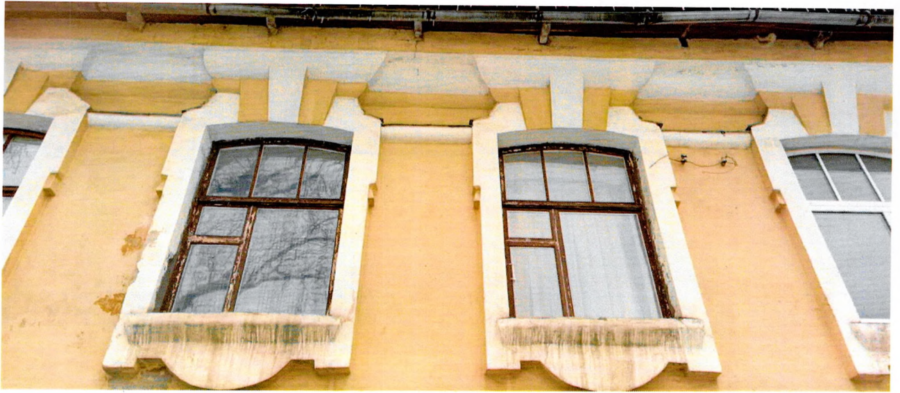
Фото 6. Вид на оконные проемы 2 этажа северного фасада.