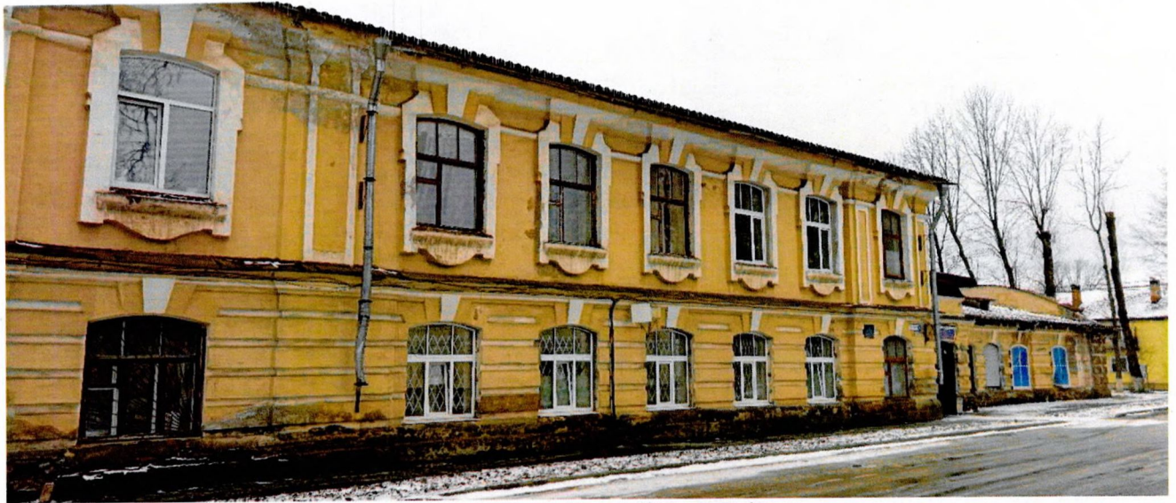
Фото 3. Вид на северный фасад.