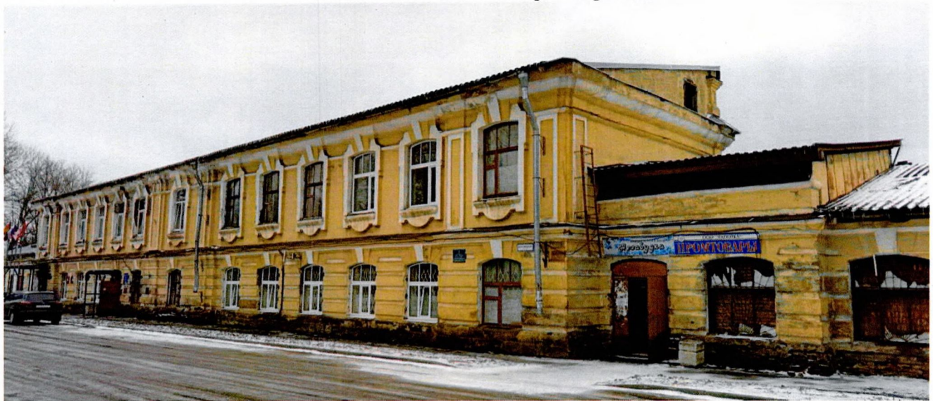
Фото 4. Северный фасад. Вид с северо-запада.