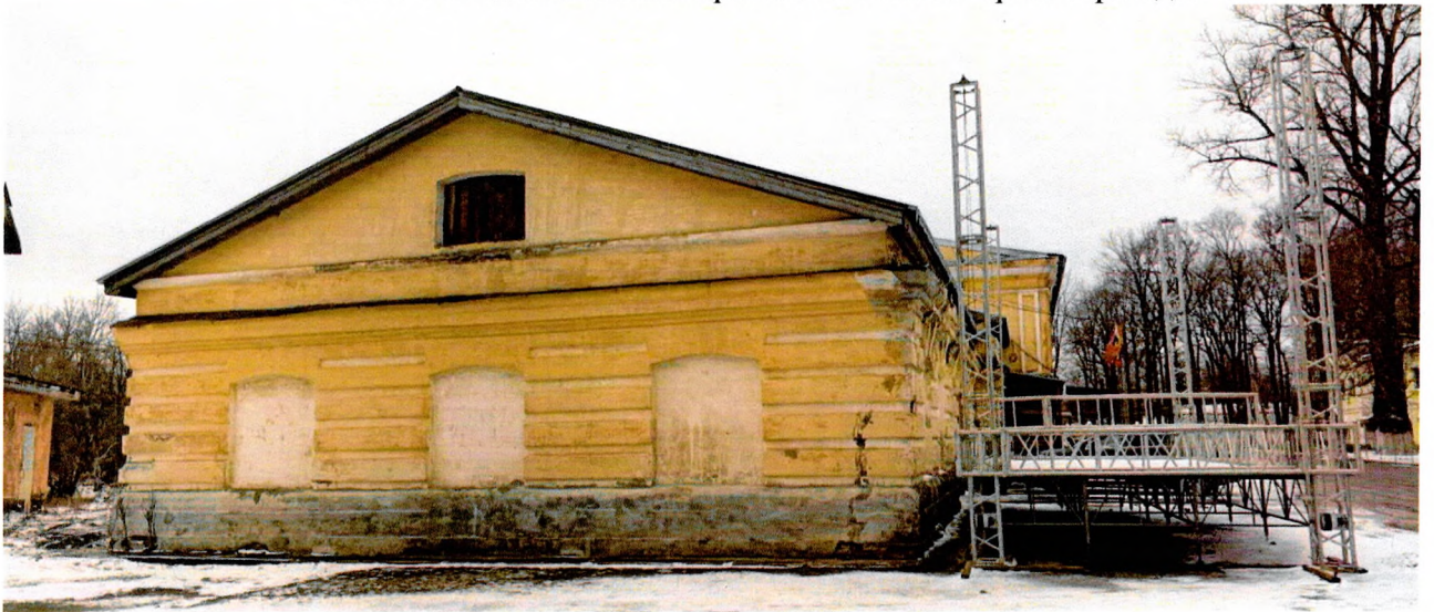
Фото 7. Восточный фасад.