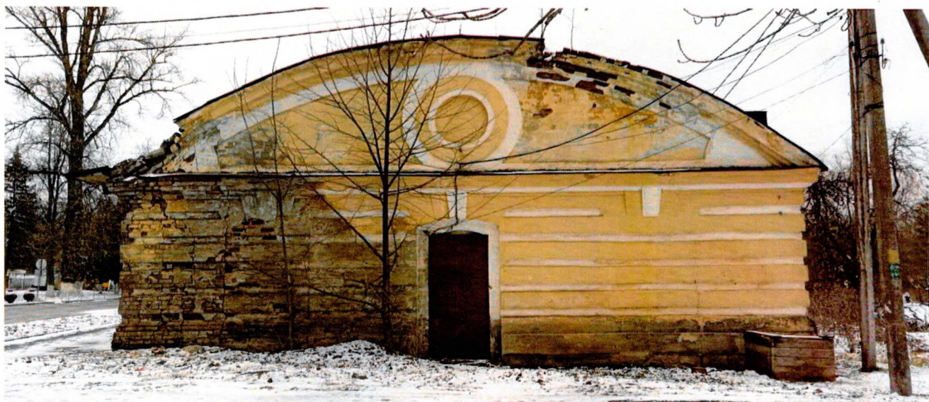
Фото 1. Общий вид западного фасада.