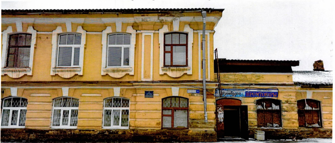
Фото 5. Фрагмент северного фасада, вид на центральную часть здания.