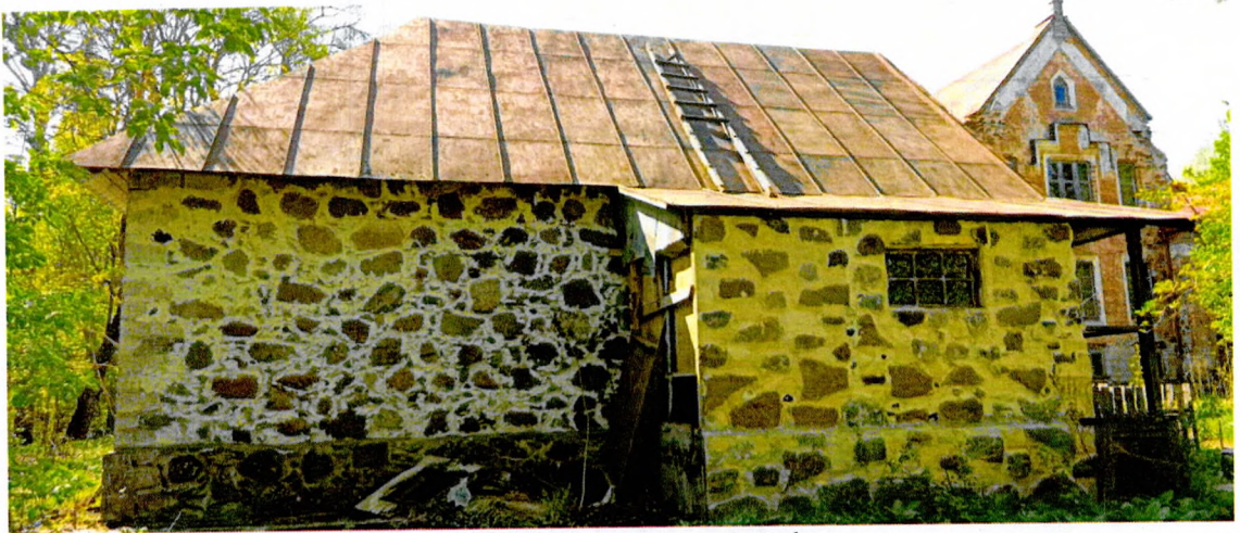
Фото 3. Вид на северный фасад.