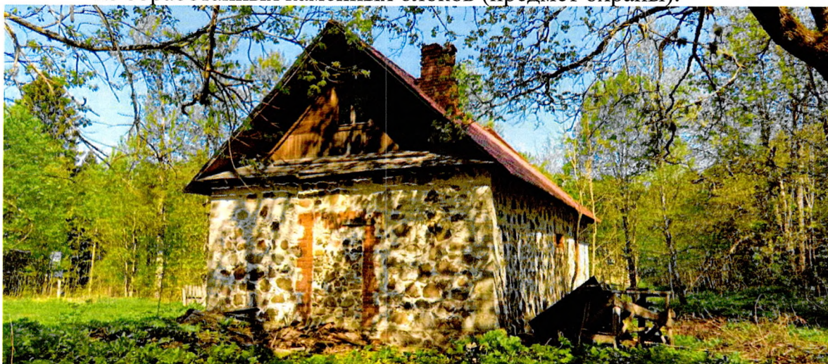
Фото 7. Общий вид на южный фасад.