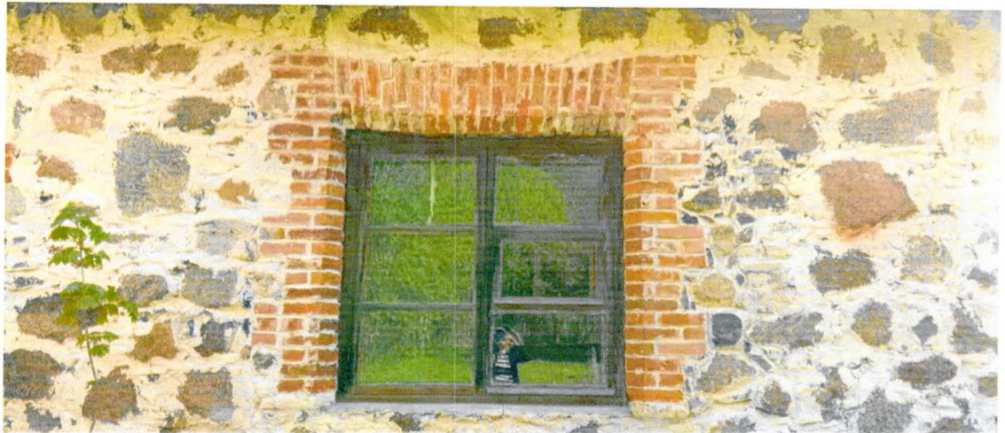
Фото 1. Оконный проем западного фасада. Стены выполнены из крупных гранитных валунов, оконные проемы обрамлены кирпичной кладкой (предмет охраны).