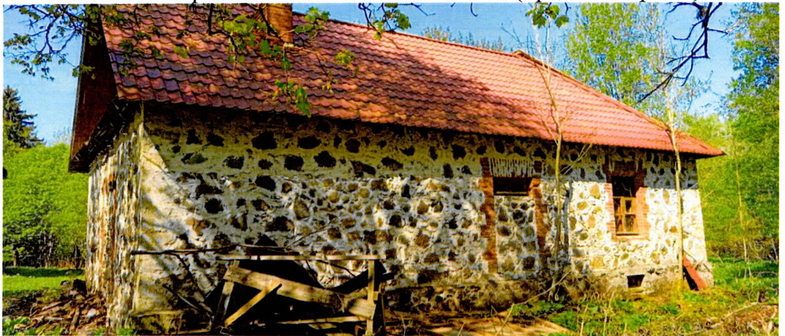
Фото 5. Вид на восточный фасад.