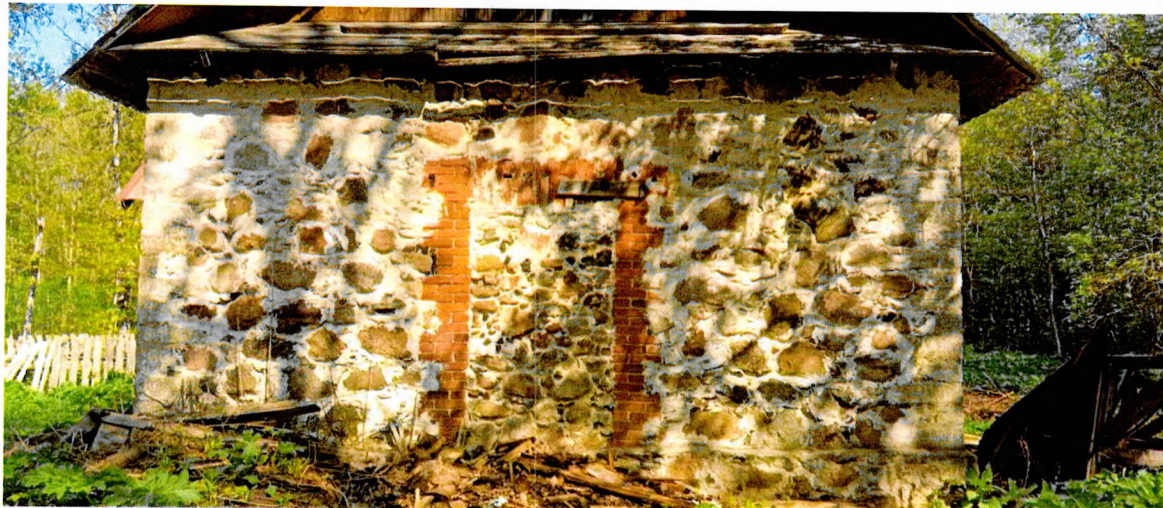
Фото 6. Фрагмент южного фасада. Стены выполнены из крупных гранитных валунов, оконные проемы обрамлены кирпичной кладкой. Углы здания выполнены из обработанных каменных блоков (предмет охраны).