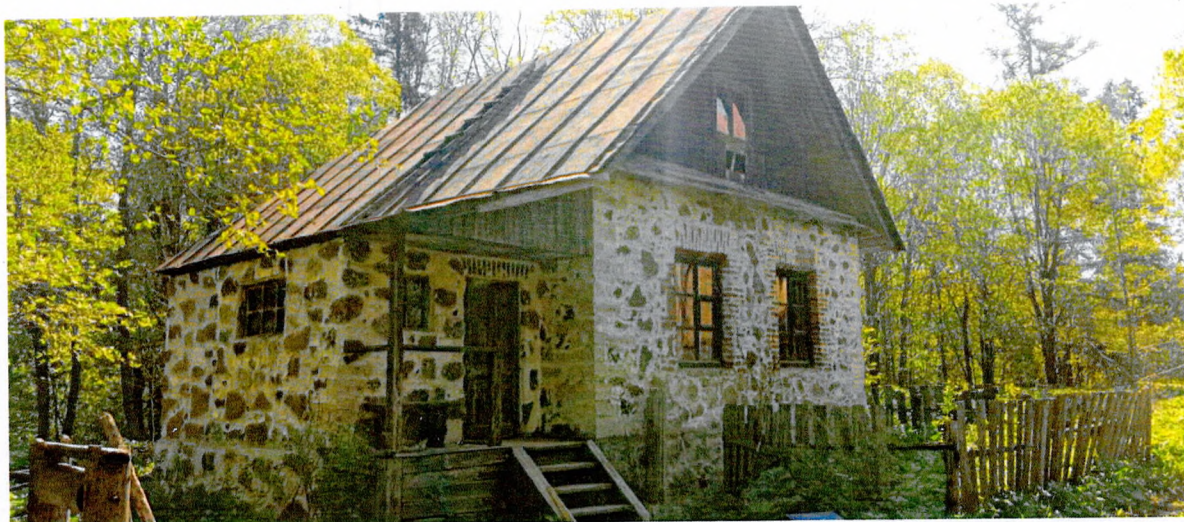
Фото 9. Общий вид с северо-запада.