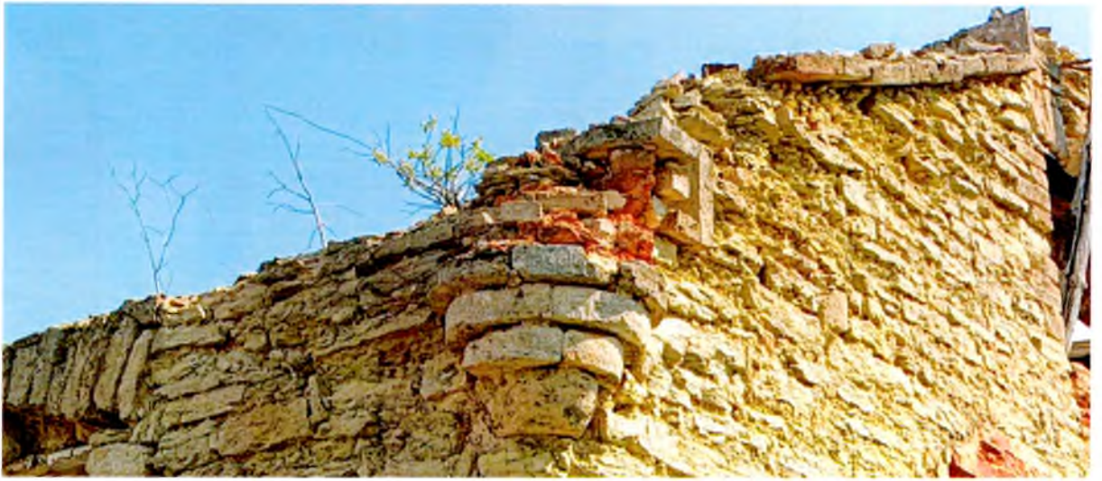
ФОТО 3. Декоративный элемент в виде стилизованной башенки-пинакля на юго-западном углу здания молочного дома. Башенка выполнена из кирпича на каменной консоли.