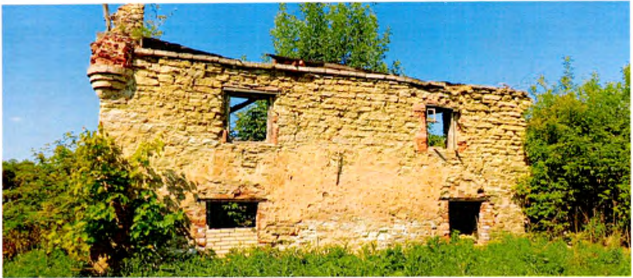
ФОТО 6. Восточный фасад молочного дома.