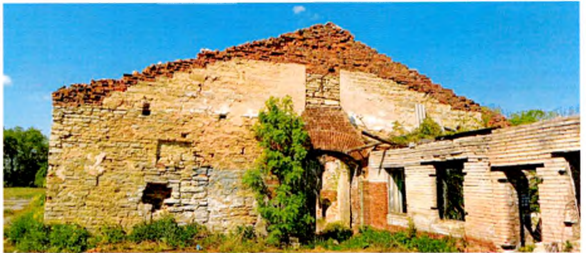
ФОТО 9. Восточный фасад коровника. Историческая конструкция наружных стен – каменная кладка.