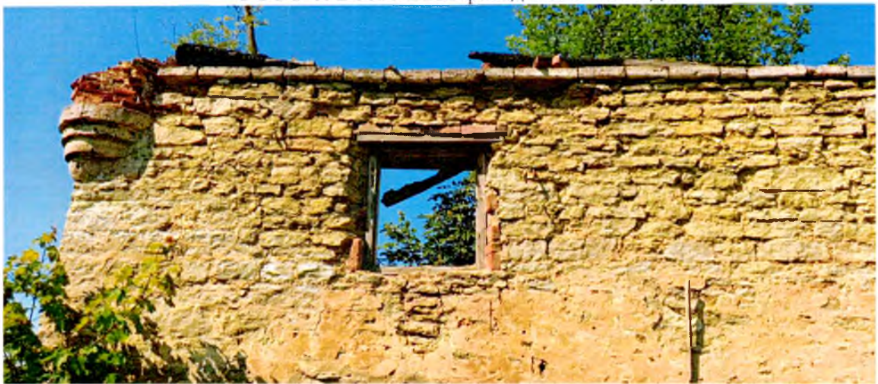
ФОТО 7. Фрагмент восточного фасада.