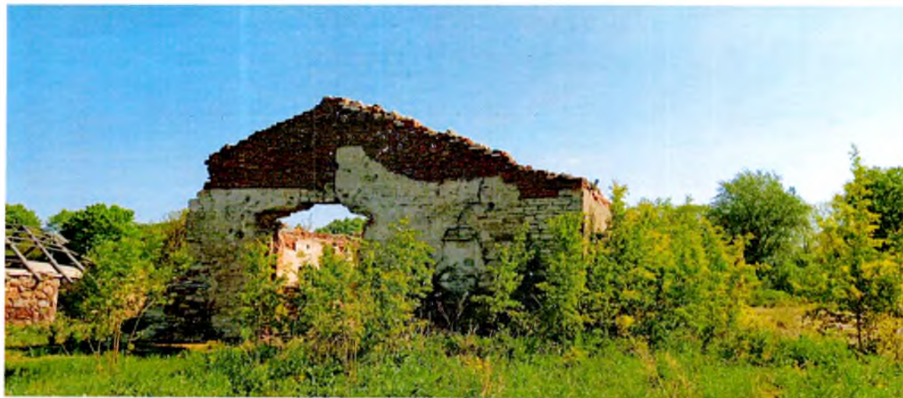
ФОТО 12. Западный фасад коровника.