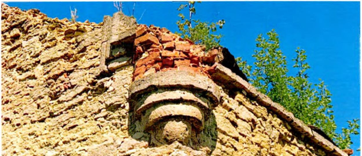
ФОТО 2. Декоративный элемент в виде стилизованной башенки-пинакля на юго-восточном углу здания молочного дома. Башенка выполнена из кирпича на каменной консоли.