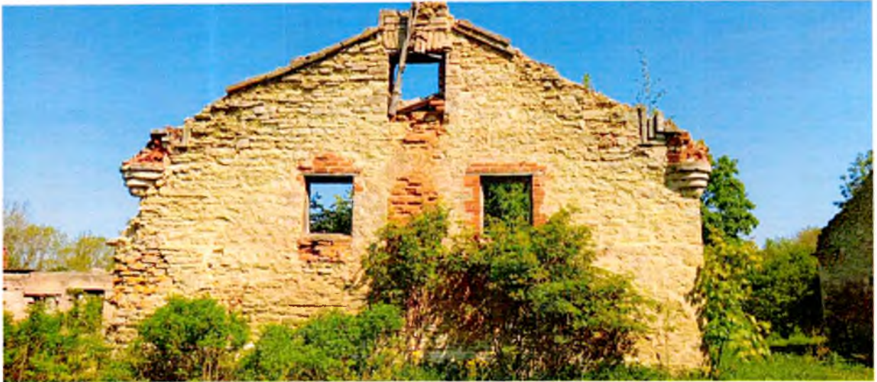
ФОТО 1. Вид на южный фасад молочного дома. Наружные стены выполнены из плитного известняка на известковом связующем растворе. Венчающий профилированный ступенчатый карниз частично утрачен. По углам располагаются стилизованные башенки-пинакли.

Приложение № 3 к охранному обязательству собственника или иного законного владельца объекта культурного наследия регионального значения «Молочный дом с коровником», в составе объекта культурного наследия регионального значения «Мыза «Липинская»», включенного в единый государственный реестр объектов культурного наследия (памятников истории и культуры) народов Российской Федерации