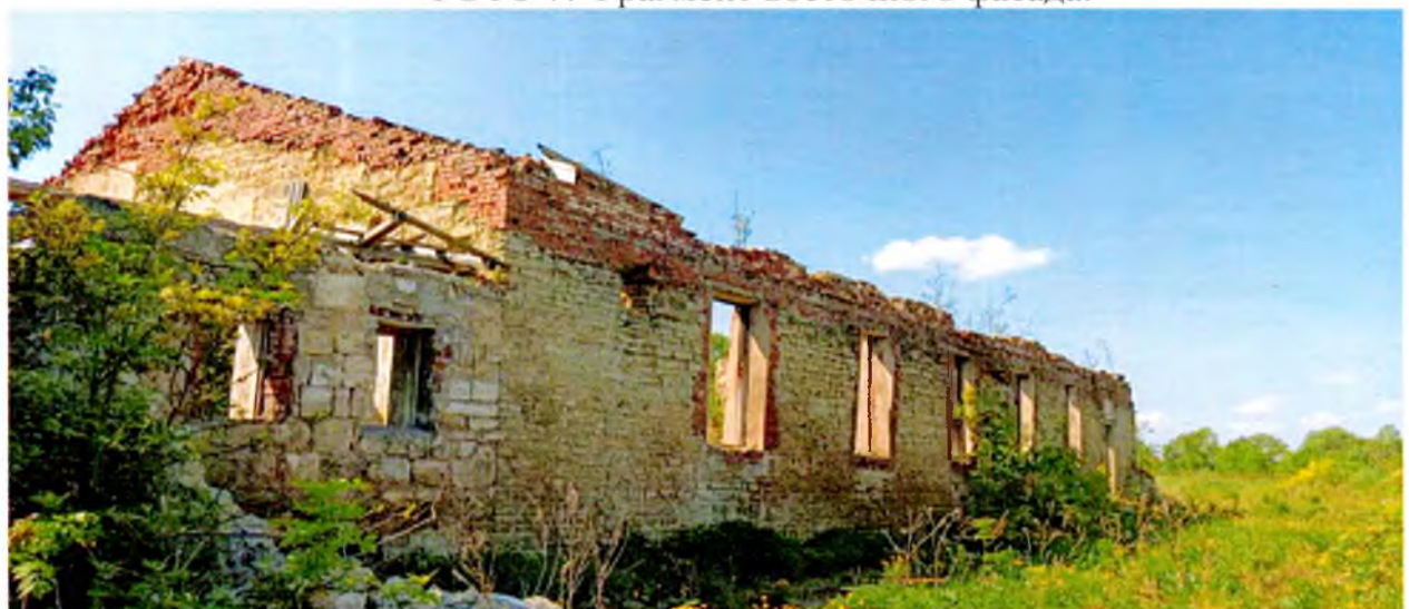
ФОТО 8. Вид на северный фасад коровника. Историческая конструкция наружных стен – каменная кладка.