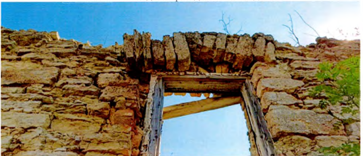
ФОТО 5. Каменная перемычка оконного проема западного фасада.