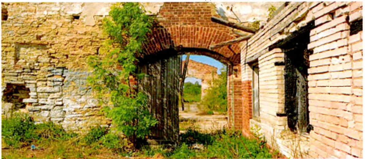
ФОТО 10. Входной проем восточного фасада с арочной кирпичной перемычкой.