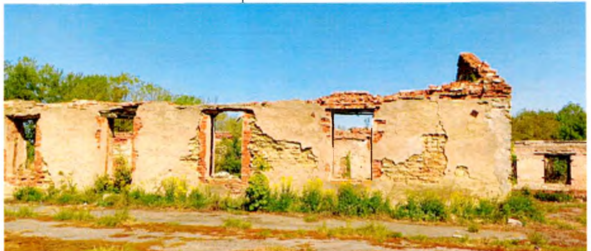
ФОТО 11. Фрагмент южного фасада коровника. Историческая конструкция наружных стен – каменная кладка.