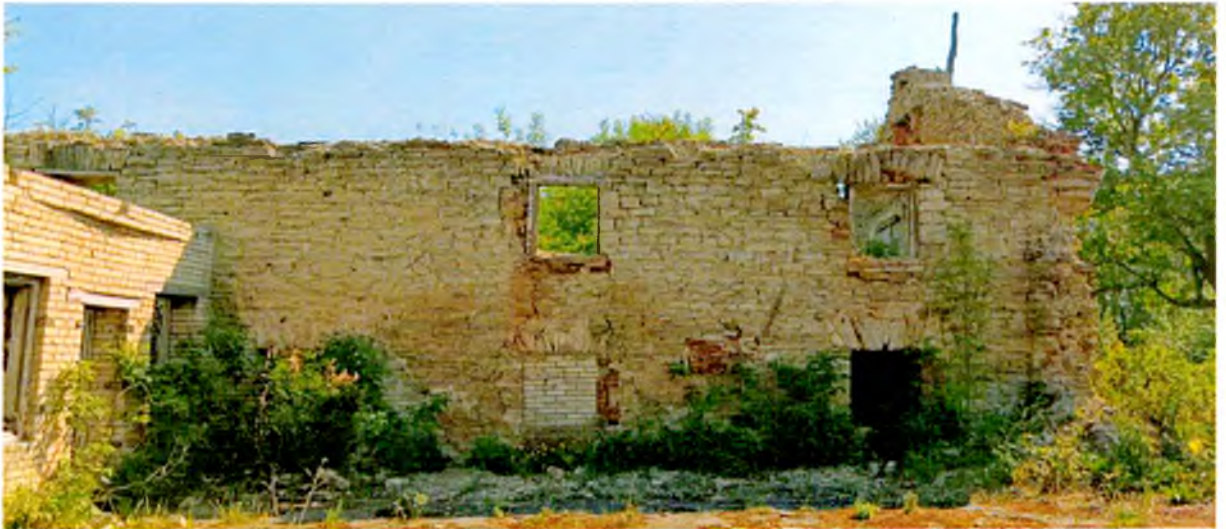
ФОТО 4. Западный фасад молочного дома.