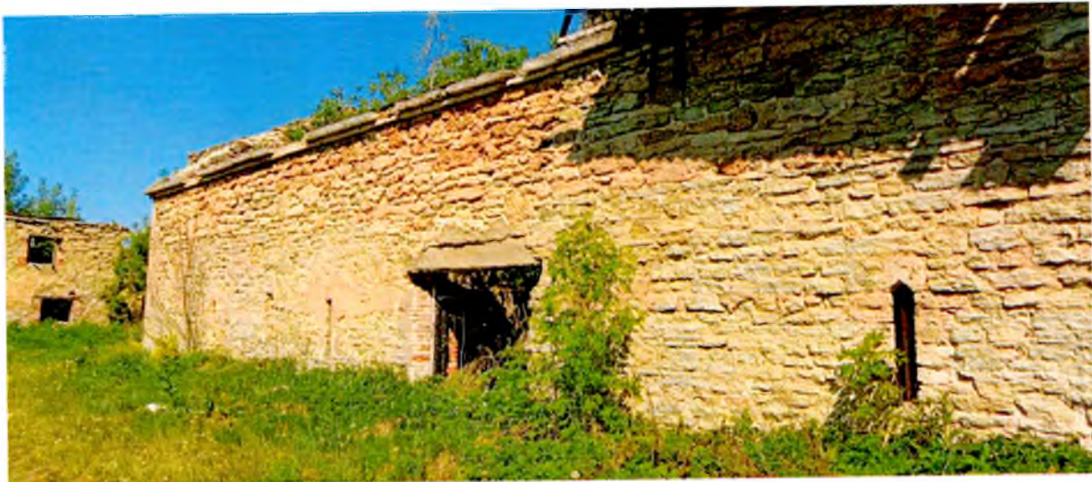
ФОТО 3. Фрагмент южного фасада.