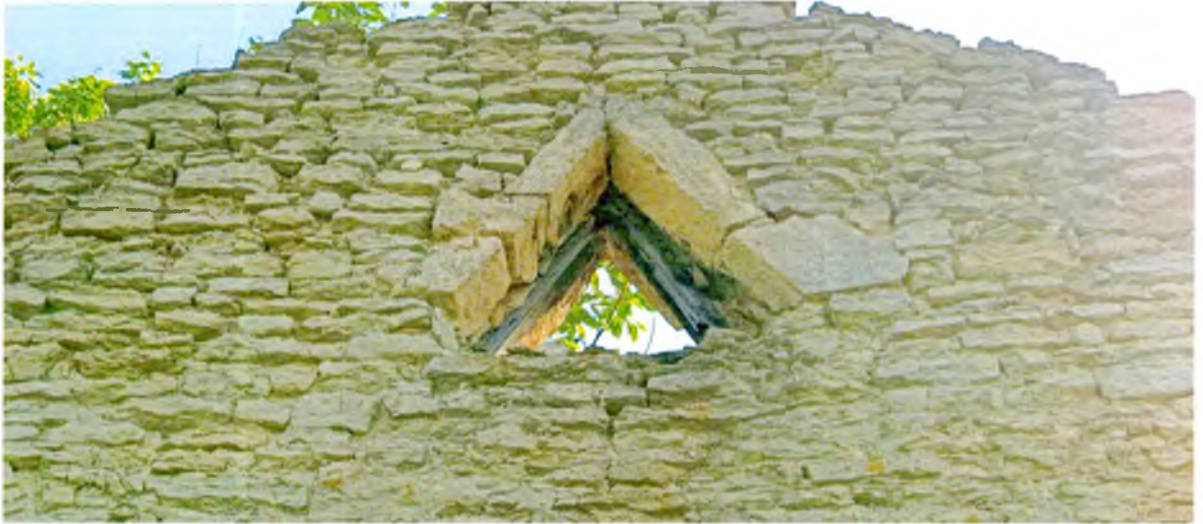
ФОТО 6. Треугольное окно с каменной перемычкой фронтона западного фасада.