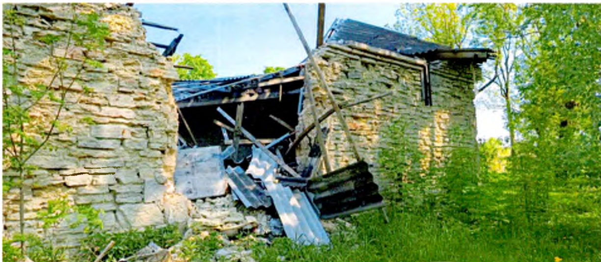
ФОТО 1. Вид на южный фасад.

Приложение № 3 к охранному обязательству собственника или иного законного владельца объекта культурного наследия регионального значения «Скотный двор», в составе объекта культурного наследия регионального значения «Мыза «Лапинская»», включенного в единый государственный реестр объектов культурного наследия (памятников истории и культуры) народов Российской Федерации