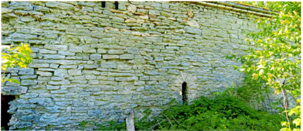
ФОТО 7. Фрагмент северного фасада. Наружные стены выполнены из плитного известняка с обработанной поверхностью на известковом связующем растворе.