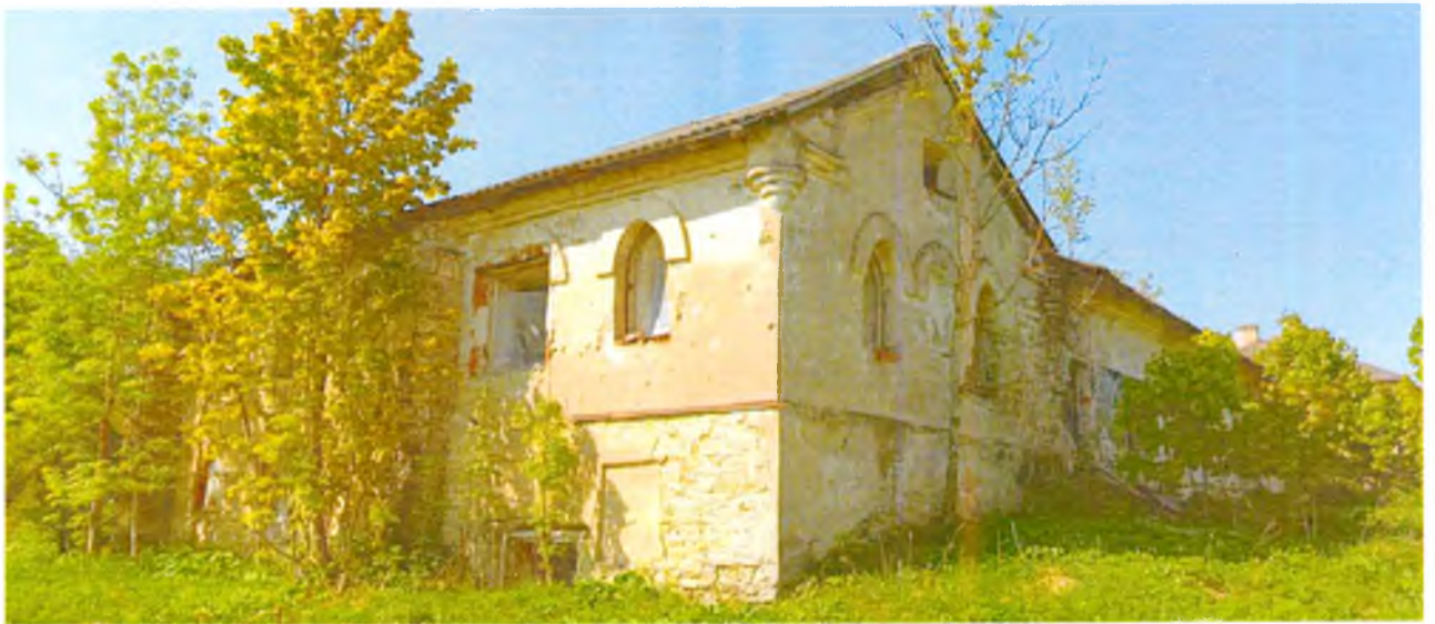
ФОТО 9. Общій вид с северо-востока.