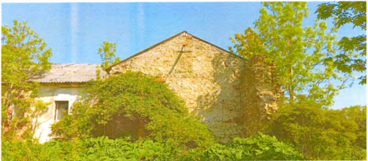
ФОТО 6. Общий вид южного фасада.