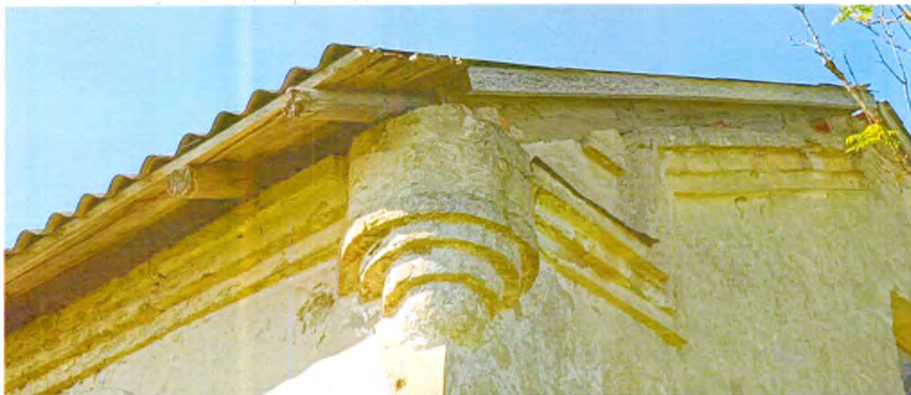
ФОТО 2. Угловой декоративный элемент в виде стилизованной башенки-пинакля. Венчающий каменный профилированный карниз с оштукатуренной поверхностью.