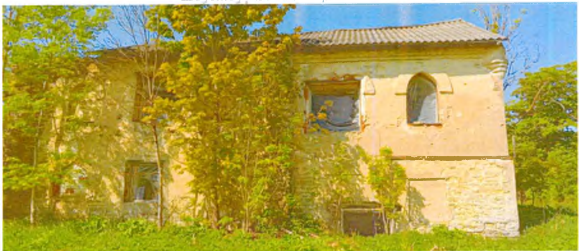
ФОТО 5. Общий вид восточного фасада. Плоскость фасада гладкая, оштукатуренная.