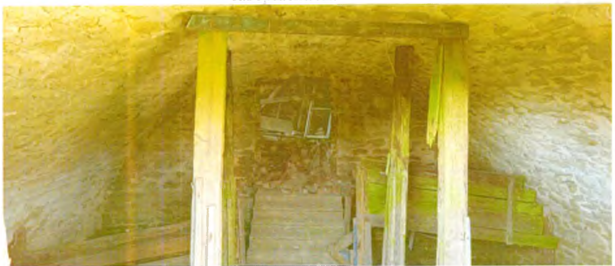
ФОТО 8. Каменные своды над подвалом.