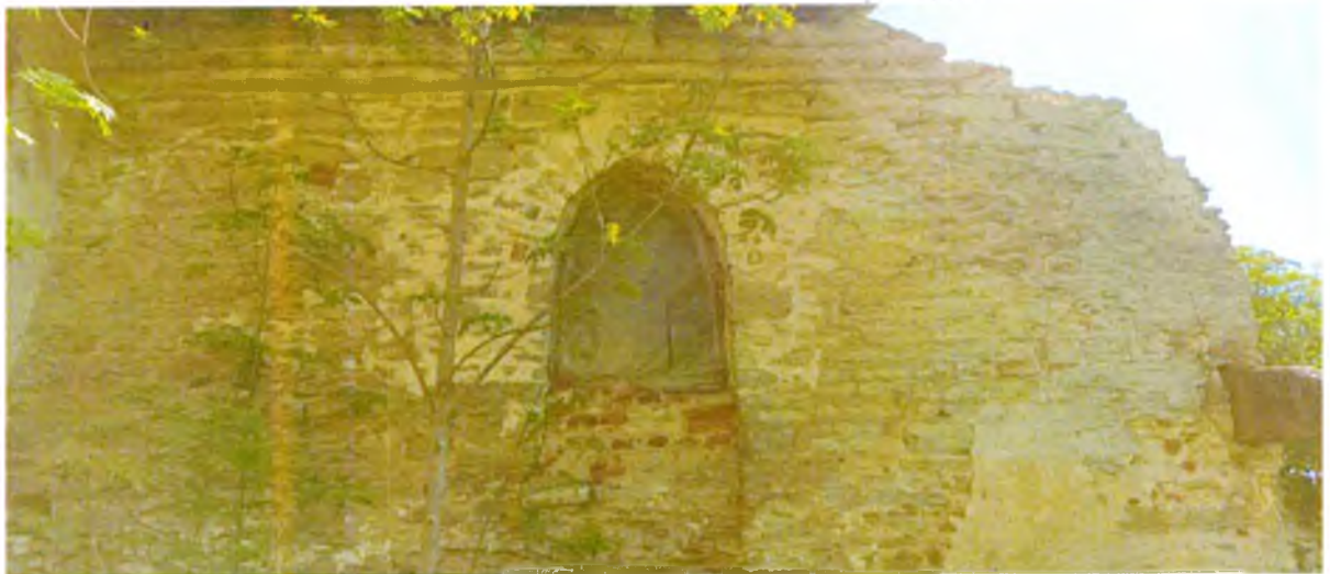
ФОТО 7. Фрагмент западного фасада. Оконный проем 2 этажа со стрельчатым завершением.