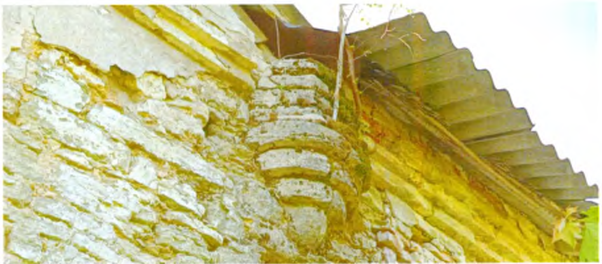
ФОТО 3. Декоративный элемент в виде стилизованной башенки-пинакля. Венчающий каменный профилированный карниз с оштукатуренной поверхностью.