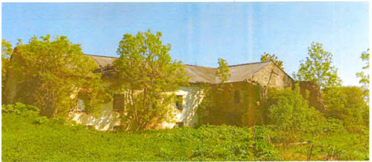
ФОТО 10. Вид с северо-востока.