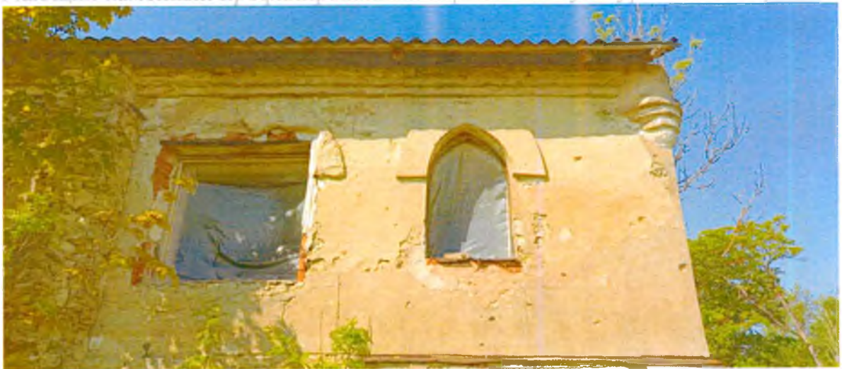
ФОТО 4. Фрагмент восточного фасада. Оконные проемы 2 этажа со стрельчатым завершением, декорированный каменным архивольтом со штукатурной поверхностью.