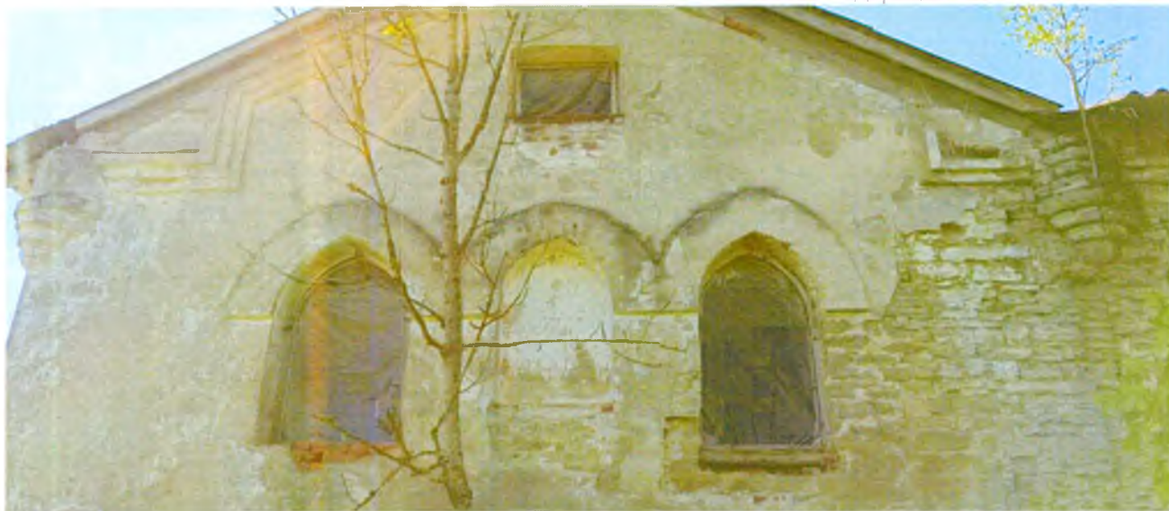
ФОТО 1. Фрагмент северного фасада. Группа из трех окон со стрельчатым арочным завершением, декорированные каменным архивольтами с оштукатуриванием. Фасад увенчан профилированным ступенчатым карнизом, по углам – декор в виде стилизованных башенок-пинаклей.

Приложение № 3 к охранному обязательству собственника или иного законного владельца объекта культурного наследия регионального значения «Хозяйственная постройка дворового каре», в составе объекта культурного наследия регионального значения «Мыза «Липинская»», включенного в единый государственный реестр объектов культурного наследия (памятников истории и культуры) народов Российской Федерации