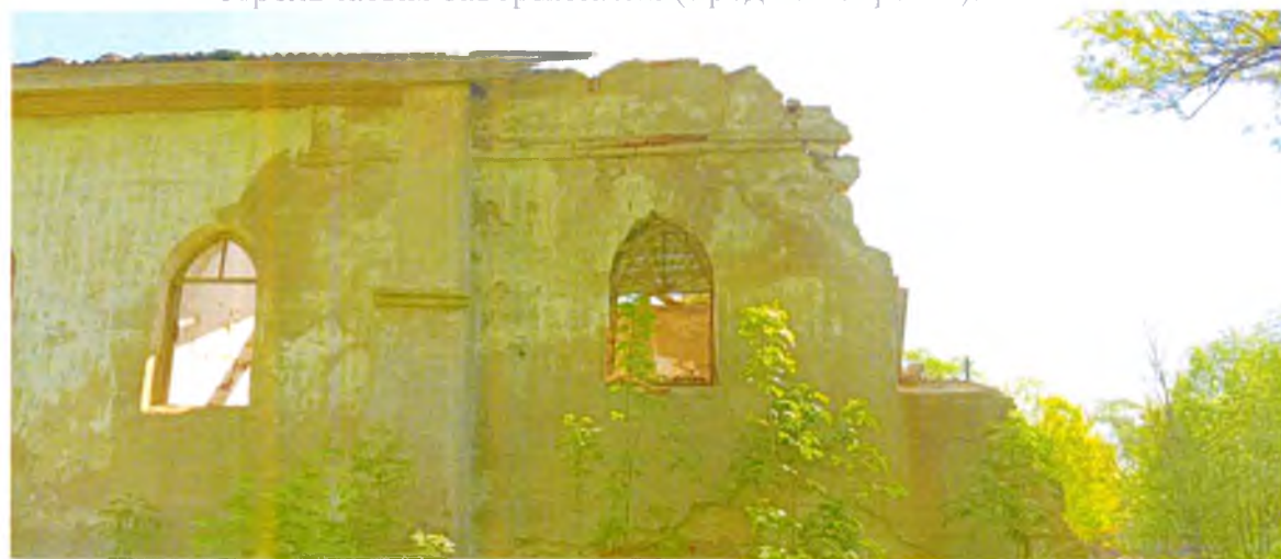
ФОТО 2. Фрагмент западного фасада. Оконные проемы 2 этажа со стрельчатым завершением (предмет охраны). Южная стена, являющаяся предметом охраны, обрушена.