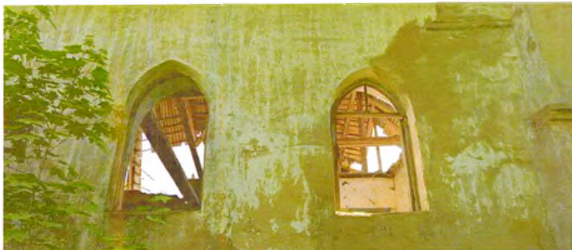
ФОТО 1. Фрагмент западного фасада. Оконные проемы 2 этажа со стрельчатым завершением (предмет охраны).

Приложение № 3 к охранному обязательству собственника или иного законного владельца объекта культурного наследия регионального значения «Флигель», в составе объекта культурного наследия регионального значения «Мыза «Лапинская»», включенного в единый государственный реестр объектов культурного наследия (памятников истории и культуры) народов Российской Федерации