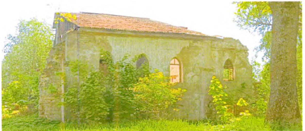
ФОТО 8. Общий вид с западной стороны.