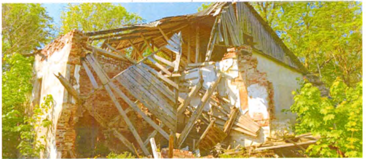
ФОТО 7. Вид на здание с северо-востока. Кровля, перекрытия, являющиеся предметом охраны обрушены.