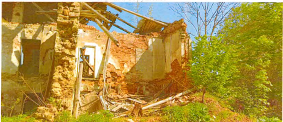
ФОТО 5. Кровля, перекрытия, южная стена, являющиеся предметом охраны, обрушены.