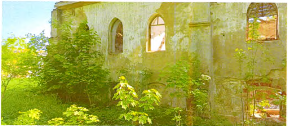
ФОТО 3. Фрагмент западного фасада. Оконные проемы 2 этажа со стрельчатым завершением (предмет охраны). Плоскость фасада разделена вертикалями уширяющихся книзу контрфорсами.