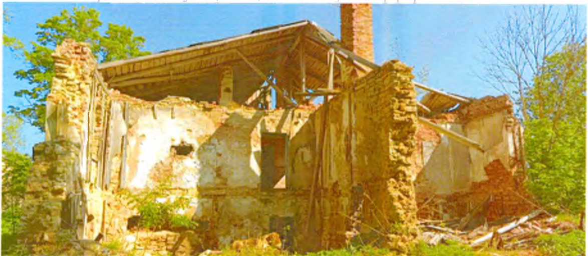
ФОТО 4. Вид с южной стороны. Южная стена, являющаяся предметом охраны, обрушена.