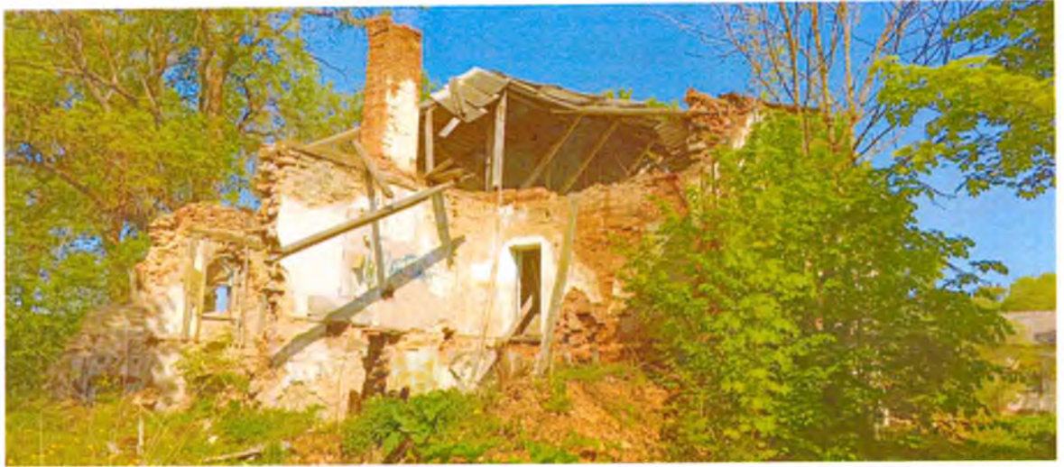
ФОТО 6. Вид на здание с юго-востока. Кровля, перекрытия, южная стена, являющиеся предметом охраны, обрушены.