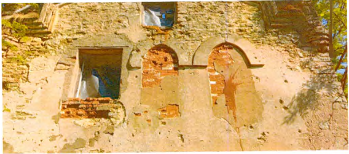
ФОТО 3. Фрагмент южного фасада. Оконные проемы имеют стрельчатое арочное завершение, декорированы штукатурными архивольтами (предмет охраны).