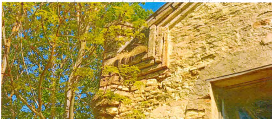
ФОТО 7. Декоративная башенка-пинакль южного фасада, венчающая юго-западный угол здания (предмет охраны).