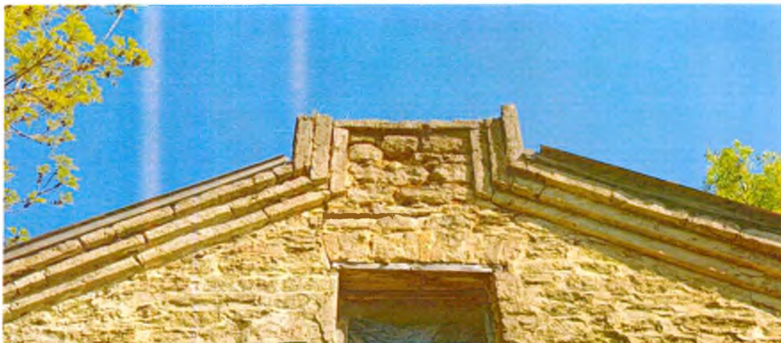
ФОТО 6. Завершение щипца южного фасада. Наблюдается утрата каменного профилированного карниза (предмет охраны).