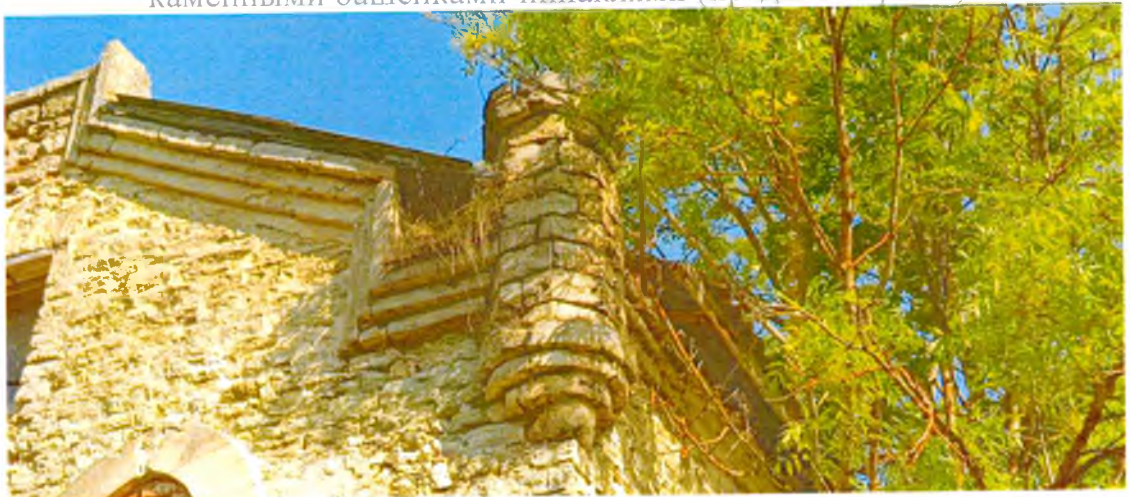
ФОТО 5. Декоративная башенка-пинакль южного фасада, венчающая юго-восточный угол здания (предмет охраны).