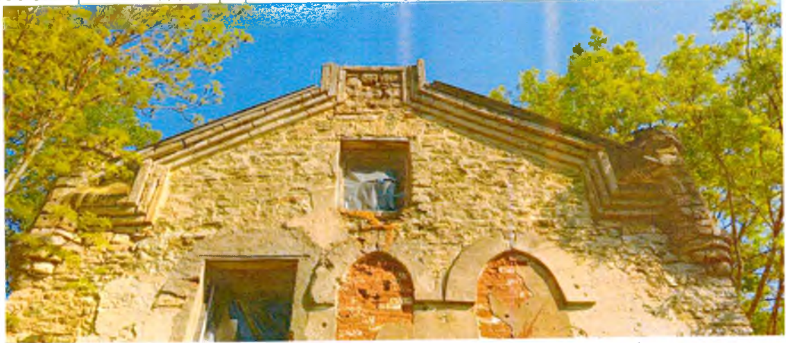
ФОТО 4. Вид на щипец южного фасада. Увенчан профилированным ступенчатым каменным карнизом. По бокам щипец фланкирован декоративным каменными башенками-пинаклями (предмет охраны).