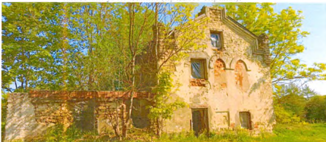
ФОТО 8. Общий вид южного фасада. Оконные проемы 1 этажа – прямоугольные, 2 – арочные стрельчатые декорированные штукатурными архивольтами. Угла здания увечены стилизованными каменными башенками-пинаклями. Щипец фронтона декорирован профилированным каменным карнизом.