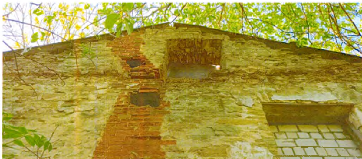
ФОТО 1. Вид на фронтон северного фасада.

Приложение № 3 к охранному обязательству собственника или иного законного владельца объекта культурного наследия регионального значения «Господский дом с оградой», в составе объекта культурного наследия регионального значения «Мыза «Лапинская»», включенного в единый государственный реестр объектов культурного наследия (памятников истории и культуры) народов Российской Федерации