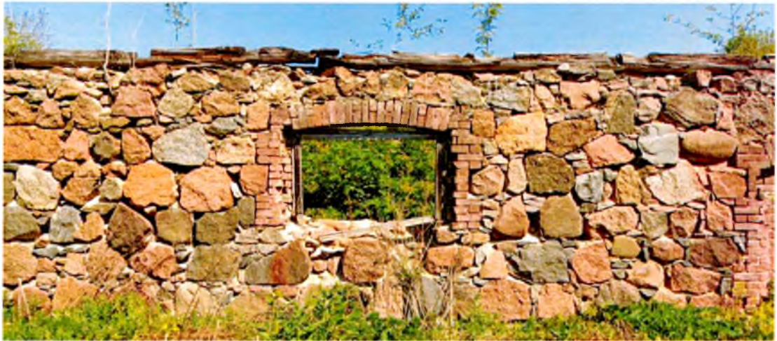
ФОТО 3. Фрагмент южного фасада. Южная стена выполнена из крупных необработанных гранитных валунов на известковом связующем растворе. Оконные проемы с арочным завершением обрамлены кирпичной кладкой.