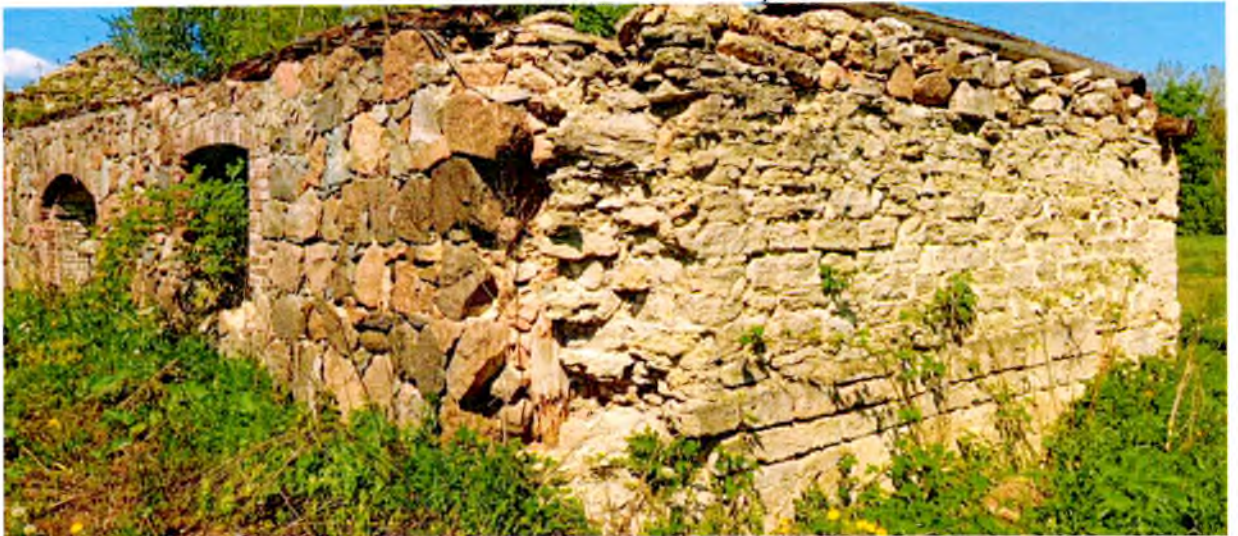
ФОТО 7. Юго-восточный угол здания.