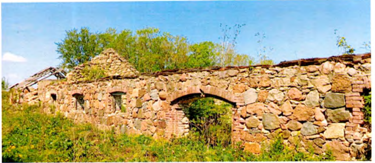
ФОТО 6. Вид на южный фасад.