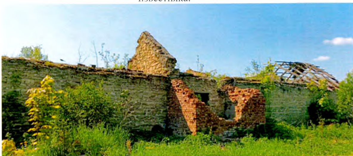
ФОТО 10. Фрагмент северного фасада.