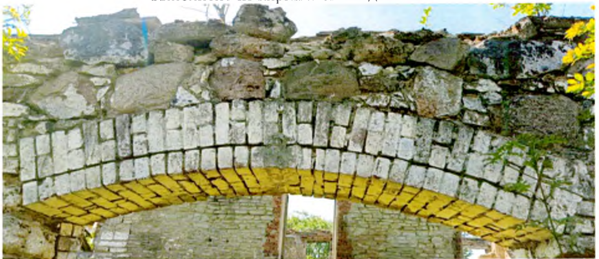
ФОТО 5. Арочная кирпичная перемычка въездных ворот южного фасада. Вид со стороны помещения.