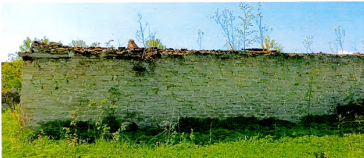
ФОТО 9. Фрагмент северного фасада. Стена выполнена из плитного известняка.