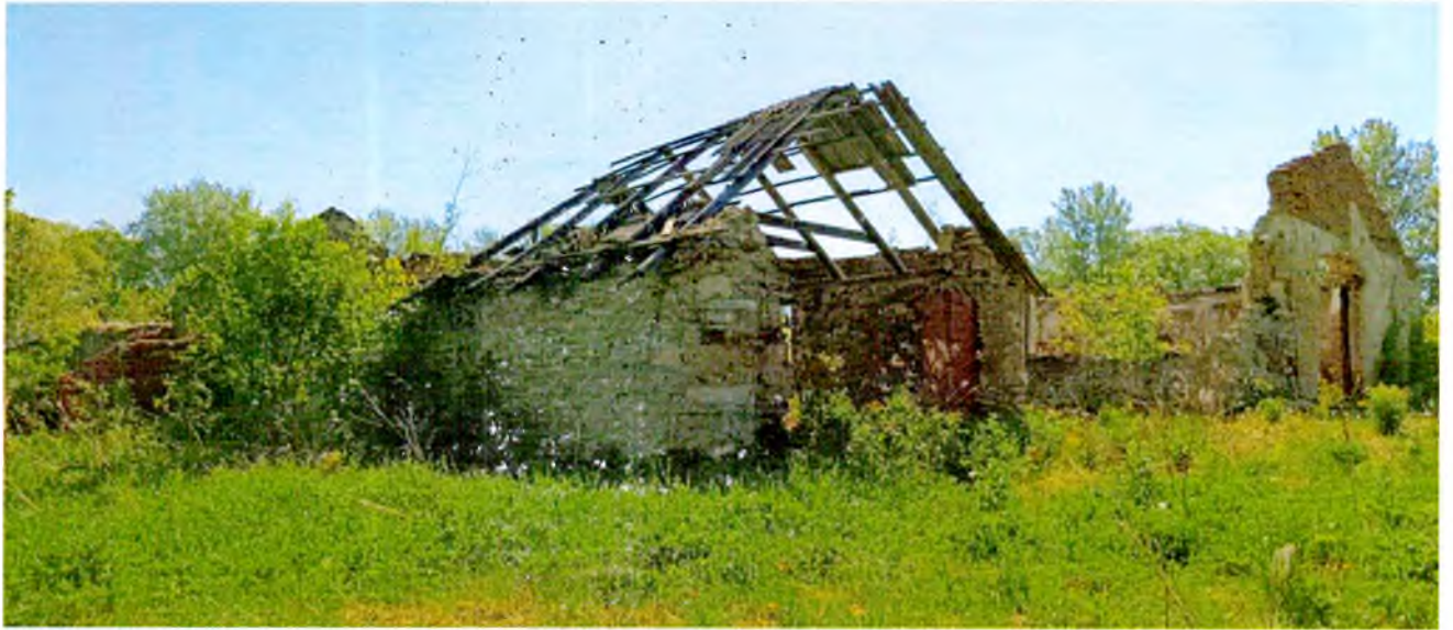
ФОТО 12. Вид на западный фасад и прилегающую территорию.