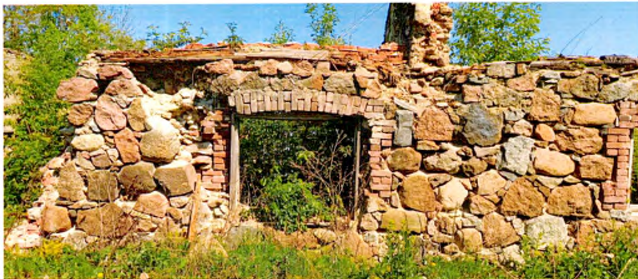
ФОТО 1. Фрагмент южного фасада. Южная стена выполнена из крупных необработанных гранитных валунов на известковом связующем растворе. Оконные проемы с арочным завершением обрамлены кирпичной кладкой.

Приложение № 3 к охранному обязательству собственника или иного законного владельца объекта культурного наследия регионального значения «Сенной сарай», в составе объекта культурного наследия регионального значения «Мыза «Лапинская»», включенного в единый государственный реестр объектов культурного наследия (памятников истории и культуры) народов Российской Федерации