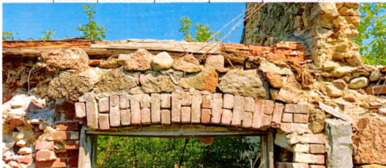
ФОТО 2. Кирпичная перемычка оконного проема южного фасада.