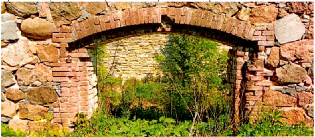
ФОТО 4. Арочный проем въездных ворот южного фасада. Обрамление выполнено из кирпичной кладки.