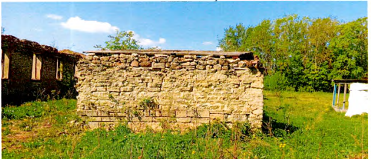
ФОТО 8. Восточный фасад.