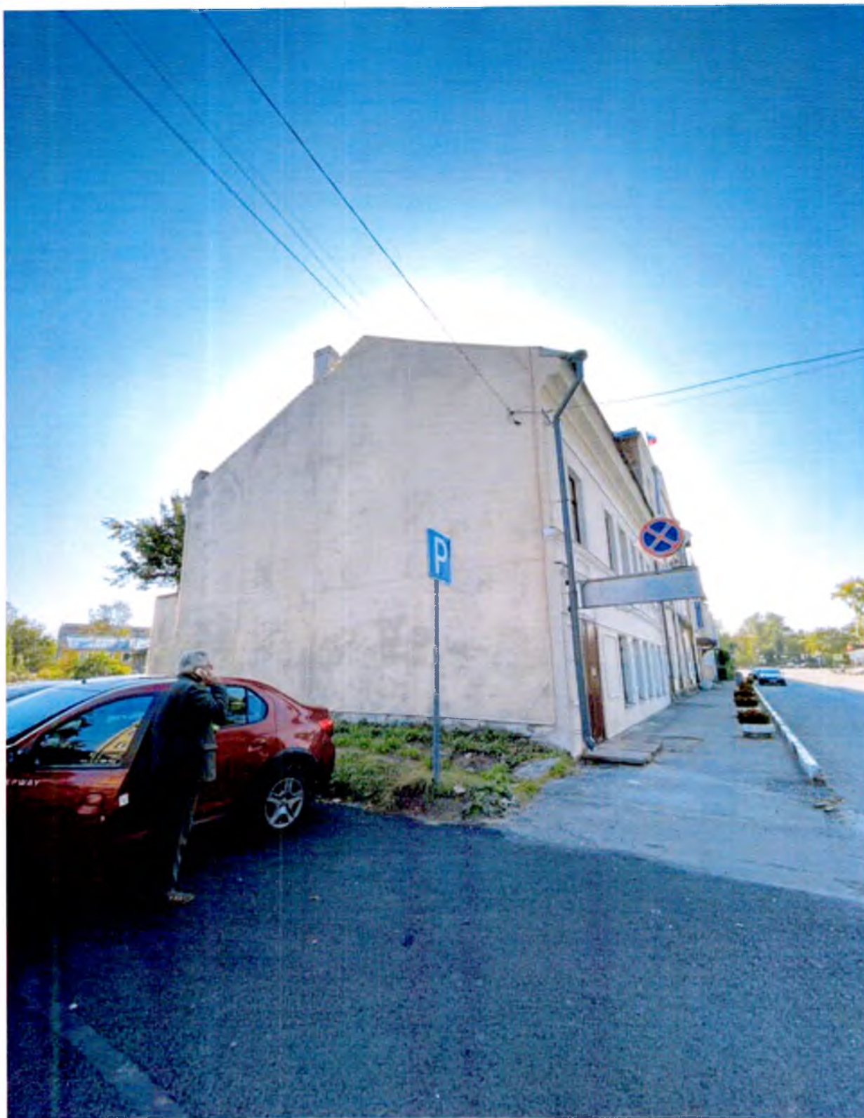
ФОТО 3. Северный фасад.