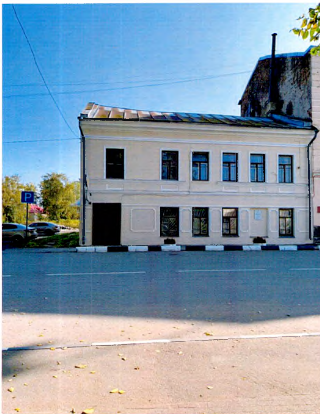
ФОТО 1. Западный фасад.

Приложение № 3 к охранному обязательству собственника или иного законного владельца объекта культурного наследия регионального значения «Дом жилой с часовой мастерской», включенного в единый государственный реестр объектов культурного наследия (памятников истории и культуры) народов Российской Федерации