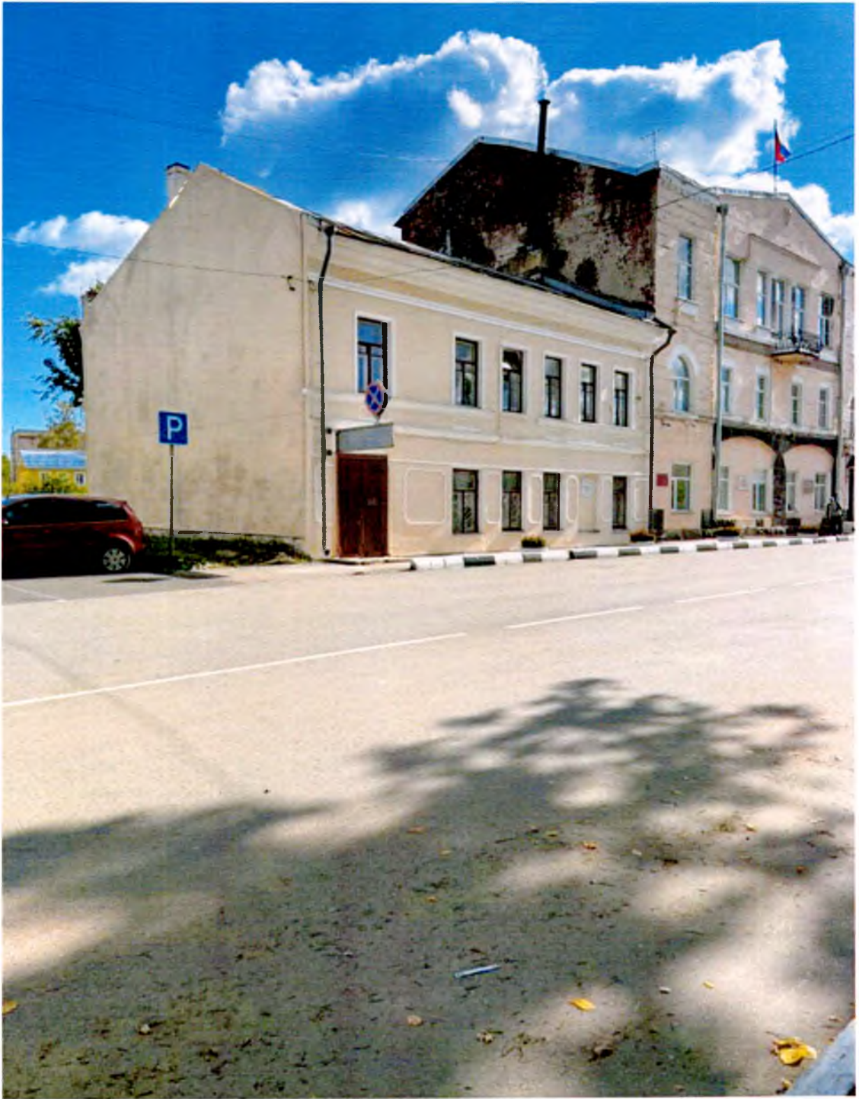
ФОТО 2. Вид с северо-запада.