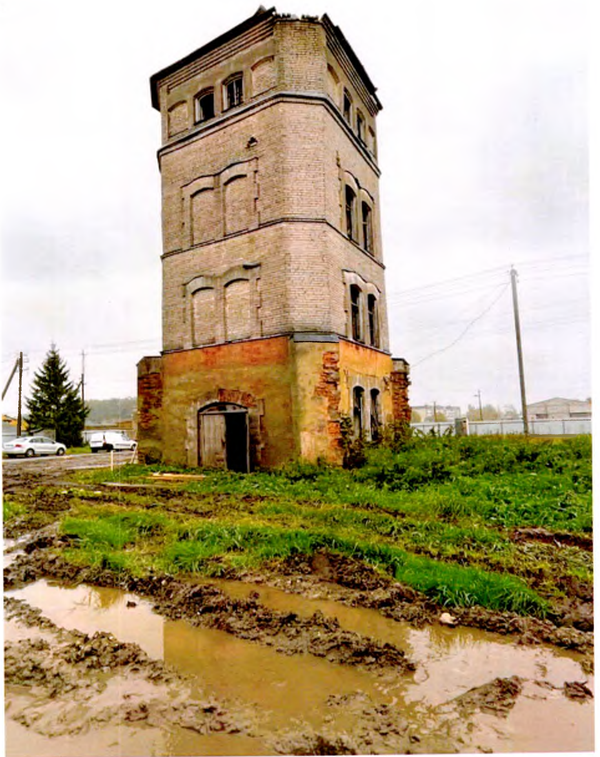
ФОТО 2. Общий вид с прилегающей территории.