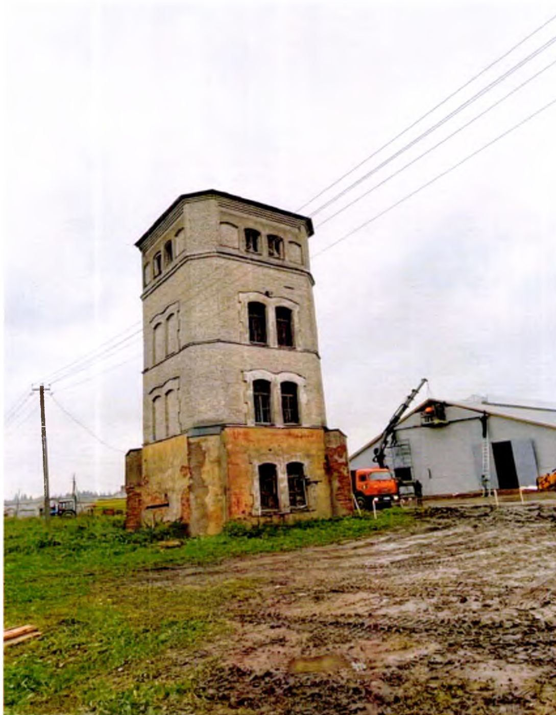
ФОТО 1. Общий вид с прилегающей территории.

Приложение № 3 к охранному обязательству собственника или иного законного владельца объекта культурного наследия регионального значения «Водонапорная башня», в составе объекта культурного наследия регионального значения «Усадьба баронов Врангелей», включенного в единый государственный реестр объектов культурного наследия (памятников истории и культуры) народов Российской Федерации