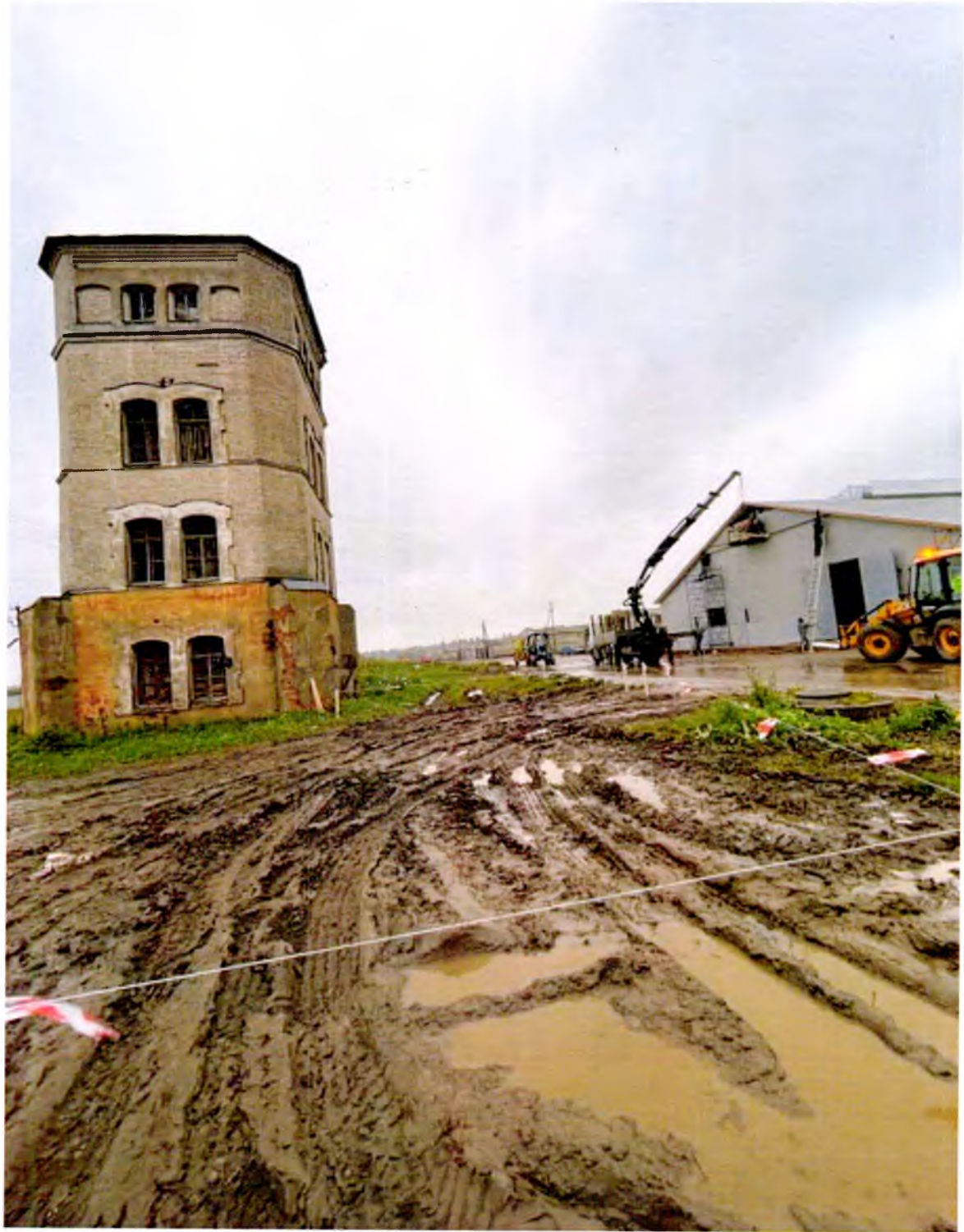
ФОТО 3. Общий вид с прилегающей территории.