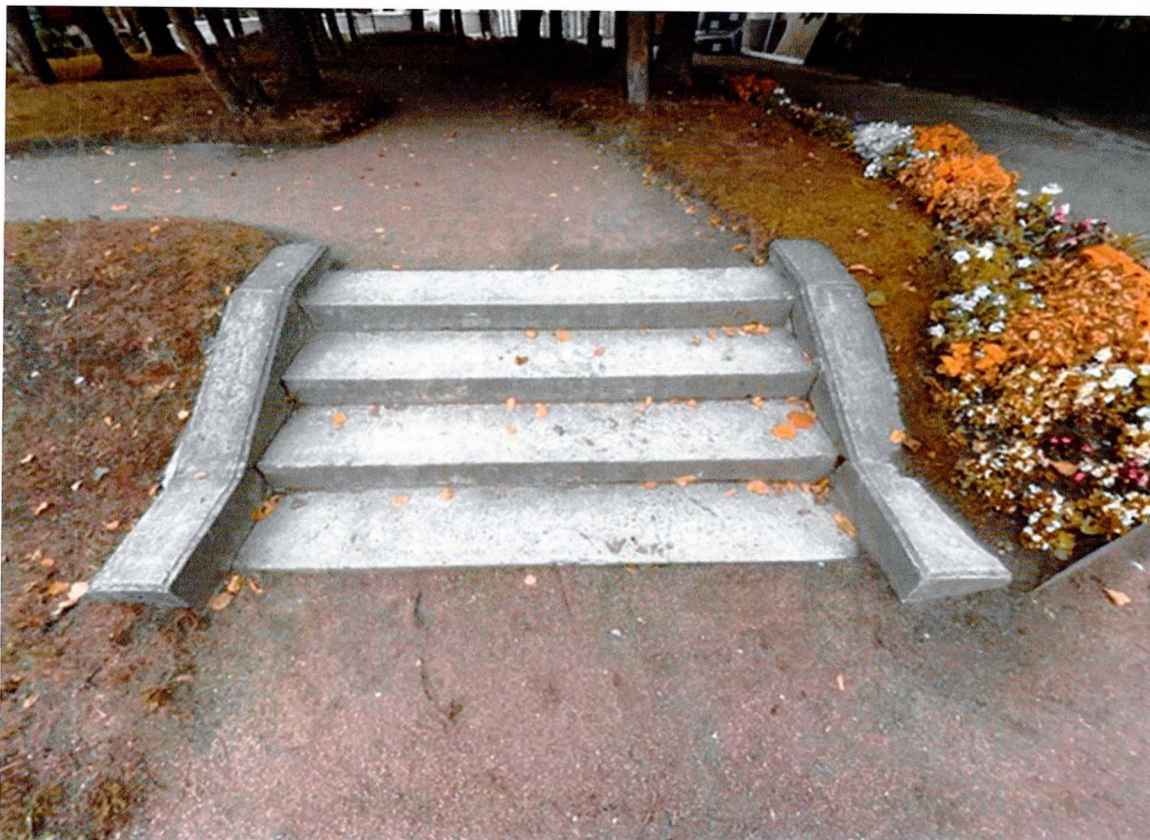
Фото 11. Нижний голландский сад. Лестница №11. Общий вид.