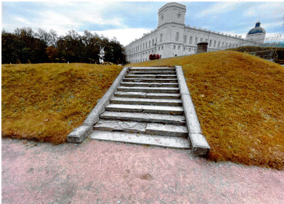
Фото 3. Нижний голландский сад. Лестница № 3. Общий вид.