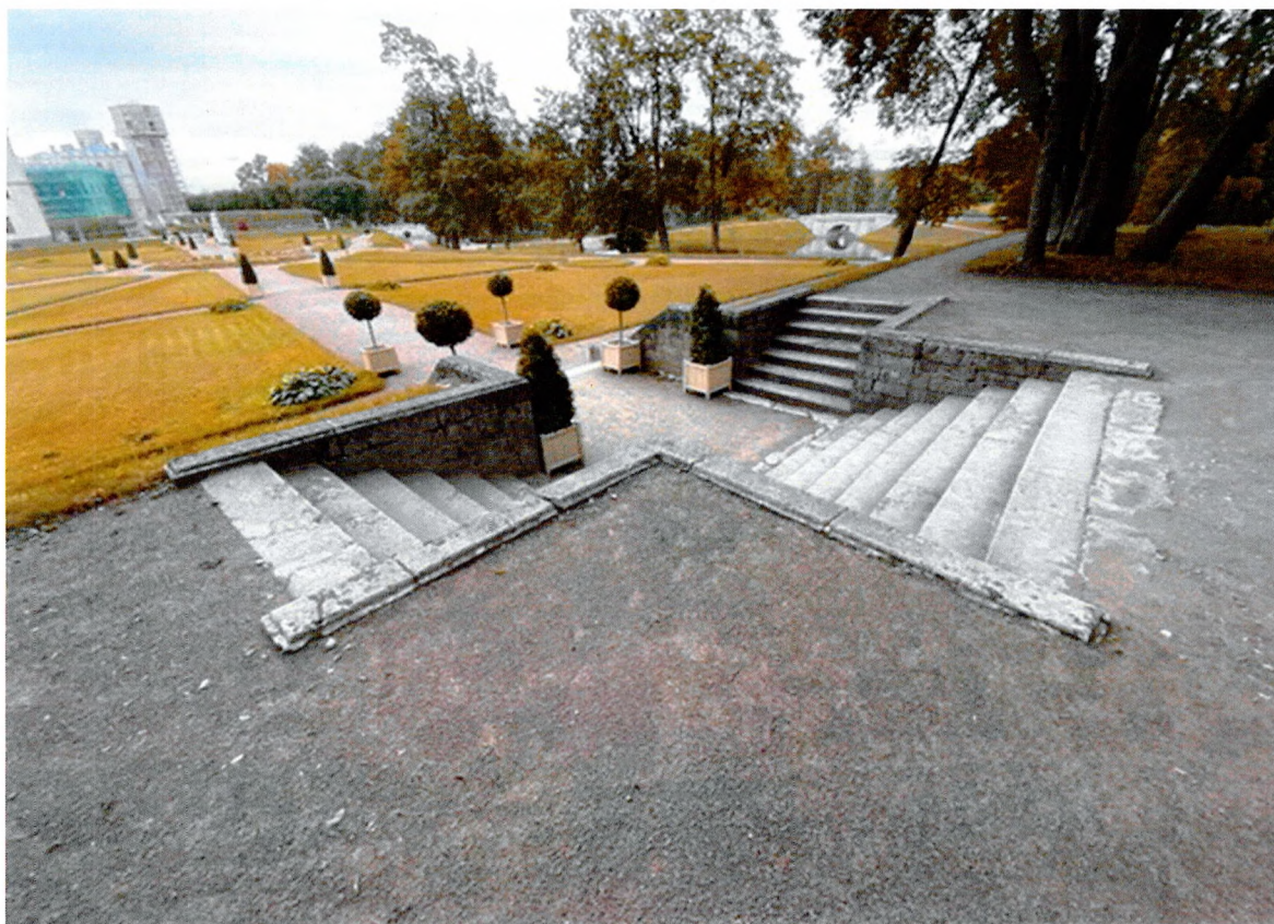
Фото 9. Нижний голландский сад. Лестница № 9.