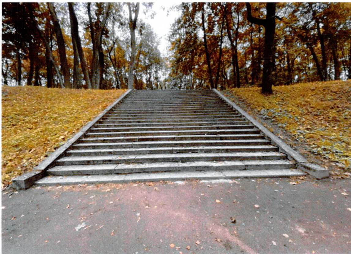
Фото 7. Верхний голландский сад. Лестница № 7. Общий вид.