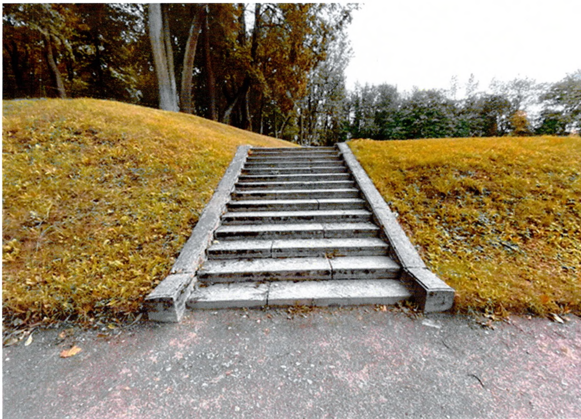
Фото 5. Верхний голландский сад. Лестница № 5. Общий вид.