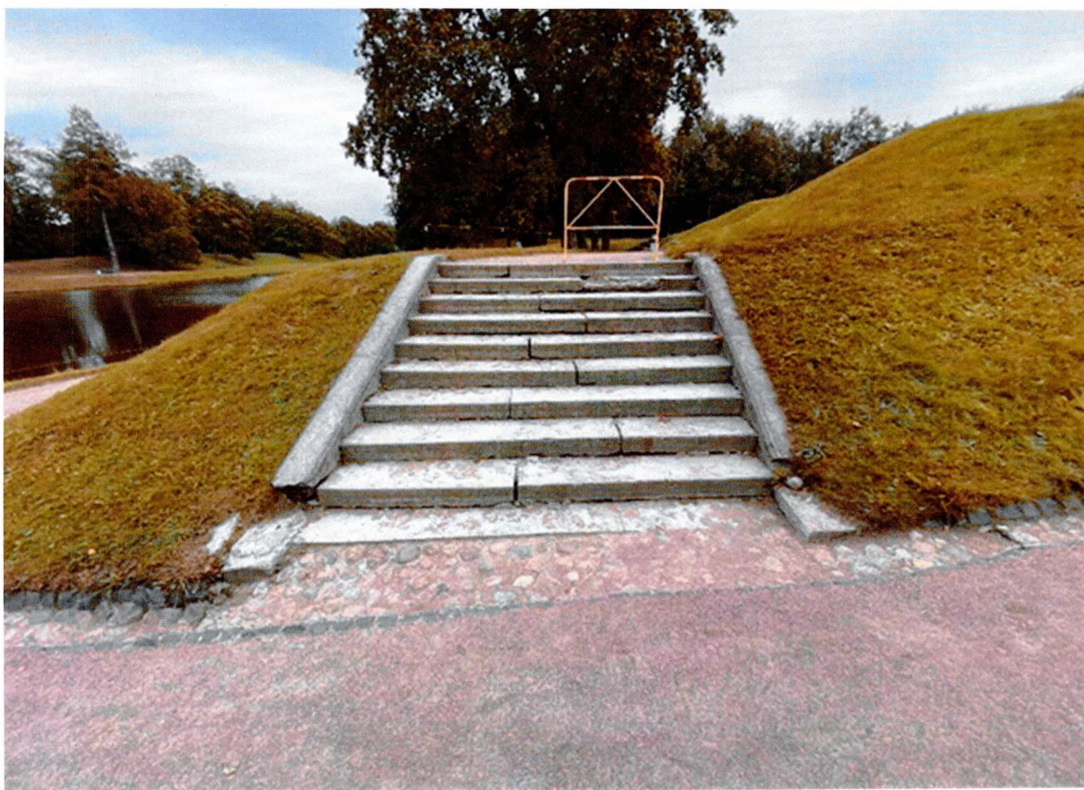
Фото 1. Нижний голландский сад. Лестница №1. Общий вид.

Фотографическое изображение объекта культурного наследия федерального значения «Лестницы и террасы в Голландском и Верхнем садах», 1796 г., входящего в состав объекта культурного наследия федерального значения «Ансамбль Гатчинского дворца и парка», расположенного по адресу: Ленинградская область, Гатчинский муниципальный район, г. Гатчина, Дворцовый парк (фотофиксация выполнена 27.10.2023)