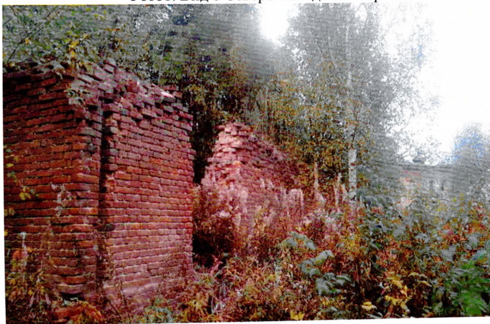
Фото 2. Вид с южной стороны.