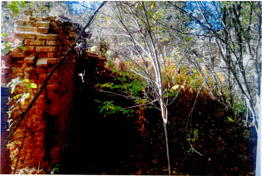
Фото 4. Вид с Северной стороны.