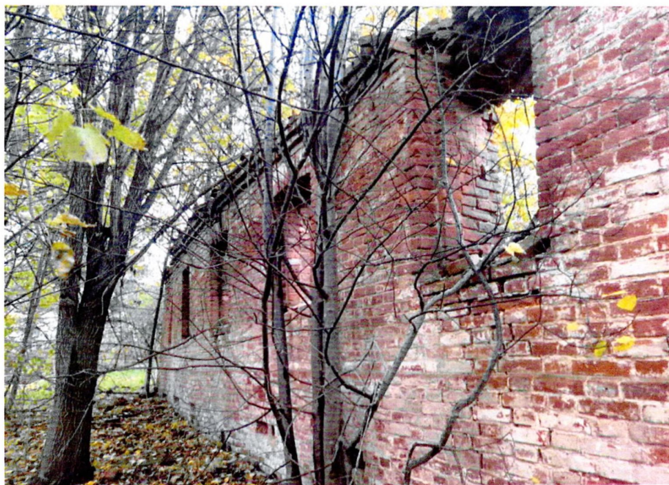
Фото1. Вид с Северо-Западной стороны.

Приложение № 3 к охранному обязательству собственника или иного законного владельца объекта культурного наследия регионального значения «Здание церковно-приходского училища, XIX век», входящего в состав объекта культурного наследия регионального значения «Ансамбль Антониево-Дымского монастыря, середина XVII-начало XX века», включенного в единый государственный реестр объектов культурного наследия (памятников истории и культуры) народов Российской Федерации