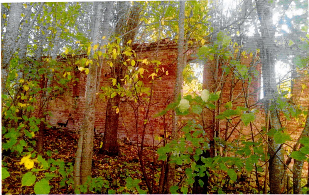
Фото 3. Вид с Западной стороны.