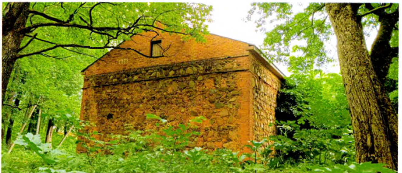
ФОТО 8. Западный фасад. Стены сложены из небольших гранитных валунов на известковом связующем растворе, фронтон выполнен из кирпича.