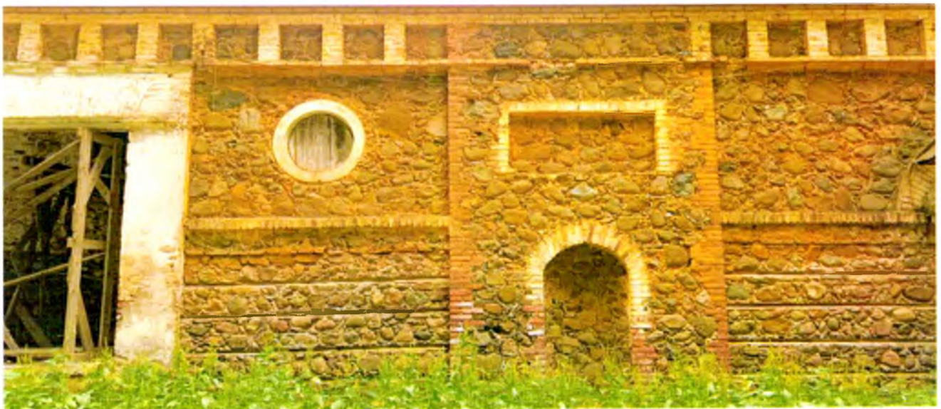
ФОТО 6. Ризалит южного фасада с экседрой и прямоугольной нишей над ней.