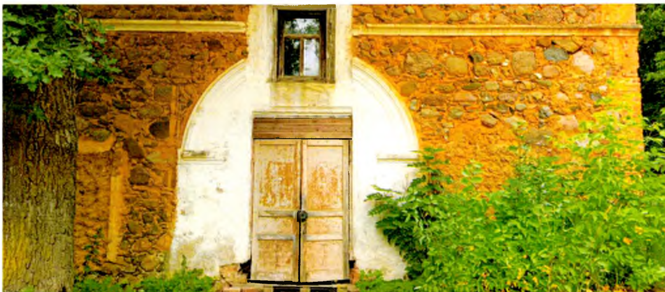
ФОТО 1. Фрагмент восточного фасада. Стены сложены из небольших гранитных валунов на известковом связующем растворе. Арочные ворота заложены и устроен дверной прямоугольный проем. Декор в виде штукатурного профилированного архивольта, поверхность гладкая оштукатуренная.