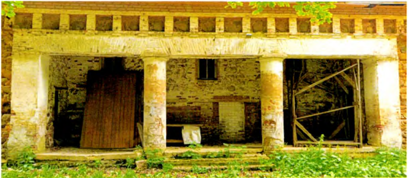
ФОТО 5. Заглубленный портал южного фасада.