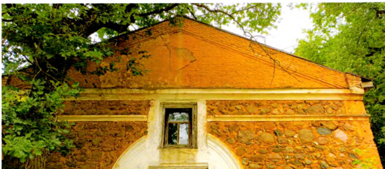
ФОТО 2. Вид на фронто́н восточного фасада. Фасад венчает профилированный штукатурный карниз. Стены сложены из небольших гранитных валунов на известковом связующем растворе, фронто́н выполнен из кирпича.