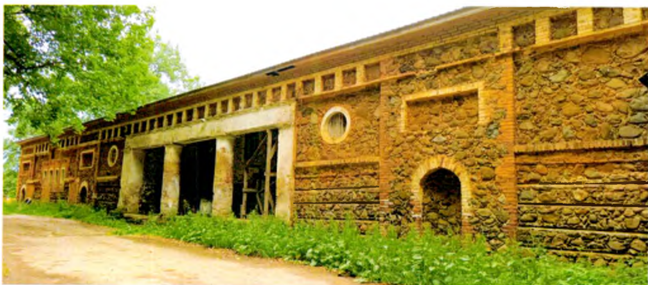
ФОТО 4. Вид на южный фасад. Центром композиции фасада является заглубленный портал, слева и справа от которого располагаются небольшие ризалиты с экседрой и прямоугольной нишей над ней, круглые оконные проемы декорированы штукатурным обрамлением с гладкой окрашенной поверхностью.