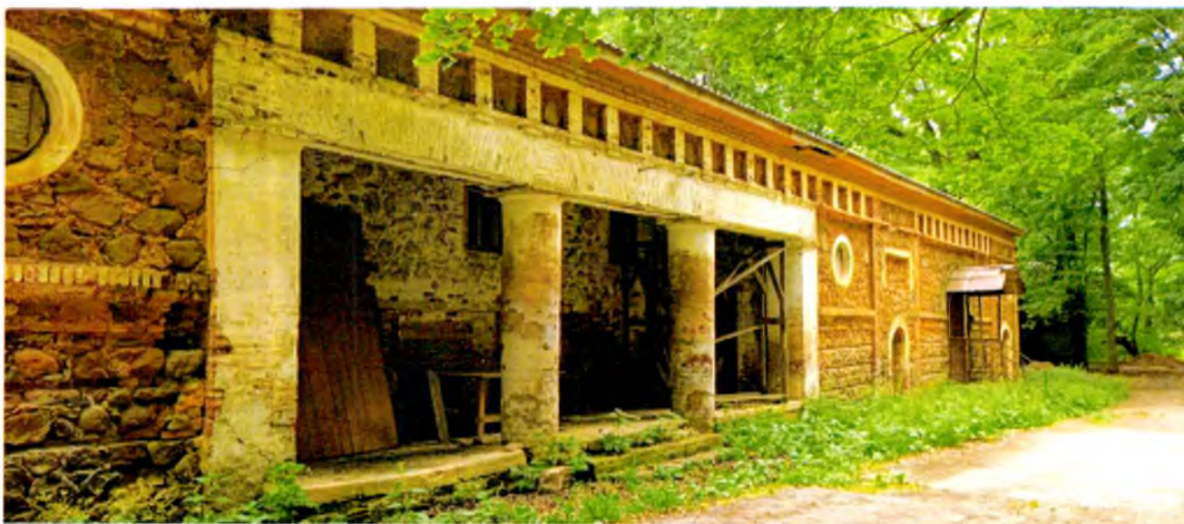
ФОТО 3. Фрагмент южного фасада. Портал заглублен. Нависающая часть оперта на кирпичные колонны круглого сечения. Фасад увенчан стилизованным кирпичным фризом с метопами.