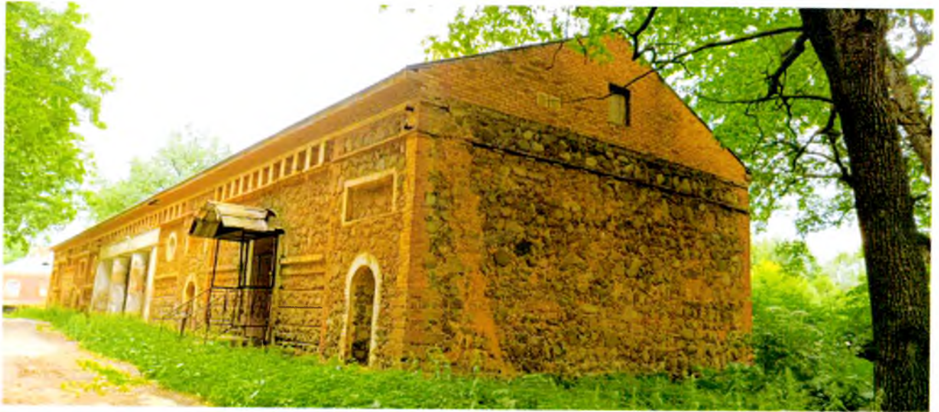
ФОТО 9. Общий вид с юго-запада.