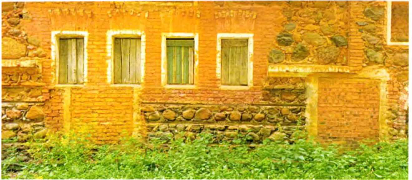
ФОТО 7. Фрагмент южного фасад. Оконные проемы прямоугольной формы с клинчатой кирпичной перемычкой.