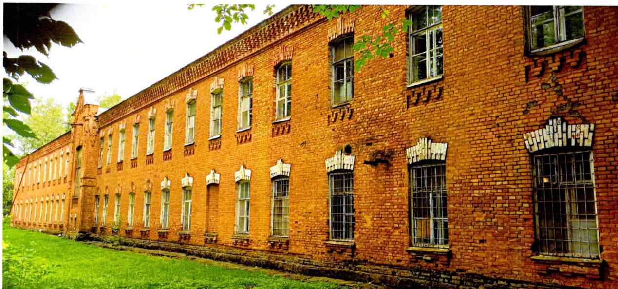
Фото 1. Вид на западный фасад в 27 световых осях. По центральной световой оси расположен ризалит, увенчанный щипцовым фронтоном.