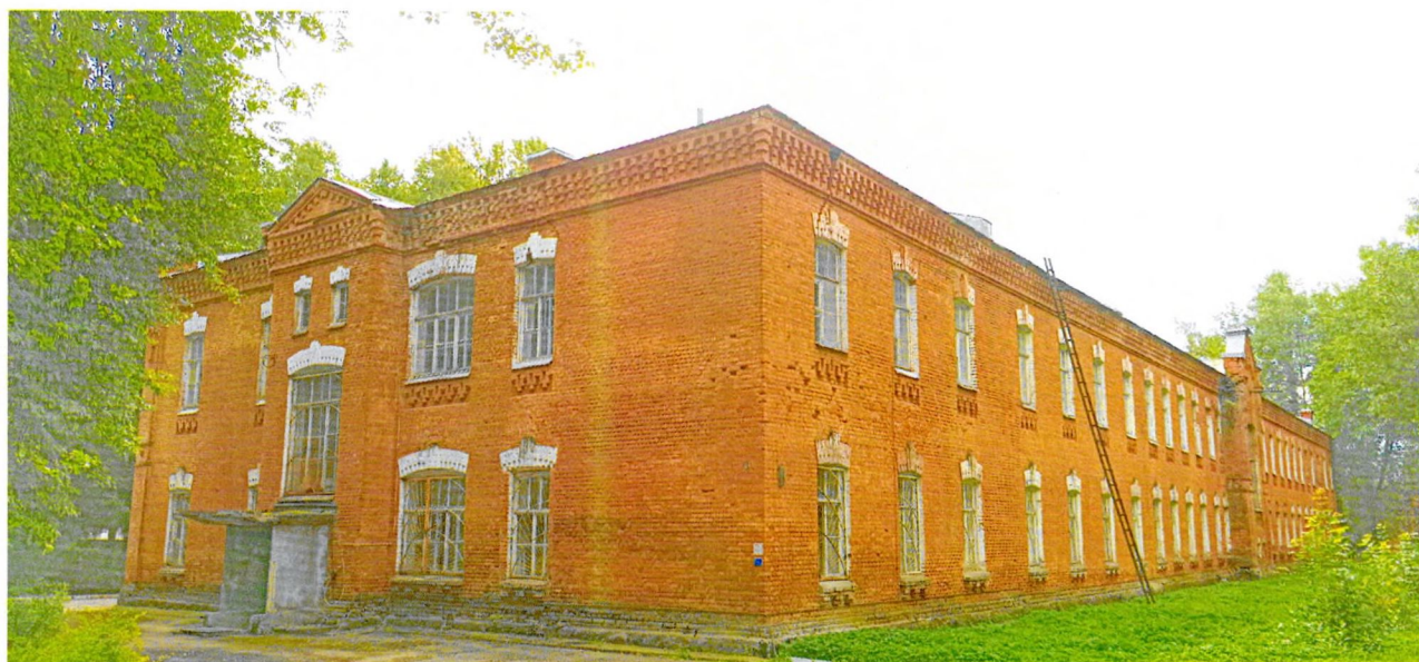
Фото 4. Общий вид здания с северо-запада.