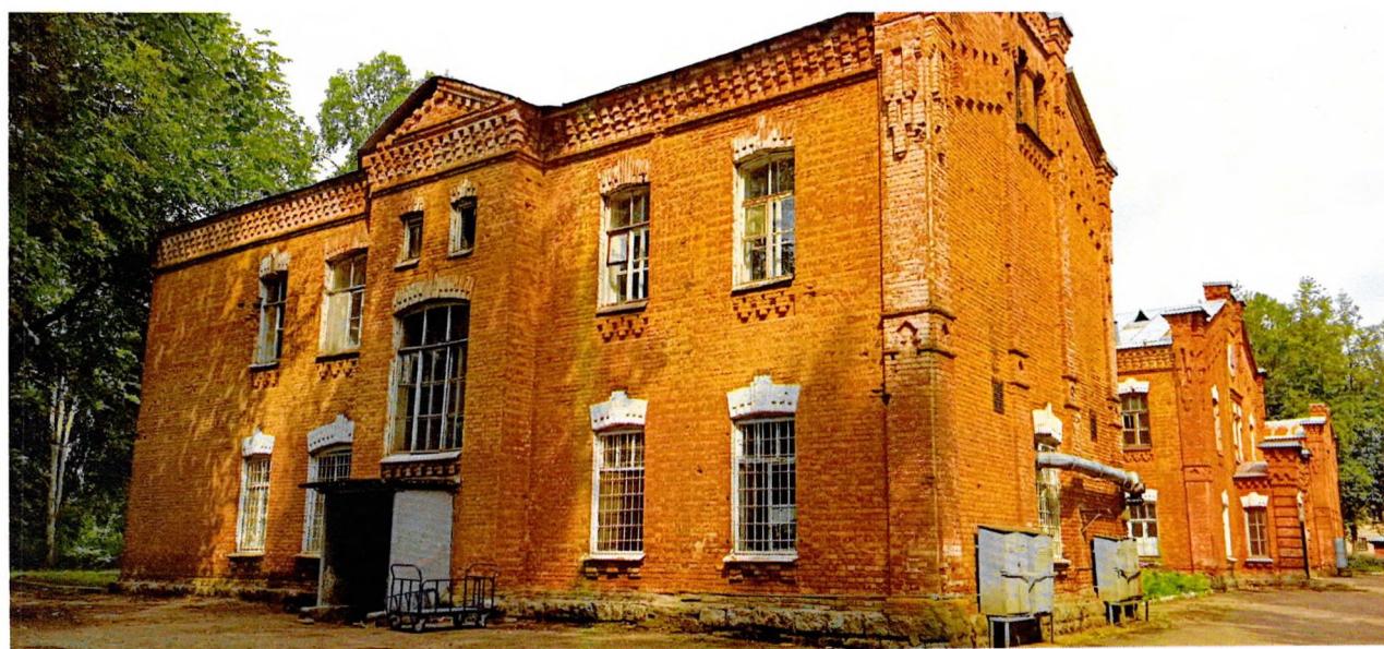
Фото 2 Вид на южный фасад в 5 световых осях.