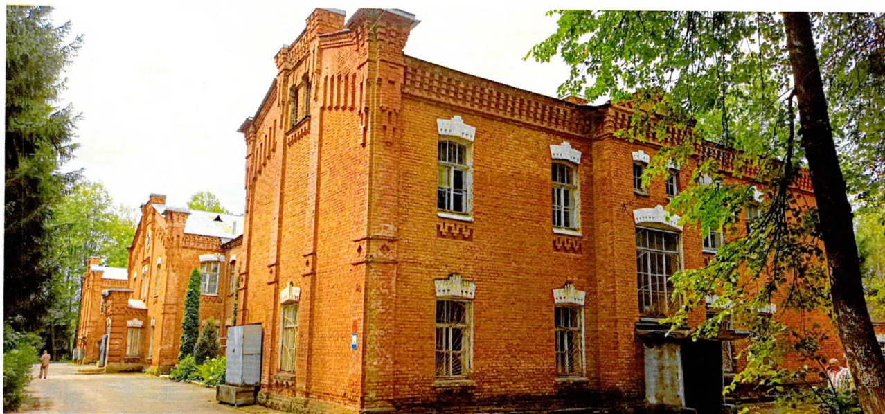
Фото 3. Вид на восточный фасад. Здание Ш-образное в плане, со стороны восточного фасада имеется три выступающих ризалита с треугольными фронтонами, в центральном располагается главный вход в здание