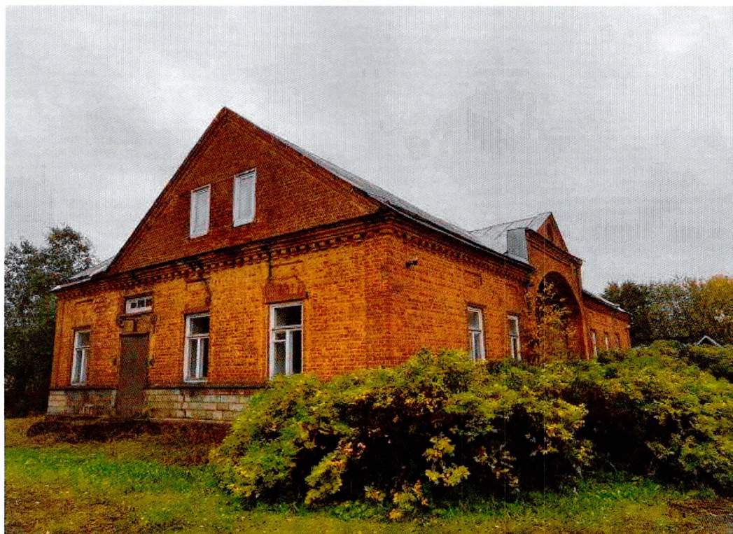
Фото 1. Вид с северо-запада.