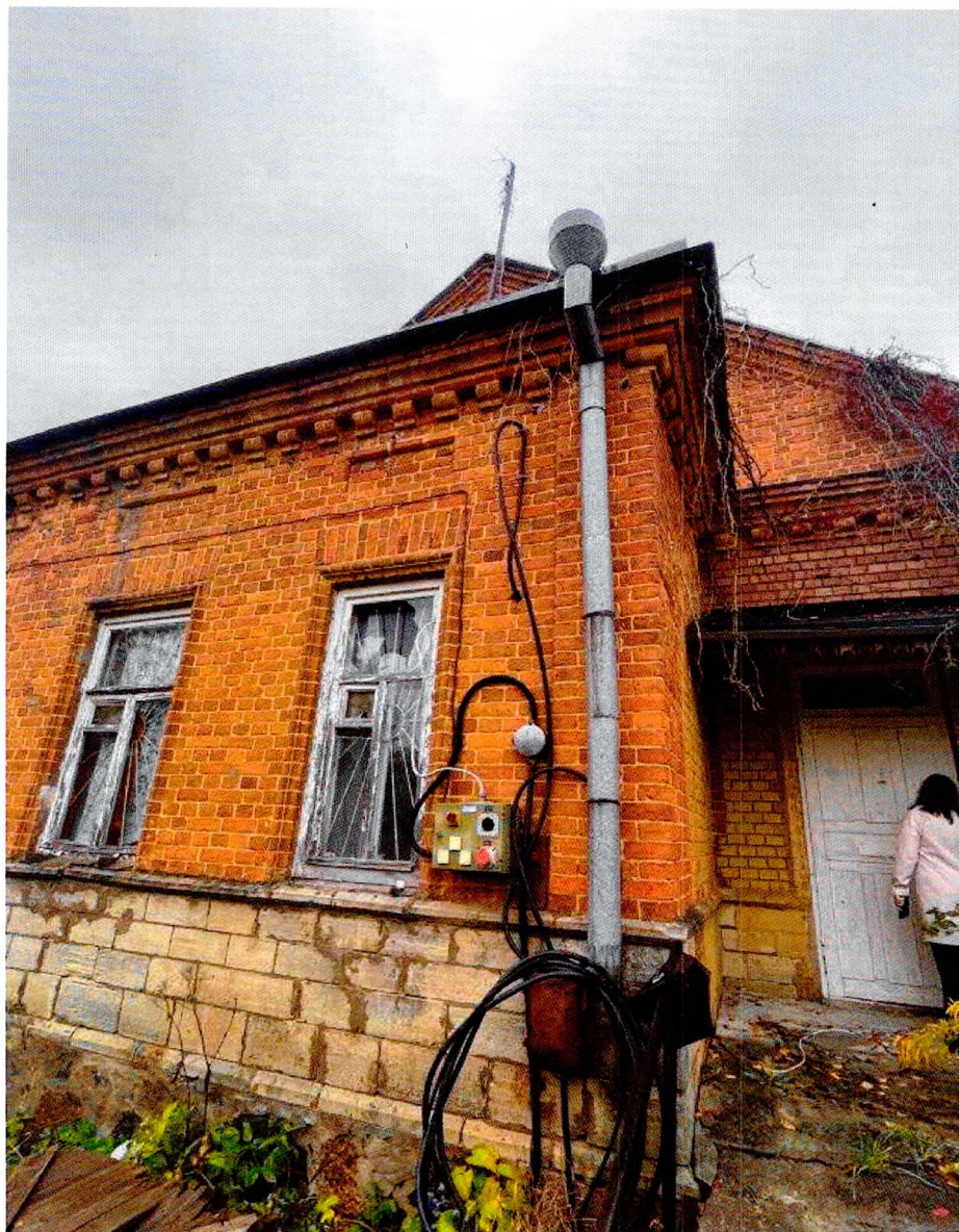
Фото 13. Южный фасад. Утраченные оконные заполнения. Наружные сети.