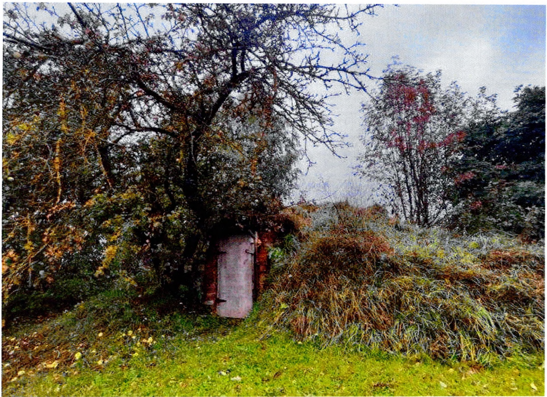
Фото 4. Погреб.