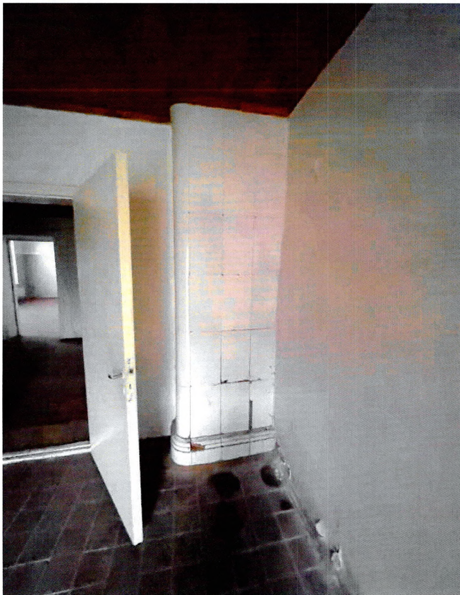
Фото 12. Внутреннее помещение. Камин (заложен).