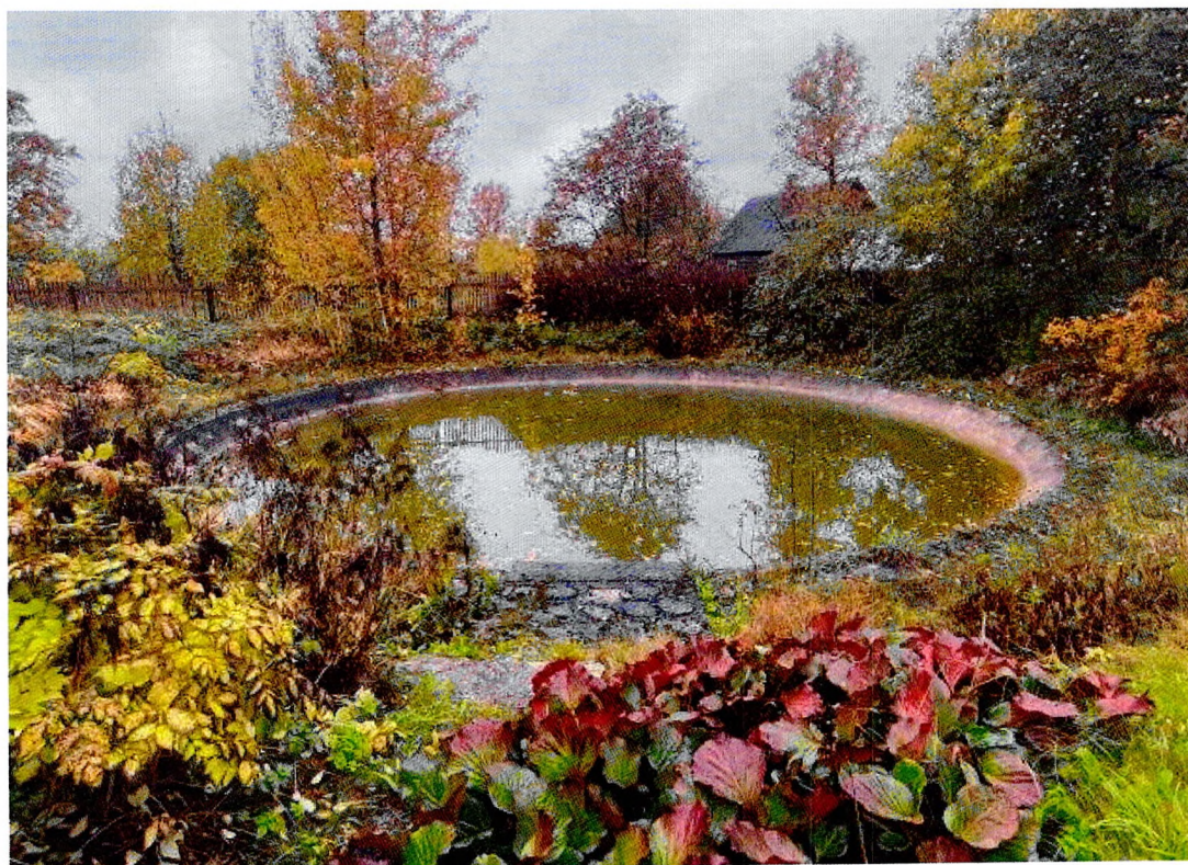
Фото 3. Бассейн.