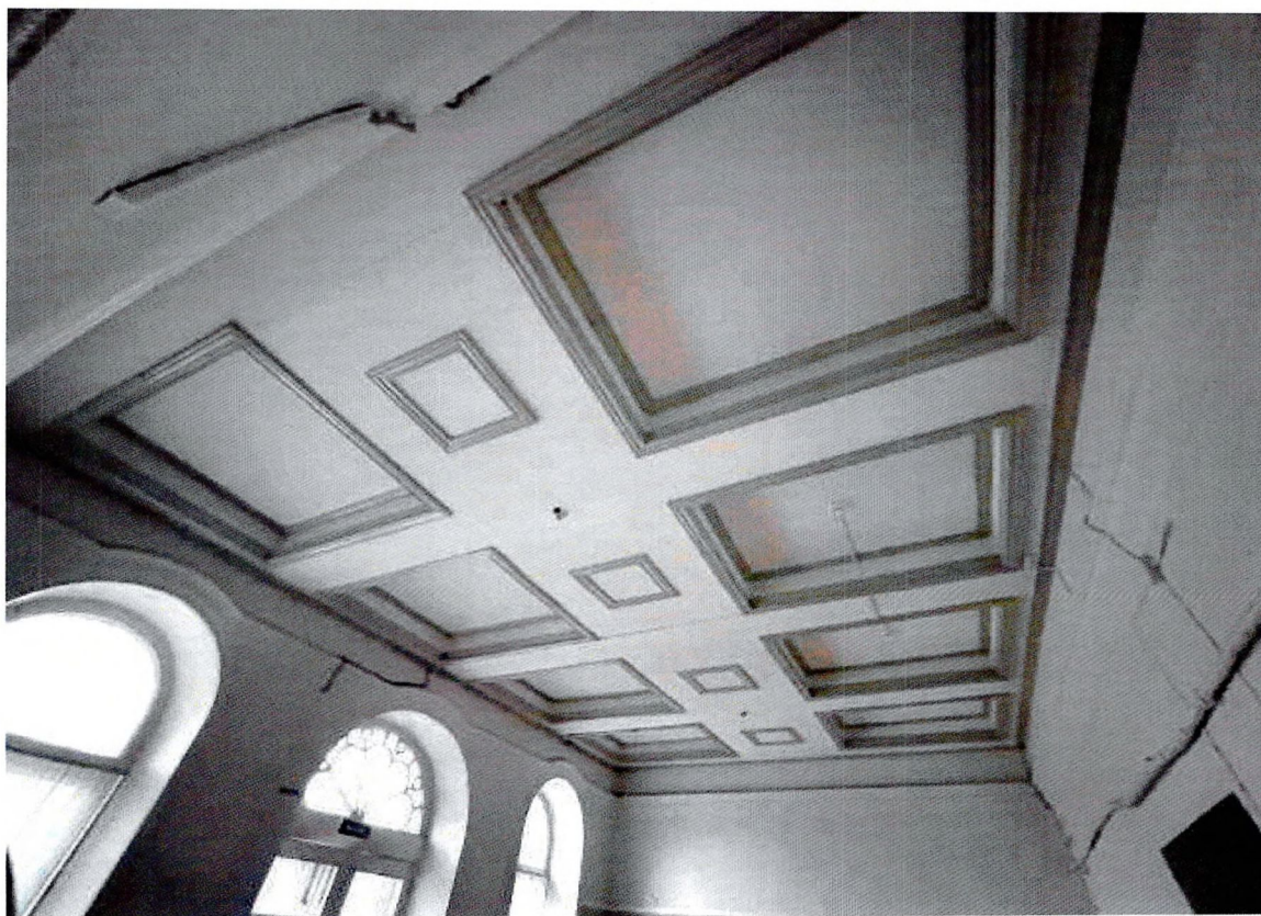
Фото 11. Кессонированный потолок во внутреннем помещении.