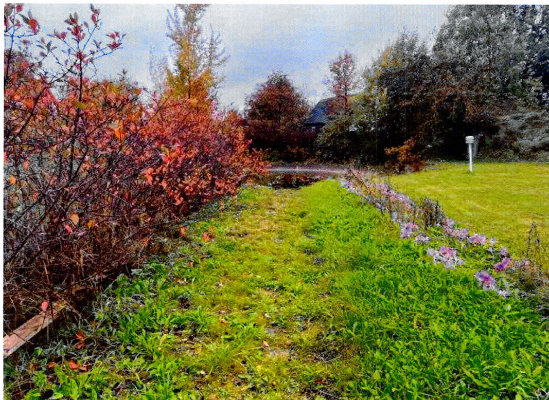
Фото 2. Дорожка к бассейну.