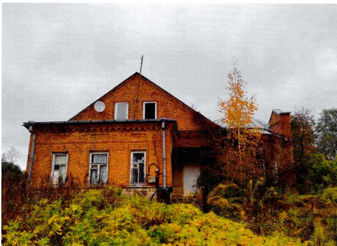
Фото 8. Южный фасад.