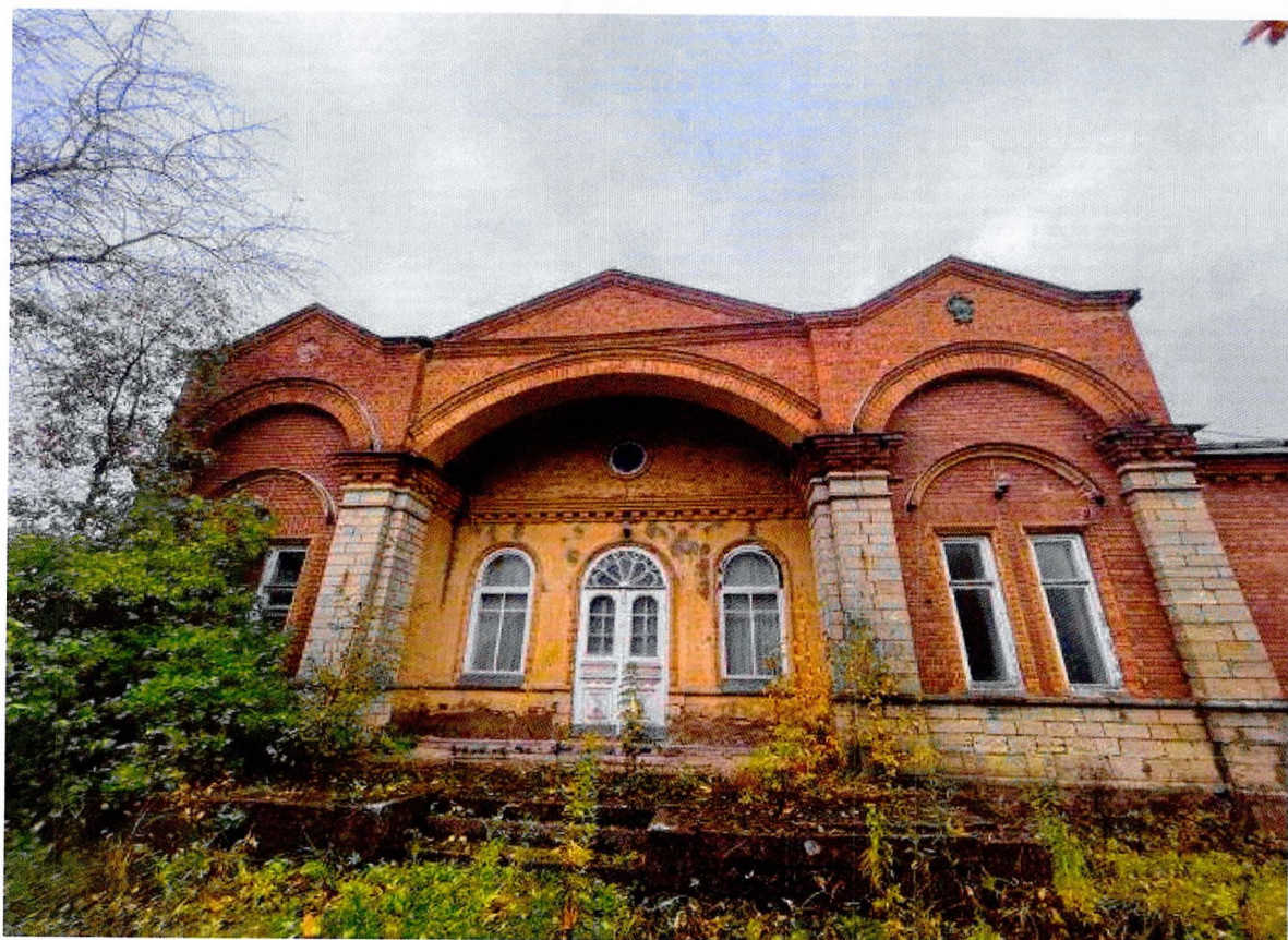
Фото 14. Восточный фасад. Каменный стилобат.