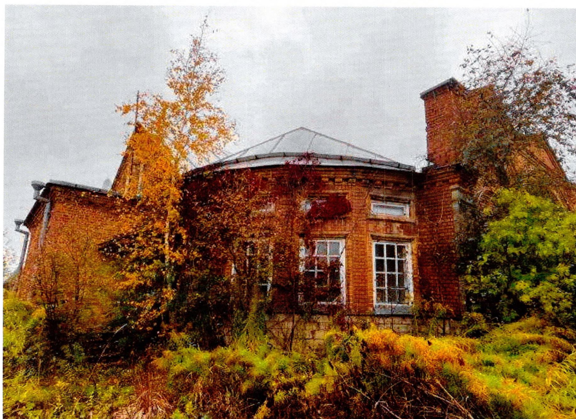
Фото 15. Вид с юго-востока.