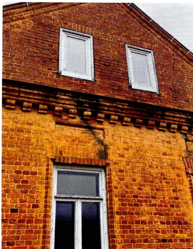
Фото 19. Трещина на северном фасаде.