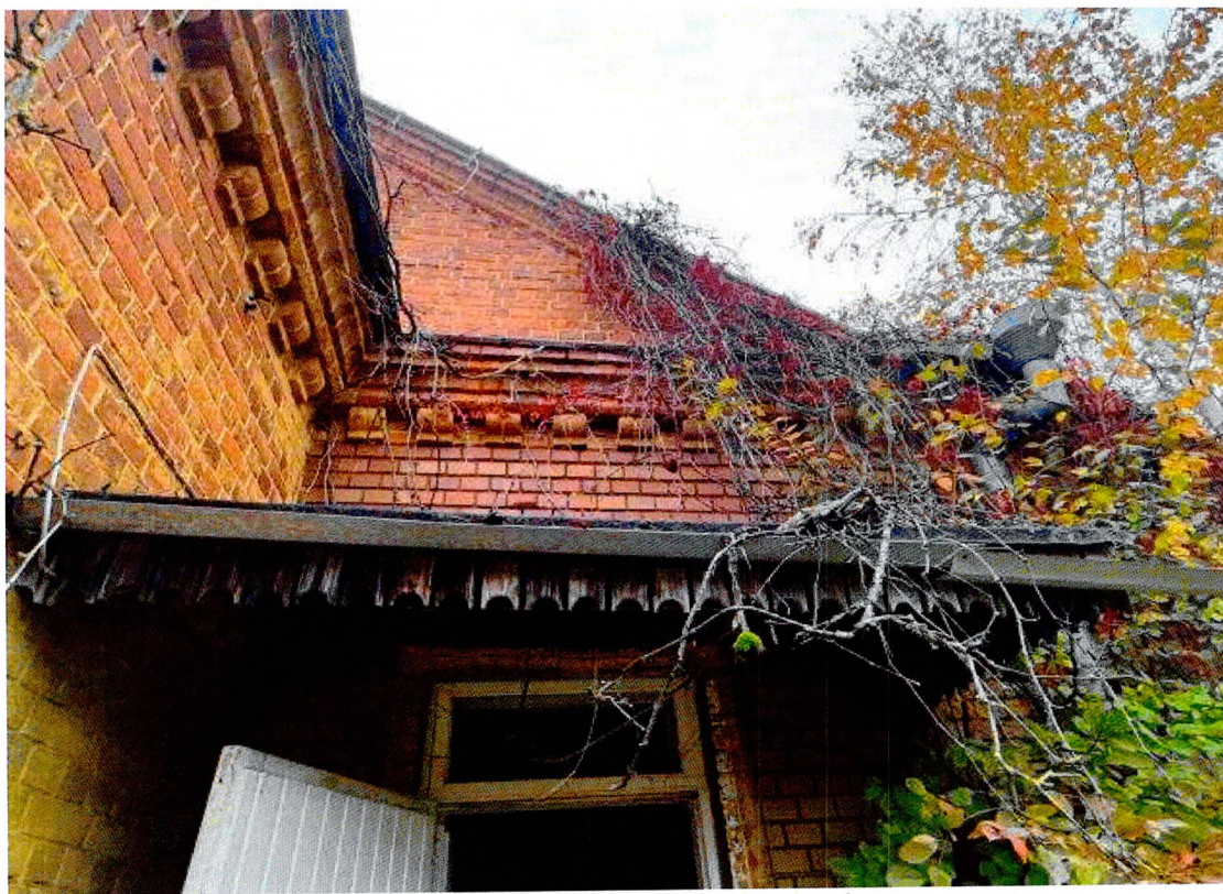
Фото 9. Свес над крыльцом на южном фасаде.