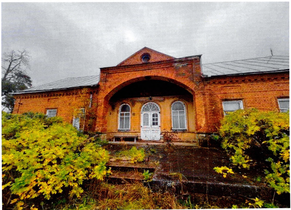
Фото 5. Западный фасад. Каменный стилобат.