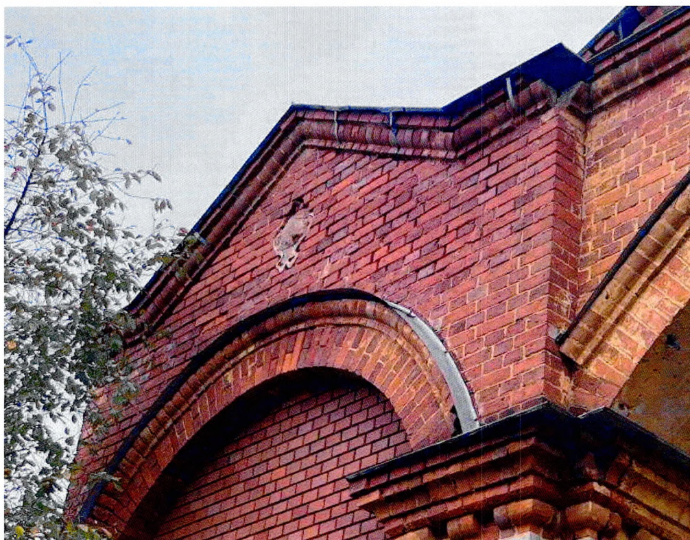
Фото 16. Утраченный картуш.