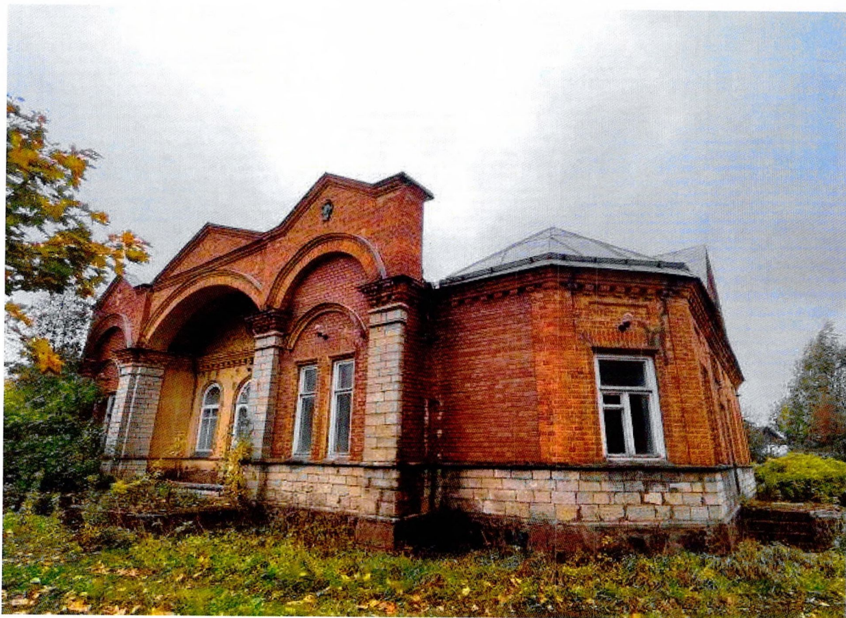
Фото 18. Вид с северо-востока.