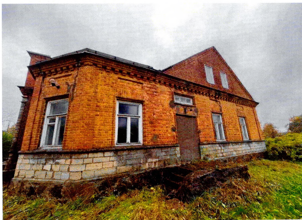
Фото 17. Крыльцо на северном фасаде.