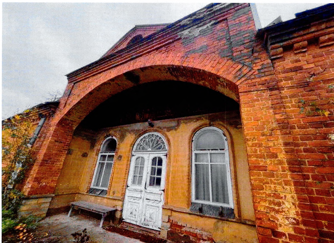
Фото 6. Лоджия западного фасада.