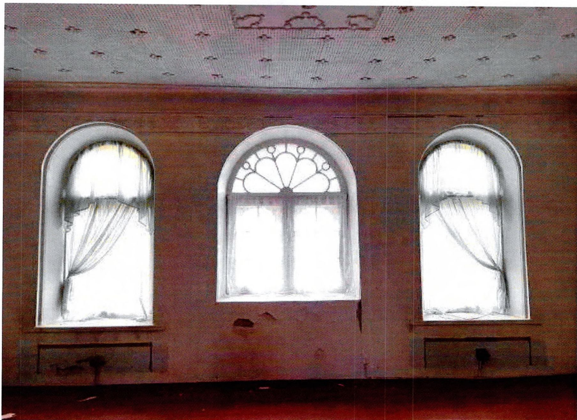
Фото 10. Внутреннее помещение.