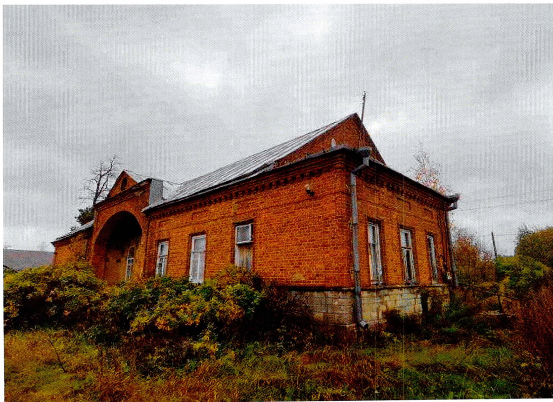
Фото 7. Вид с юго-запада.