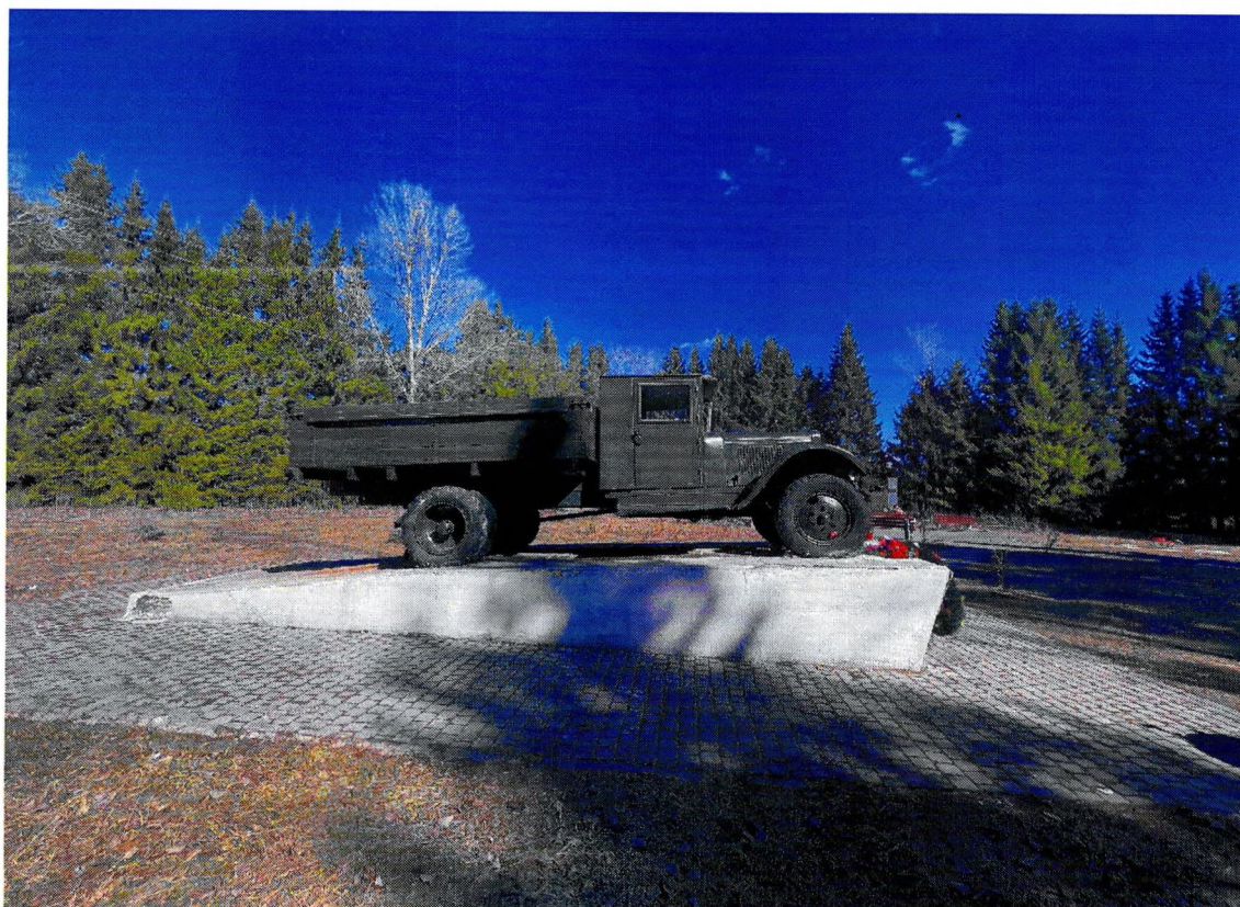
Фотография 5. «Памятный знак – «Автомашина ЗИС-5», установленный на «Дороге жизни», которая проходила здесь в 1941–1942 гг.». Вид с запада.