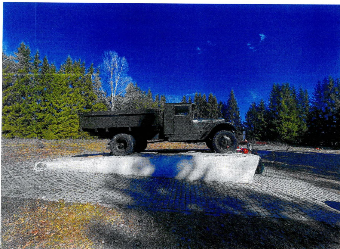
Фотография 5. «Памятный знак – «Автомашина ЗИС-5», установленный на «Дороге жизни», которая проходила здесь в 1941–1942 гг.». Вид с запада.