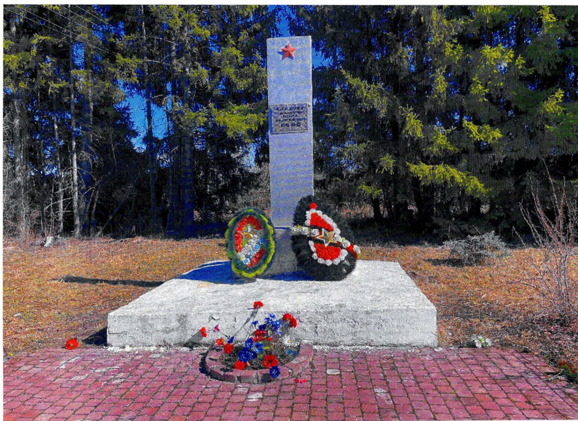
Фотография 6. «Памятный знак – «Автомашина ЗИС-5», установленный на «Дороге жизни», которая проходила здесь в 1941–1942 гг.». Стела.