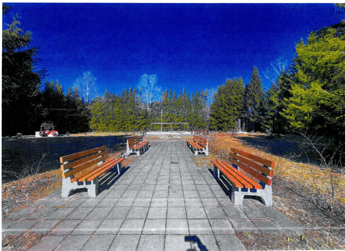
Фотография 4. «Памятный знак – «Автомашина ЗИС-5», установленный на «Дороге жизни», которая проходила здесь в 1941–1942 гг.». Входная зона.