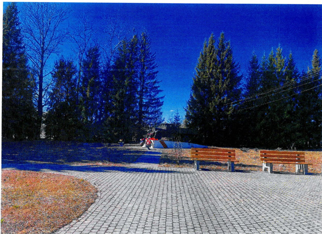
Фотография 3. «Памятный знак – «Автомашина ЗИС-5», установленный на «Дороге жизни», которая проходила здесь в 1941–1942 гг.». Общий вид аллеи.