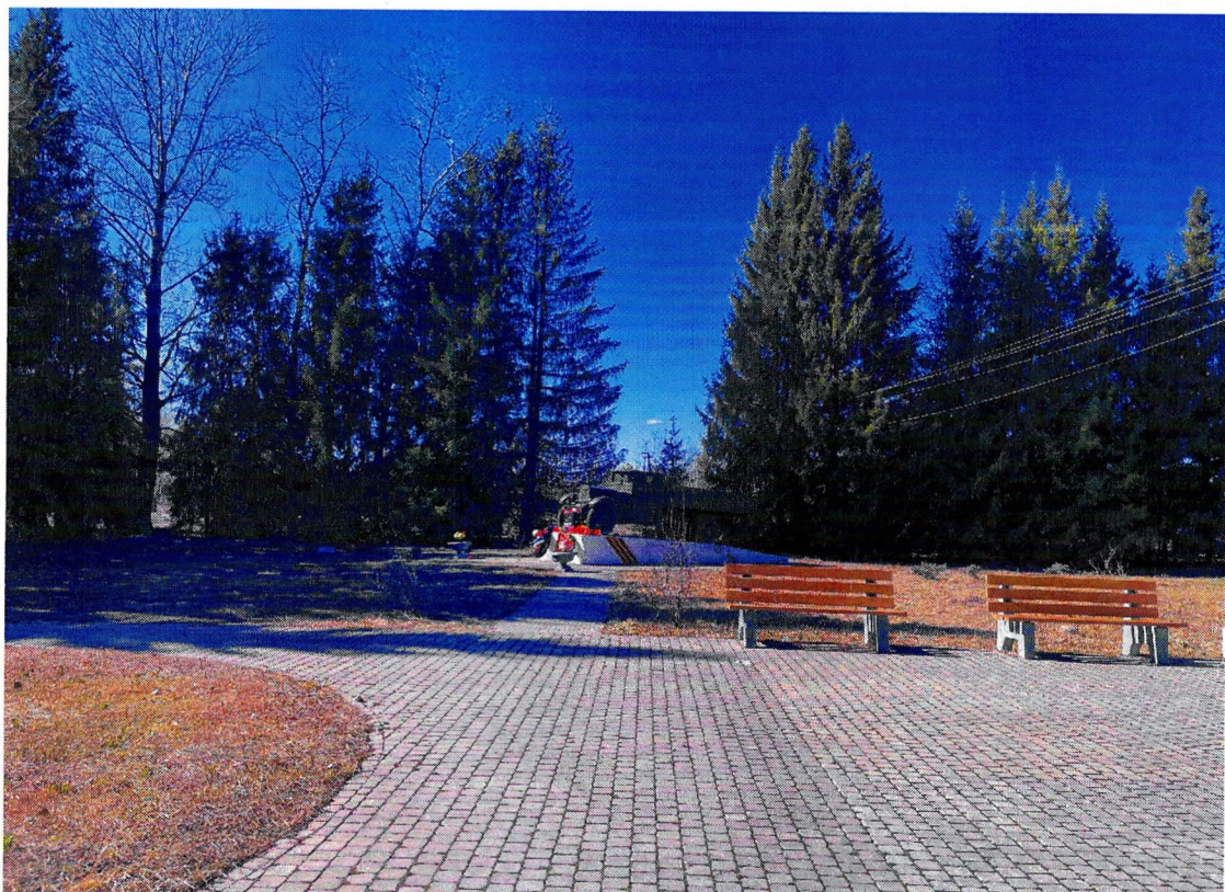
Фотография 3. «Памятный знак – «Автомашина ЗИС-5», установленный на «Дороге жизни», которая проходила здесь в 1941–1942 гг.». Общий вид аллеи.