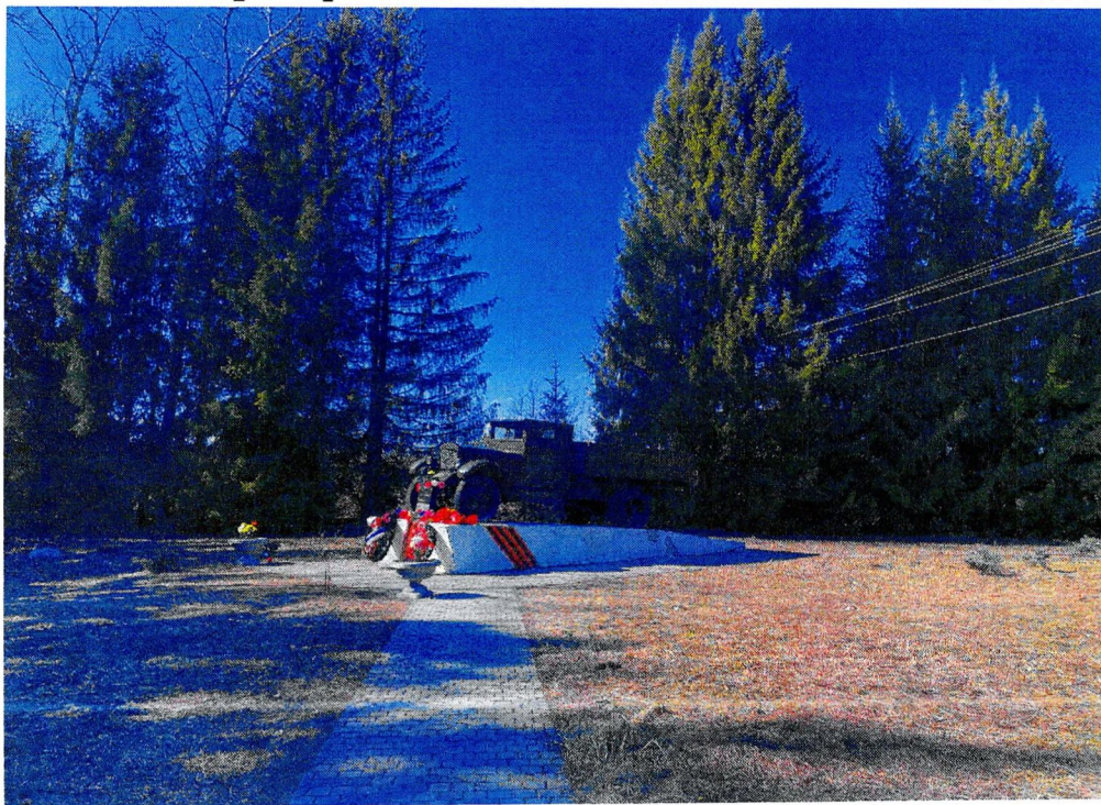
Фотография 2. «Памятный знак – «Автомашина ЗИС-5», установленный на «Дороге жизни», которая проходила здесь в 1941–1942 гг.». Общий вид.