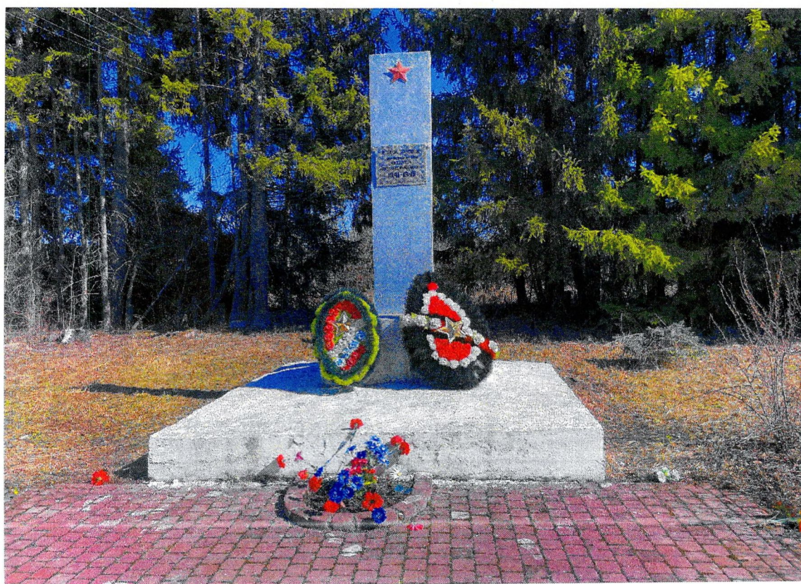
Фотография 6. «Памятный знак – «Автомашина ЗИС-5», установленный на «Дороге жизни», которая проходила здесь в 1941–1942 гг.». Стела.