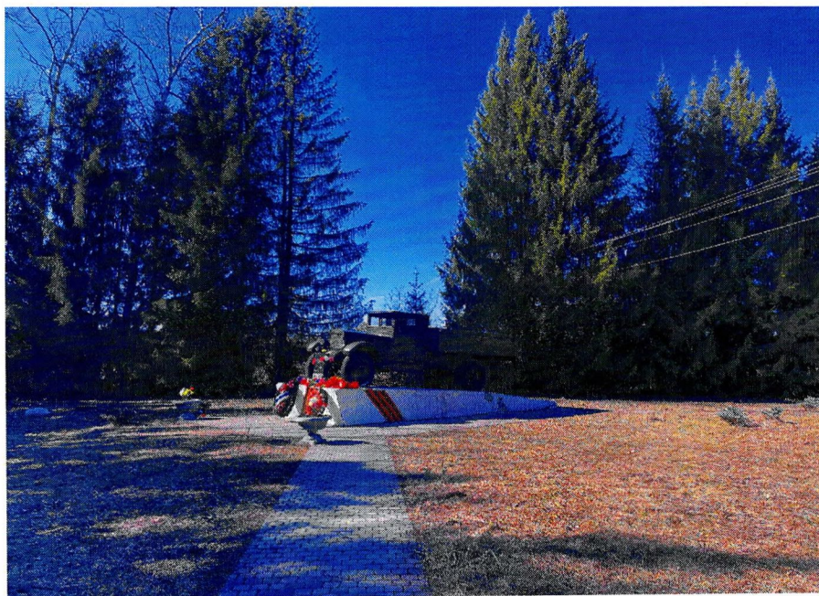
Фотография 2. «Памятный знак – «Автомашина ЗИС-5», установленный на «Дороге жизни», которая проходила здесь в 1941–1942 гг.». Общий вид.