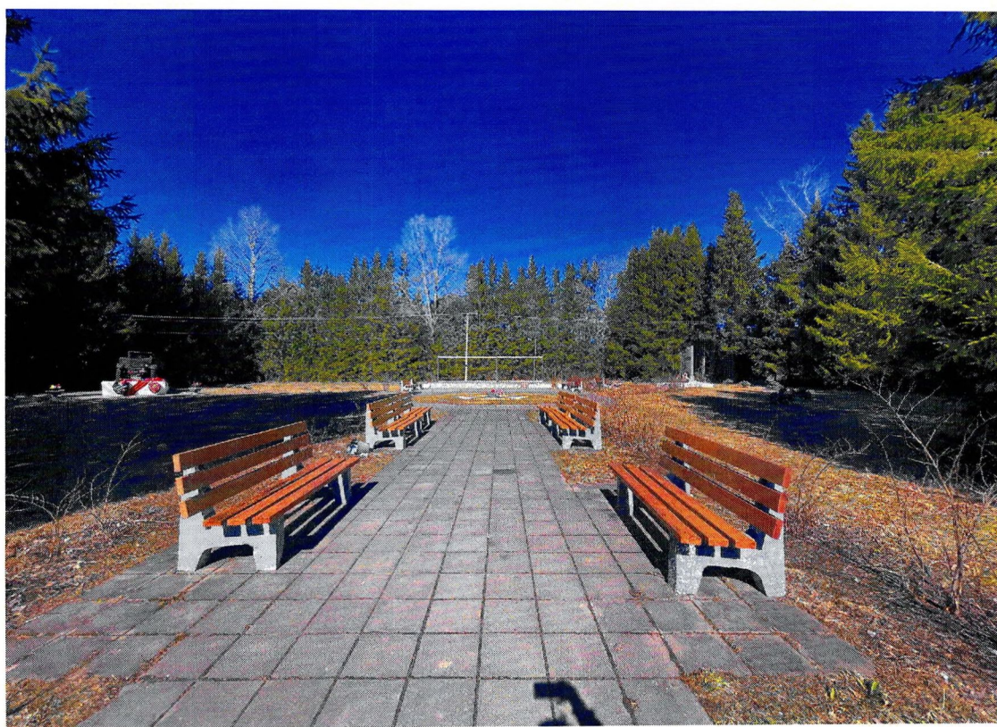
Фотография 4. «Памятный знак – «Автомашина ЗИС-5», установленный на «Дороге жизни», которая проходила здесь в 1941–1942 гг.». Входная зона.