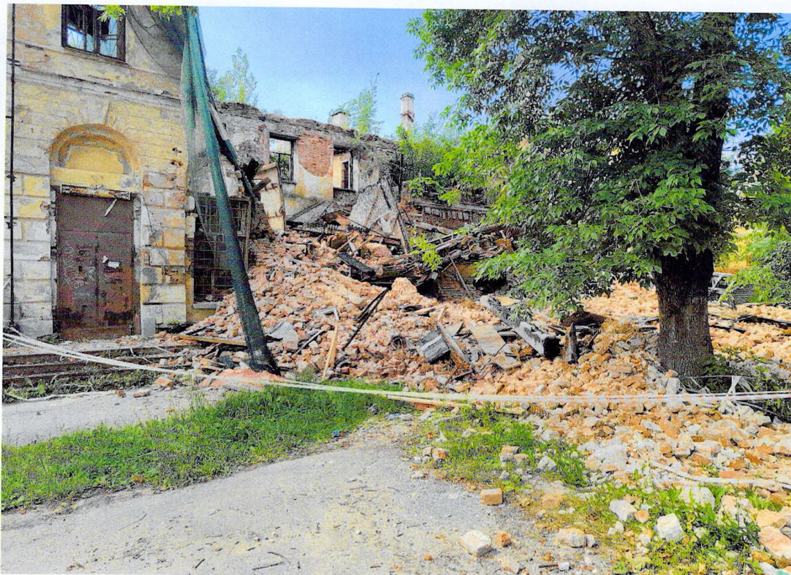
Фото 3. Фрагмент северо-западного фасада.