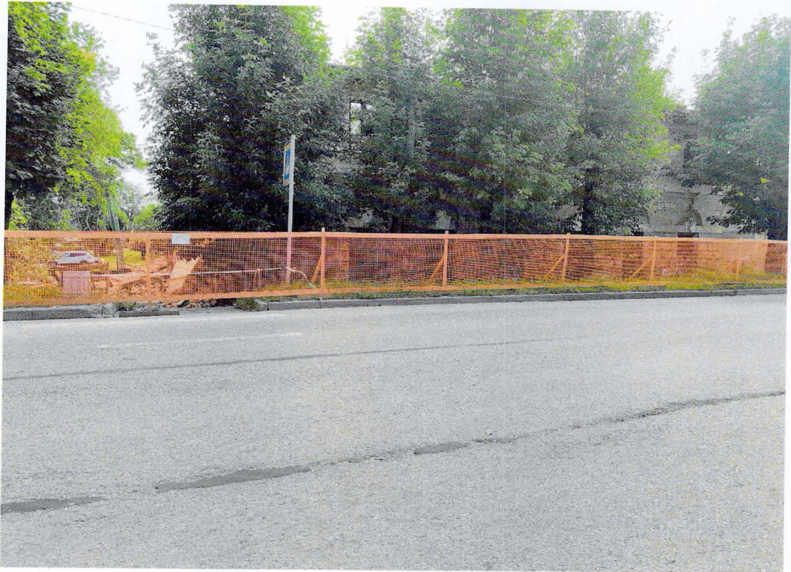
Фото 5. Фрагмент западного фасада.