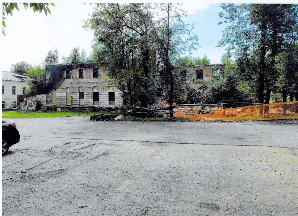
Фото 1. Северный фасад.

Фотофиксация объекта культурного наследия регионального значения «Здание б. присутственных мест» по адресу: Ленинградская область, Лужский муниципальный район, Лужское городское поселение, г. Луга, пр. Володарского, д. 2 от 20.08.2025