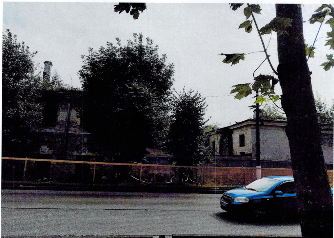
Фото 6. Фрагмент западного фасада.