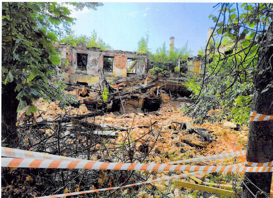
Фото 4. Фрагмент северо-западной части здания.