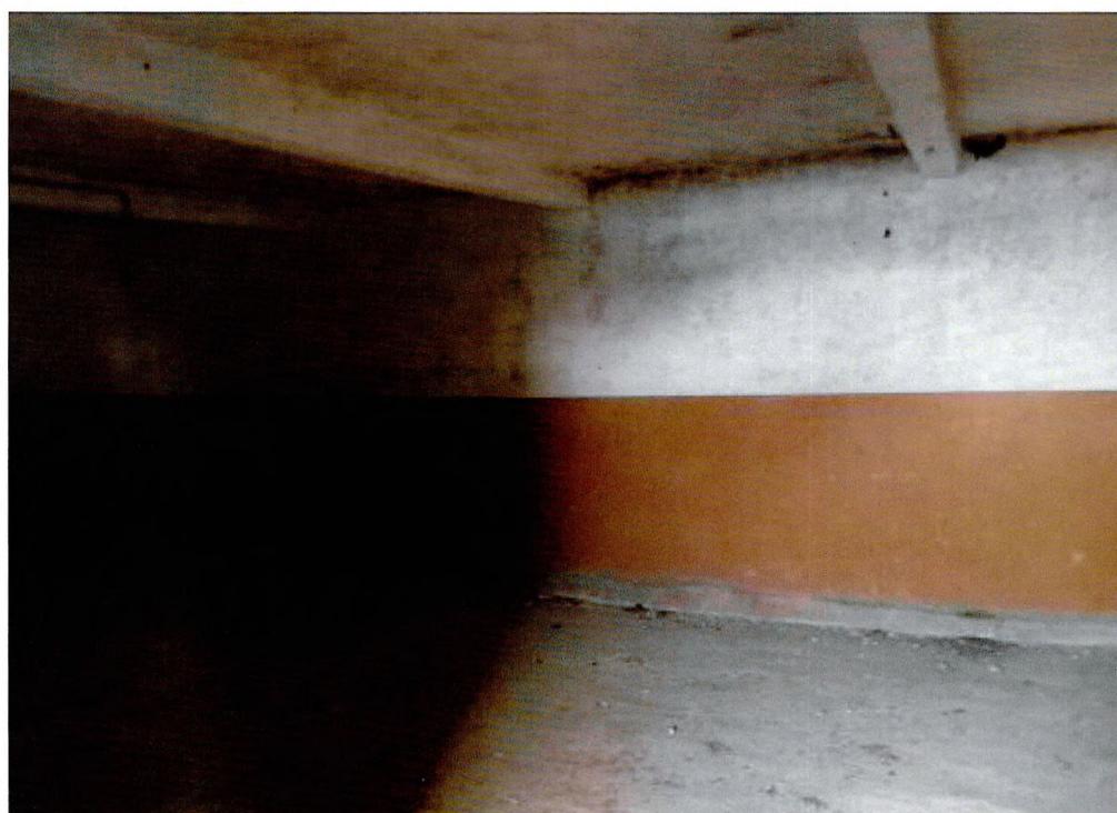
Фото 19. Помещения 2-ого этажа.