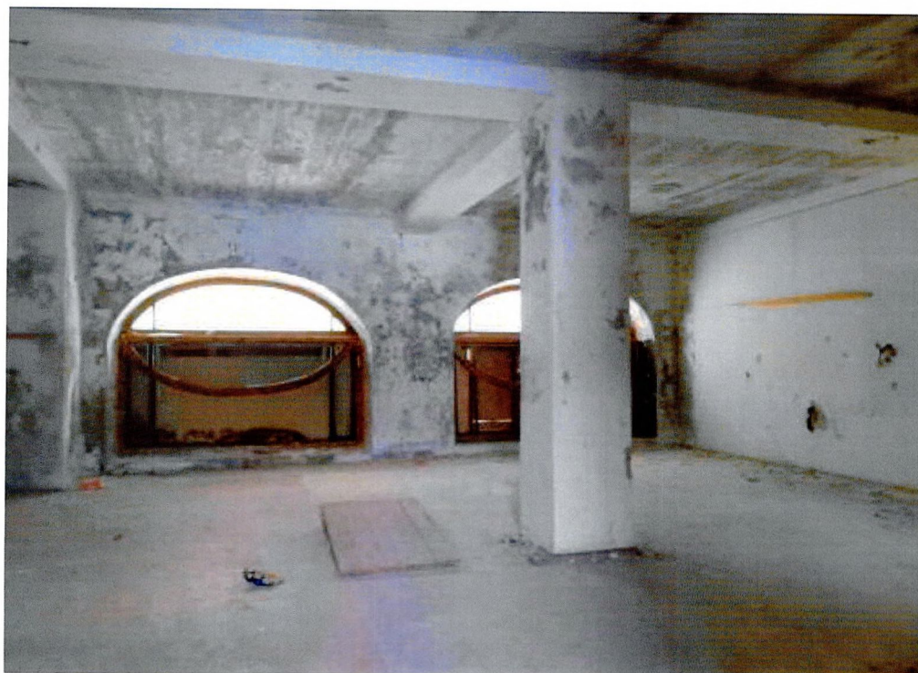
Фото 15. Помещения 1-ого этажа.