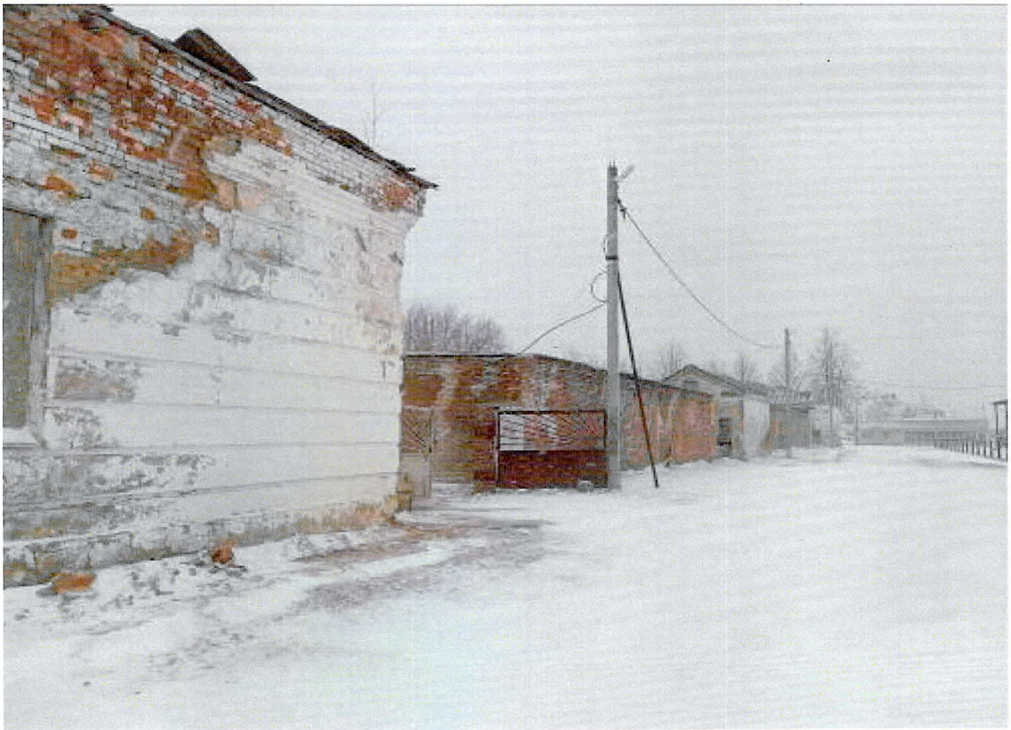
Фото 5-6. Повреждения фасадов.