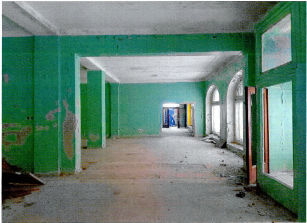
Фото 11. Галерея 1-ого этажа.