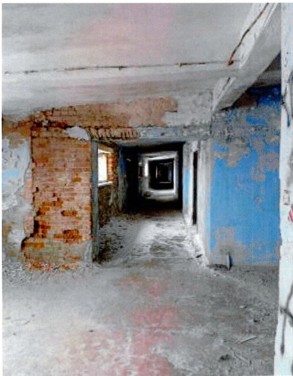
Фото 17. Галерея 2-ого этажа.