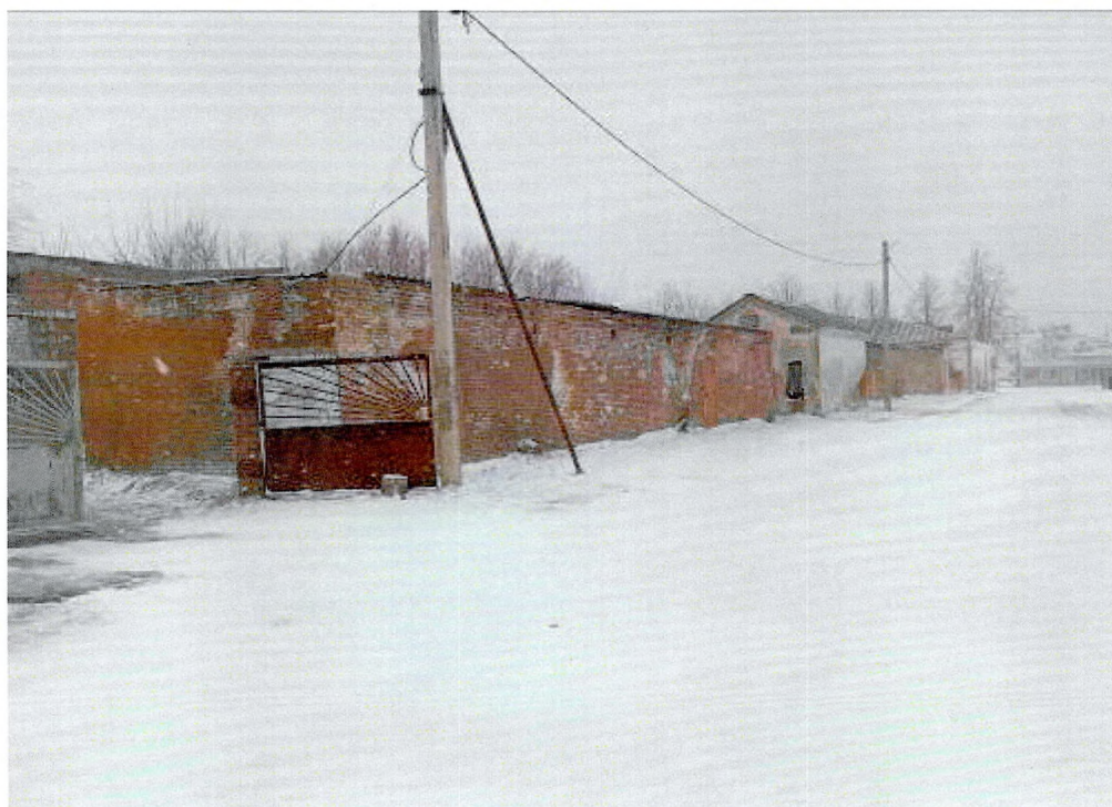
Фото 8. Вид со стороны р. Волхов на внутренний двор (поздняя застройка).