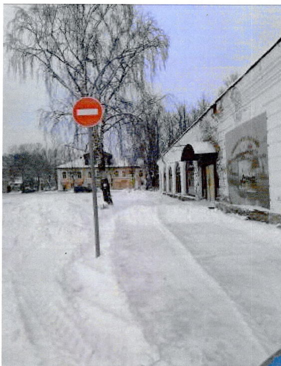
Фото 7. Фасад со стороны ул. Пионерской.