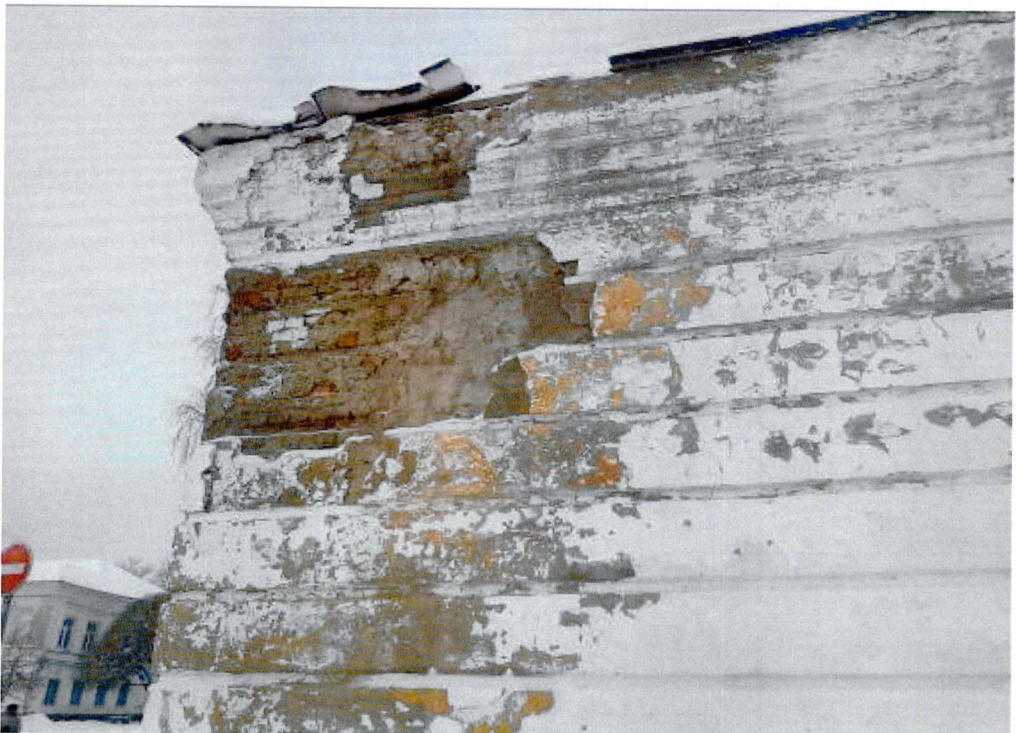
Фото 10. Обрушение фасада. Угол - пересечение набережной р. Волхов и ул. Пионерской.