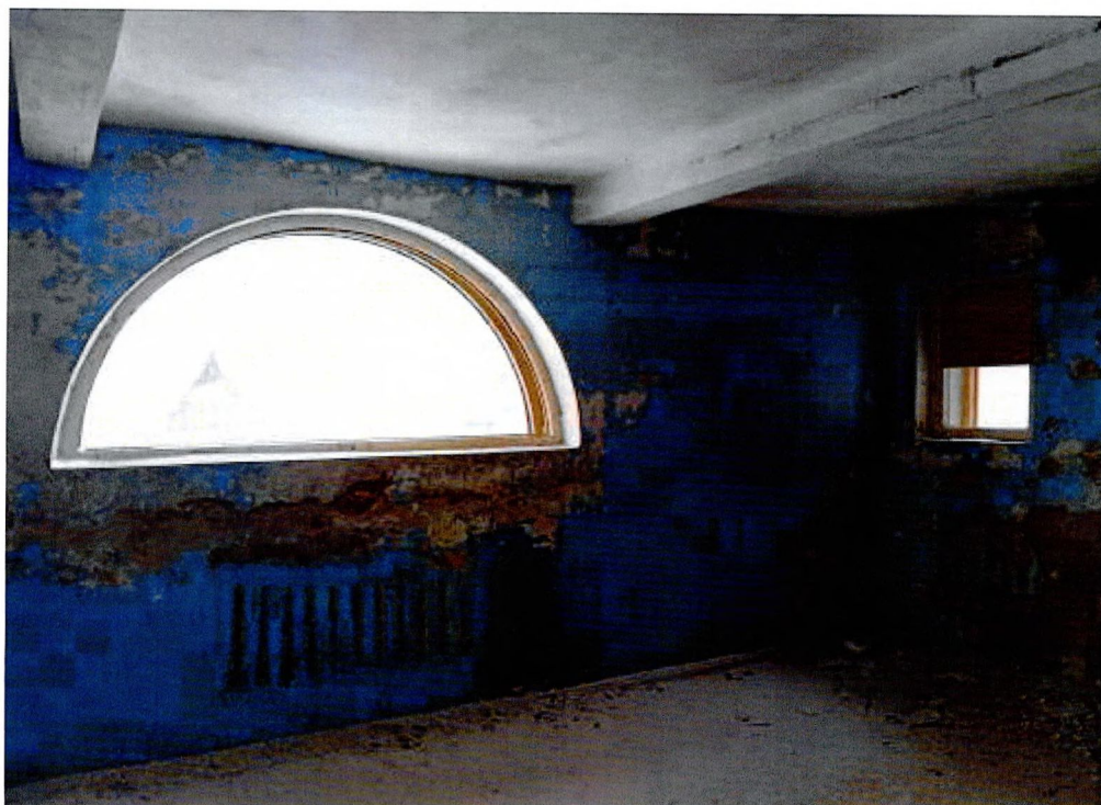
Фото 18. Помещения 2-ого этажа.