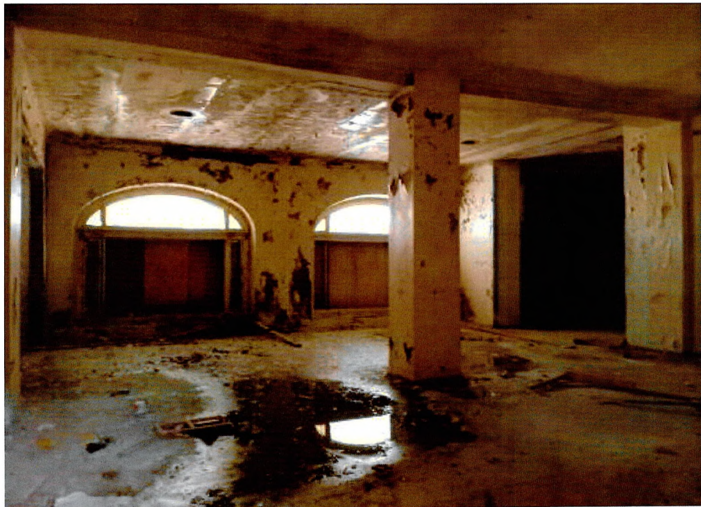
Фото 14. Помещения 1-ого этажа.