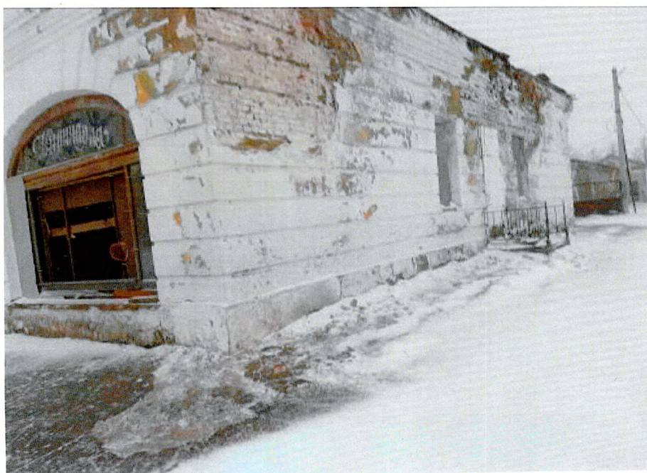
Фото 2. Вид с угла пр. Карла Маркса и ул. Пионерской.