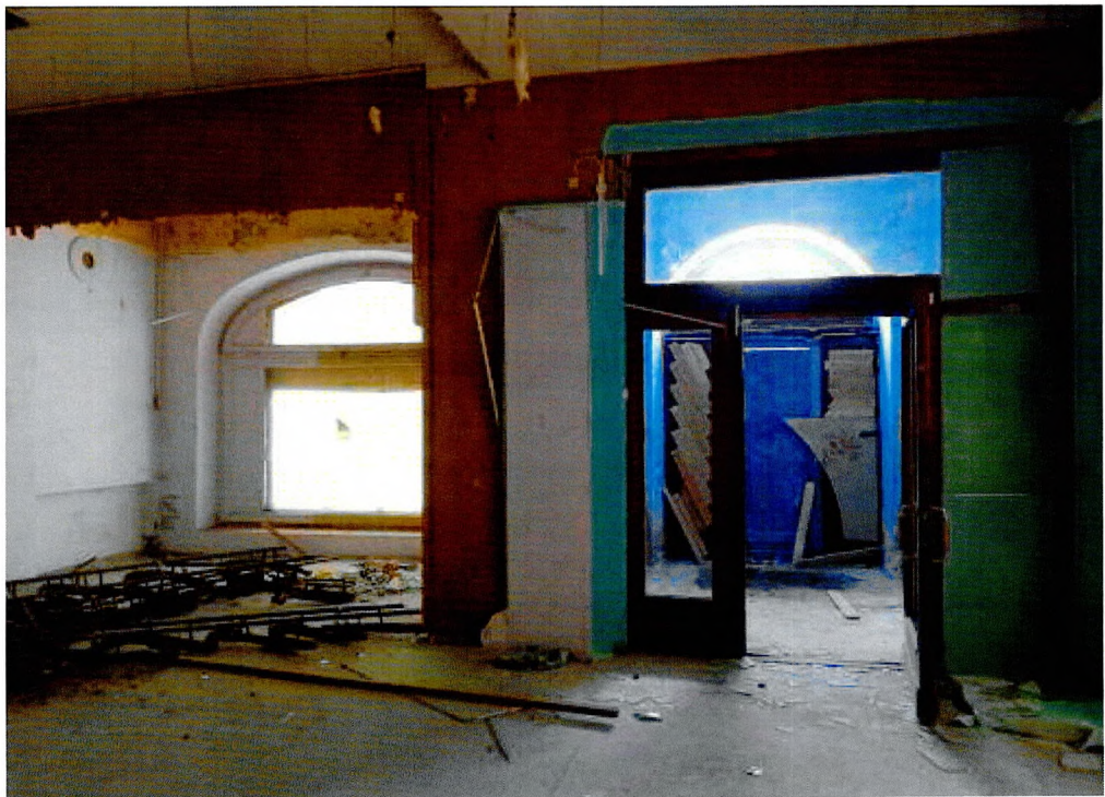
Фото 12. Оконные и дверные заполнения 1-ого этажа.