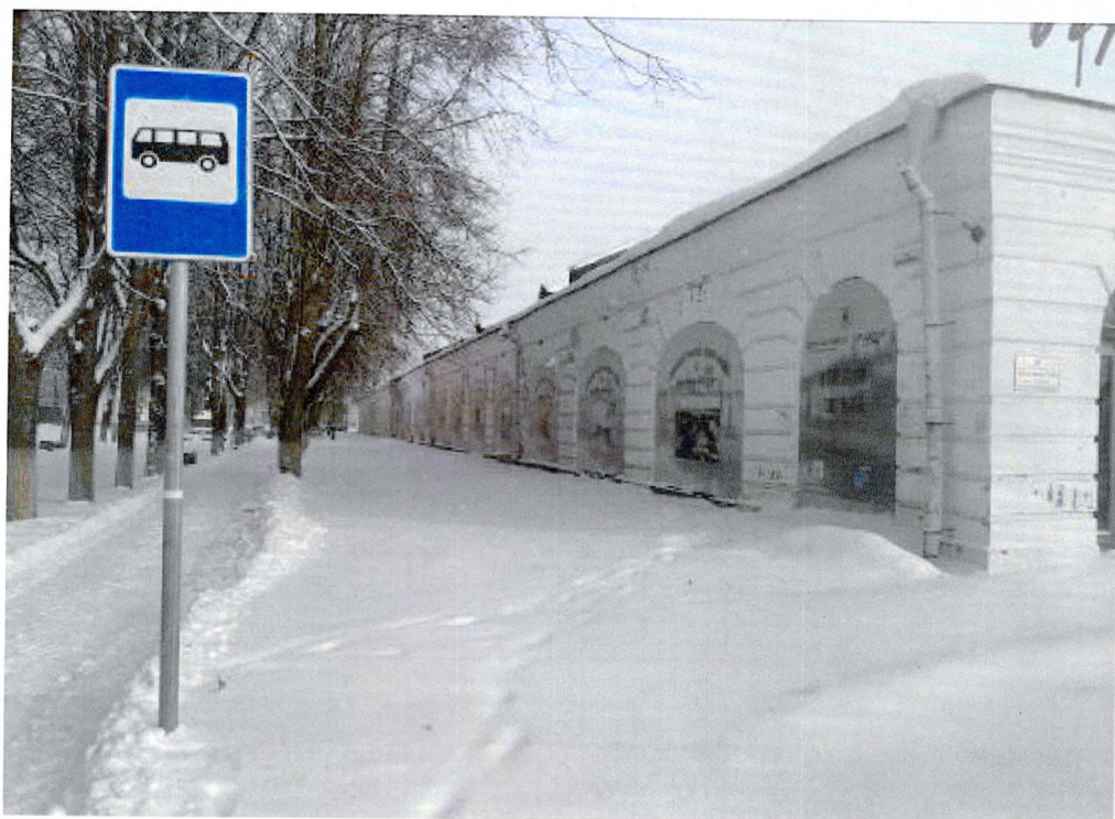
Фото 3. Фасад со стороны пр. Карла Маркса.