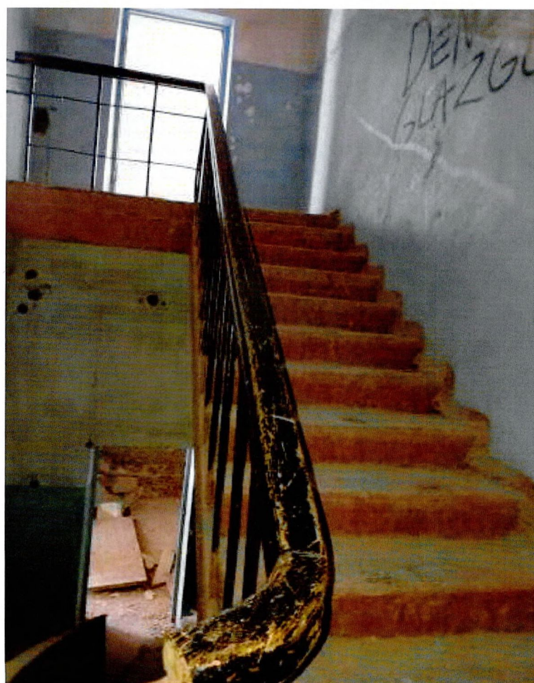
Фото 16. Лестничный марш на 2-ой этаж.