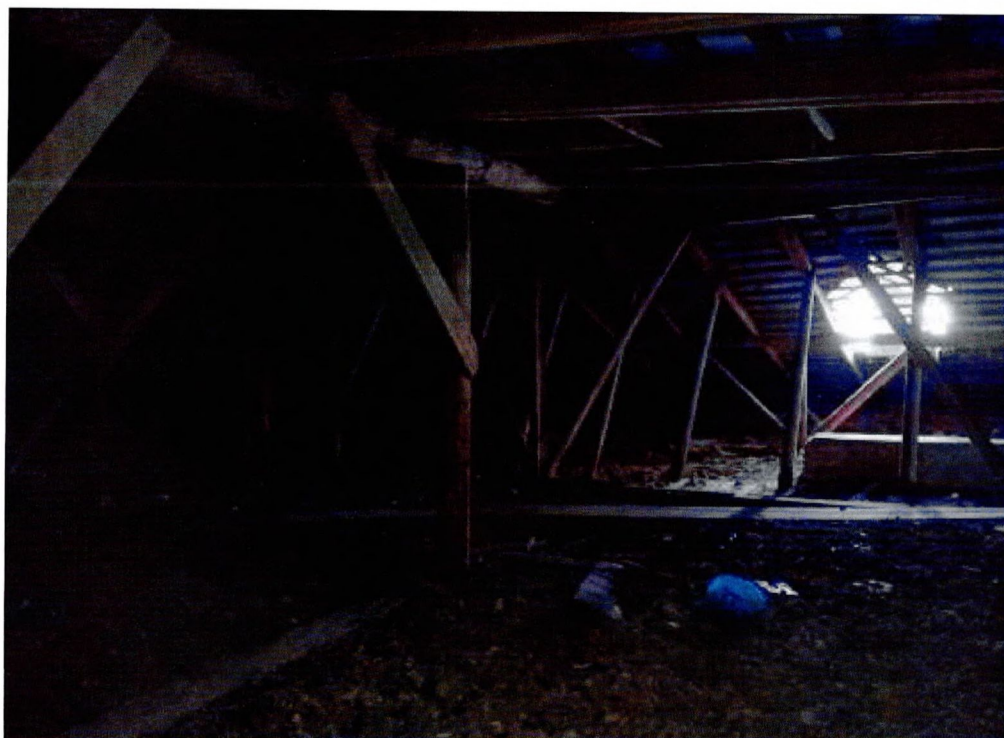
Фото 20. Стропильная система.