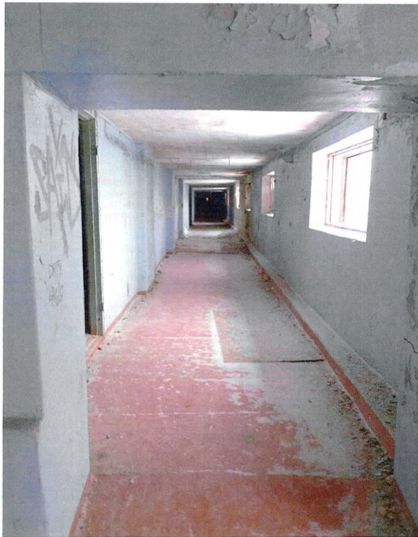
Фото 16. Галерея 2-ого этажа.