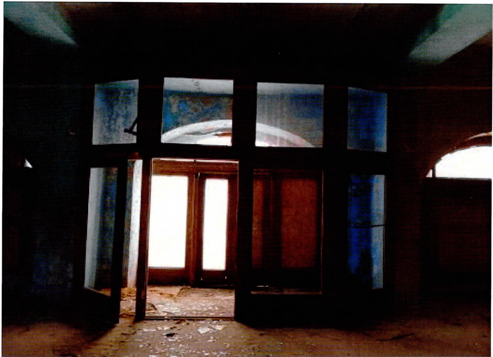
Фото 13. Дверные заполнения 1-ого этажа.