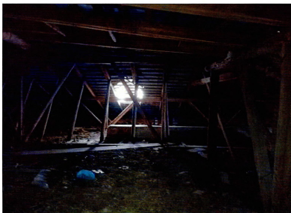
Фото 21. Чердак. Стропильная система.