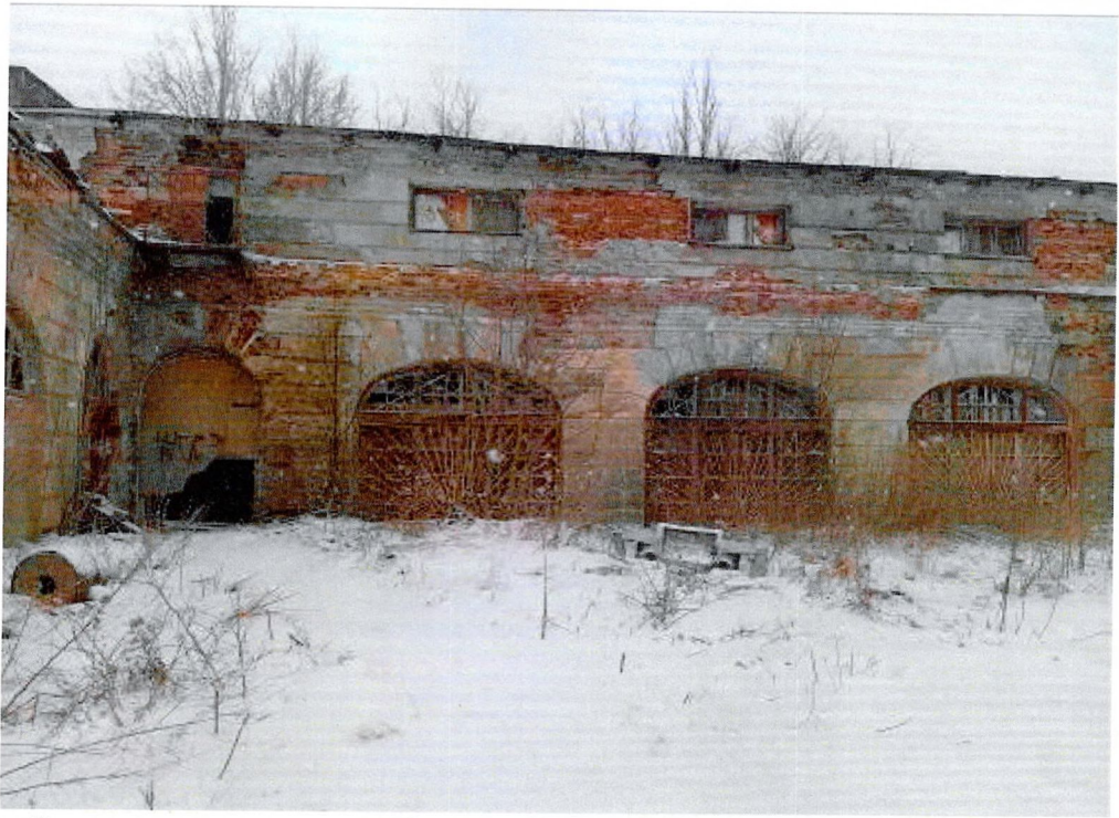
Фото 9. Фасад со стороны р. Волхов. Вид на ограждение внутреннего двора.