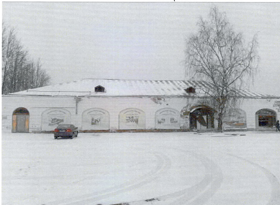
Фото 1. Вид с угла пр. Карла Маркса и пл. Кирова.