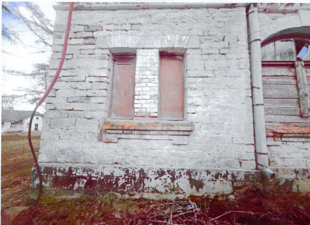
Фото 15. Фрагмент северного фасада. Сдвоенный оконный проем с общим подоконником.