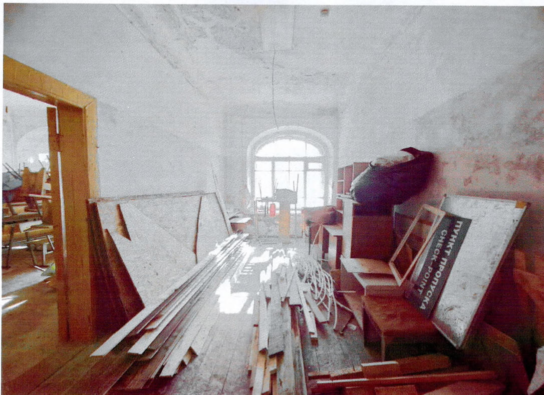
Фото 19. Помещение на первом этаже.