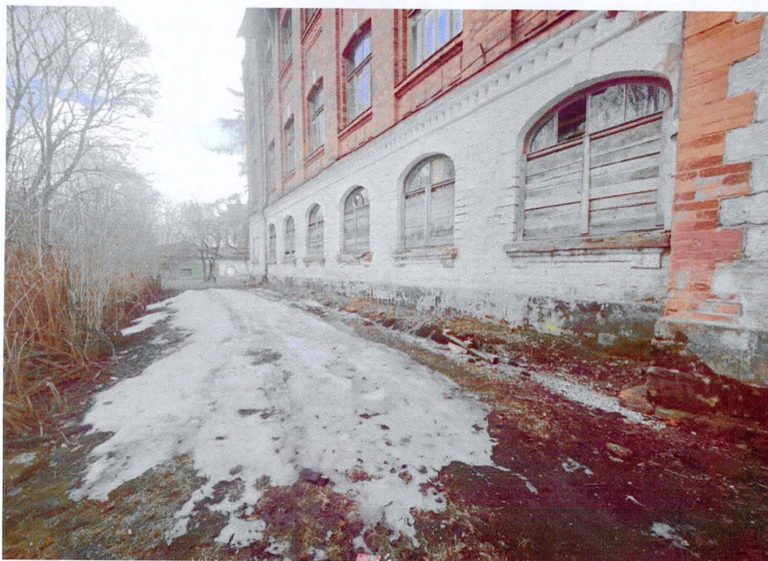
Фото 13. Фрагмент северного фасада. Оформление первого этажа белокаменным рустом. Оконные проемы первого этажа защиты досками.