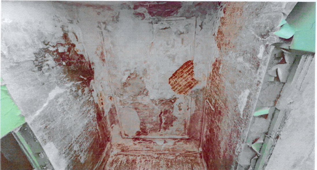
Фото 25. Перекрытие третьего этажа (чердачное) и стены в одном из помещений третьего этажа.