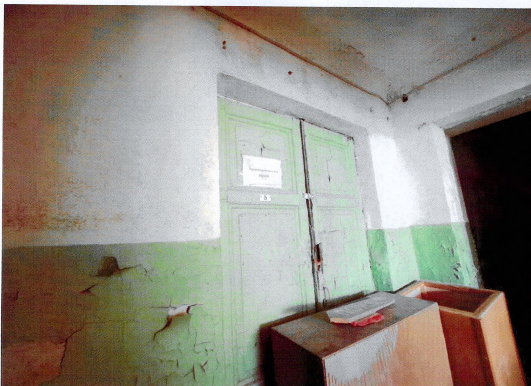
Фото 21. Филенчатая внутренняя дверь.