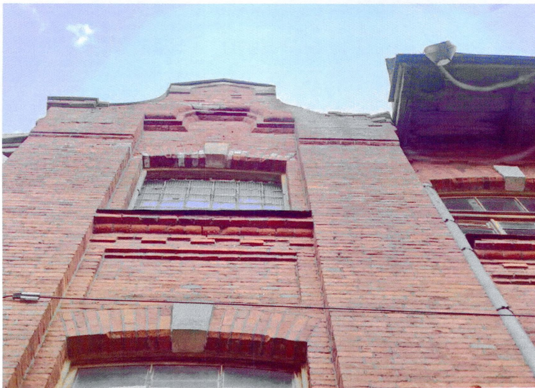
Фото 16. Фрагмент северного фасада. Северо-восточный щипец.