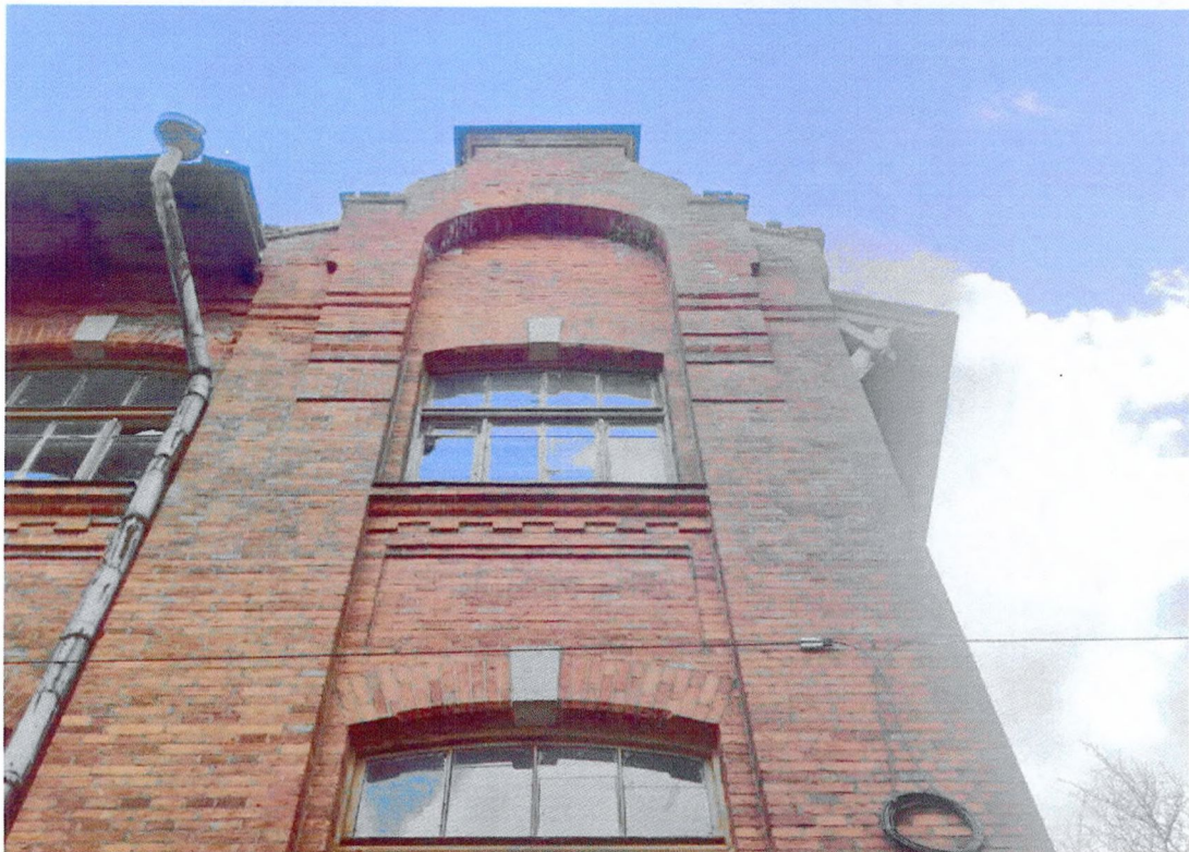
Фото 12. Фрагмент северного фасада. Северо-западный щипец.