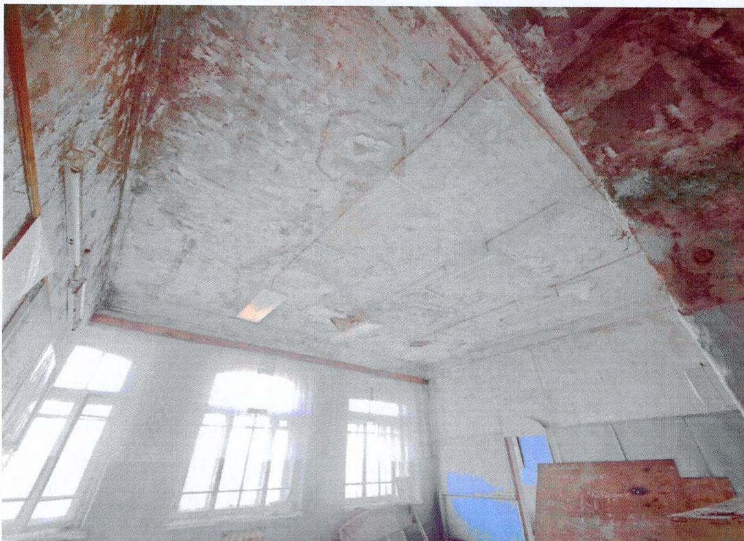
Фото 27. Помещение на третьем этаже.