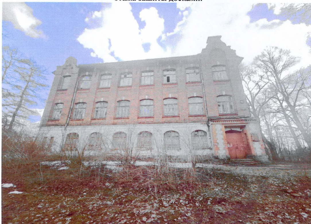
Фото 10. Северный фасад.