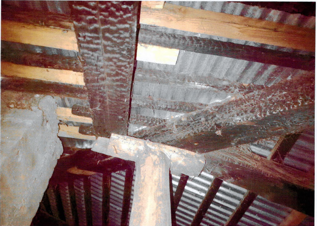
Фото 29. Фрагмент стропильной системы, следы огневого воздействия. Окрытие кровли позднее из профлиста.