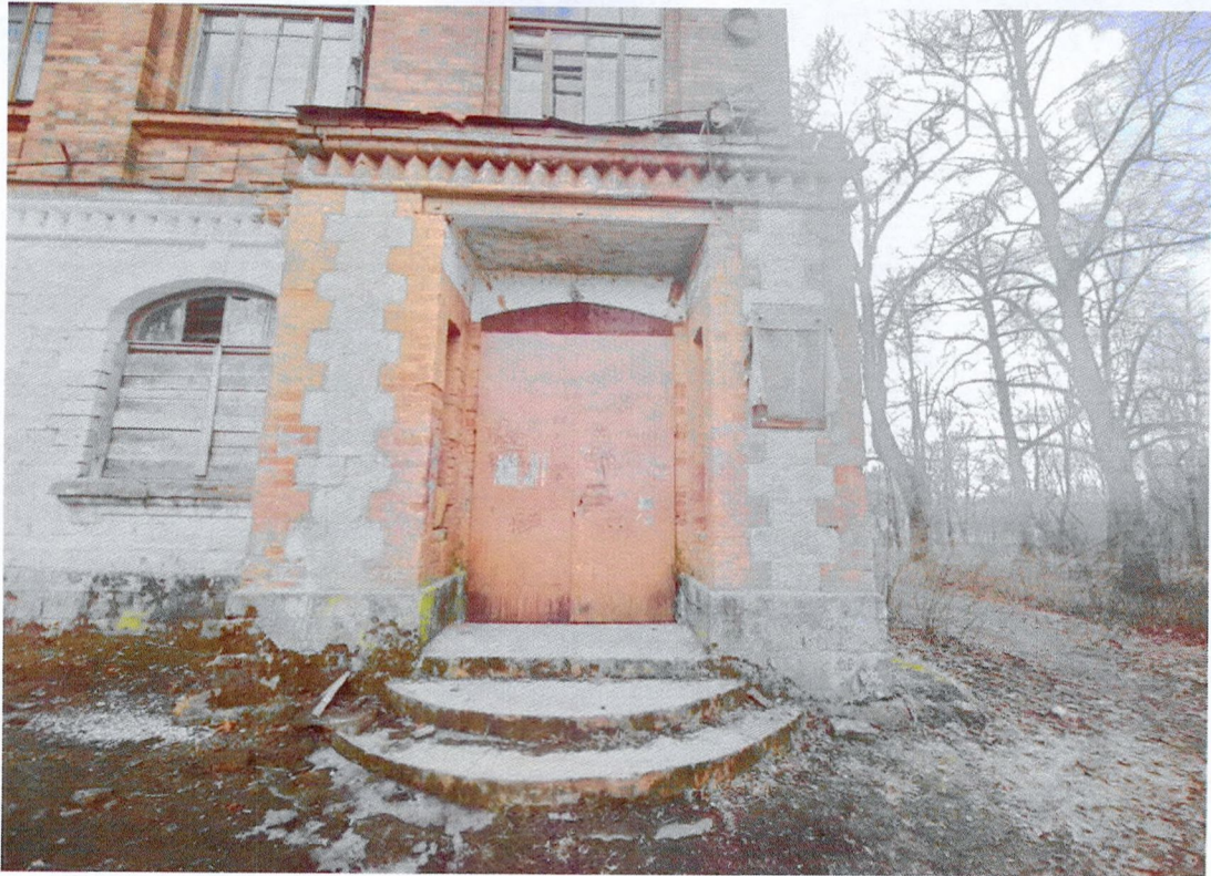
Фото 11. Фрагмент северного фасада. Оформление выступающей входной группы вставками белого камня. Декоративный карниз. Дверное заполнение позднее металлическое.