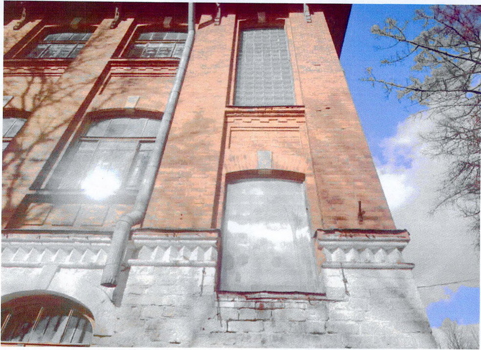
Фото 3. Фрагмент главного фасада. Ризалит в зоне лестничной клетки. Кирпичный декор, в том числе пояс поребрика, лопатки, филенки, зубцы.