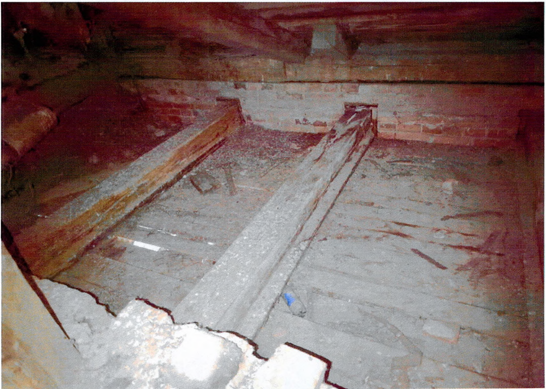
Фото 30. Чердачное деревянное перекрытие.