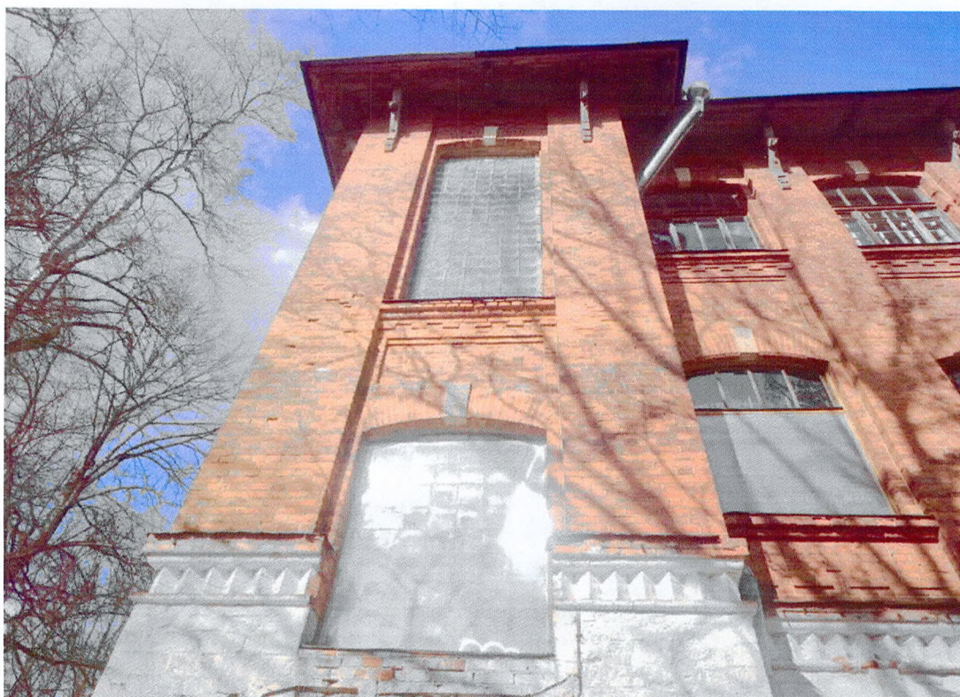
Фото 8. Фрагмент главного фасада. Ризалит в зоне лестничной клетки. Кирпичный декор, в том числе пояс поребрика, лопатки, филенки, зубцы.