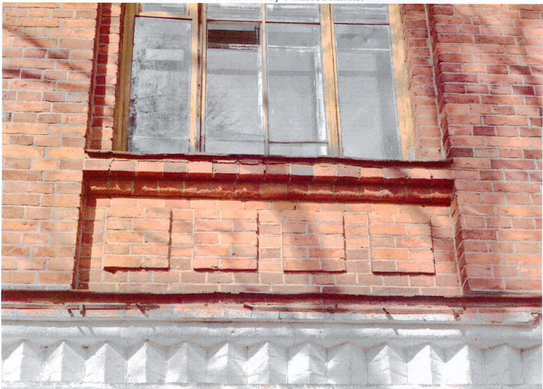
Фото 6. Фрагмент главного фасада. Декоративный профиль междуэтажного карниза. Ниши оконных проемов второго этажа с филенками.