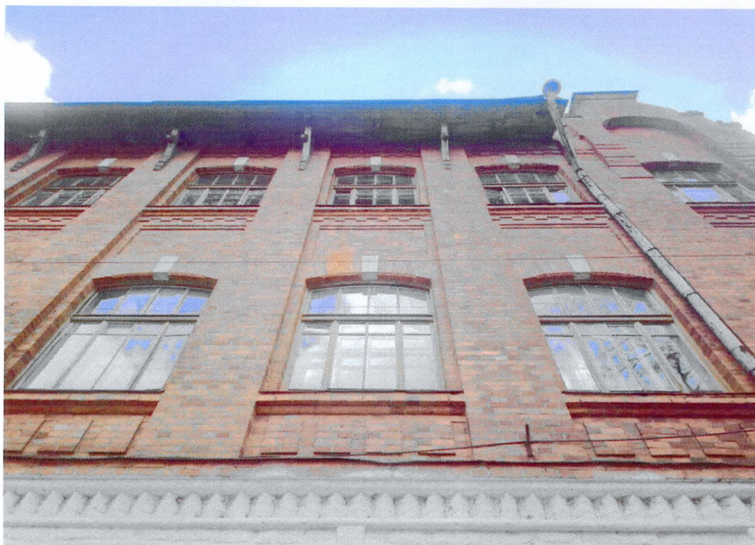
Фото 14. Фрагмент северного фасада. Кирпичная лицевая кладка без штукатурки. Карниз кровли деревянный выступающий с фигурными кронштейнами. Рельефные сандрики оконных проемов второго и третьего этажа со штукатурной имитацией замков. Оконные заполнения деревянные многочастные, с калевками.