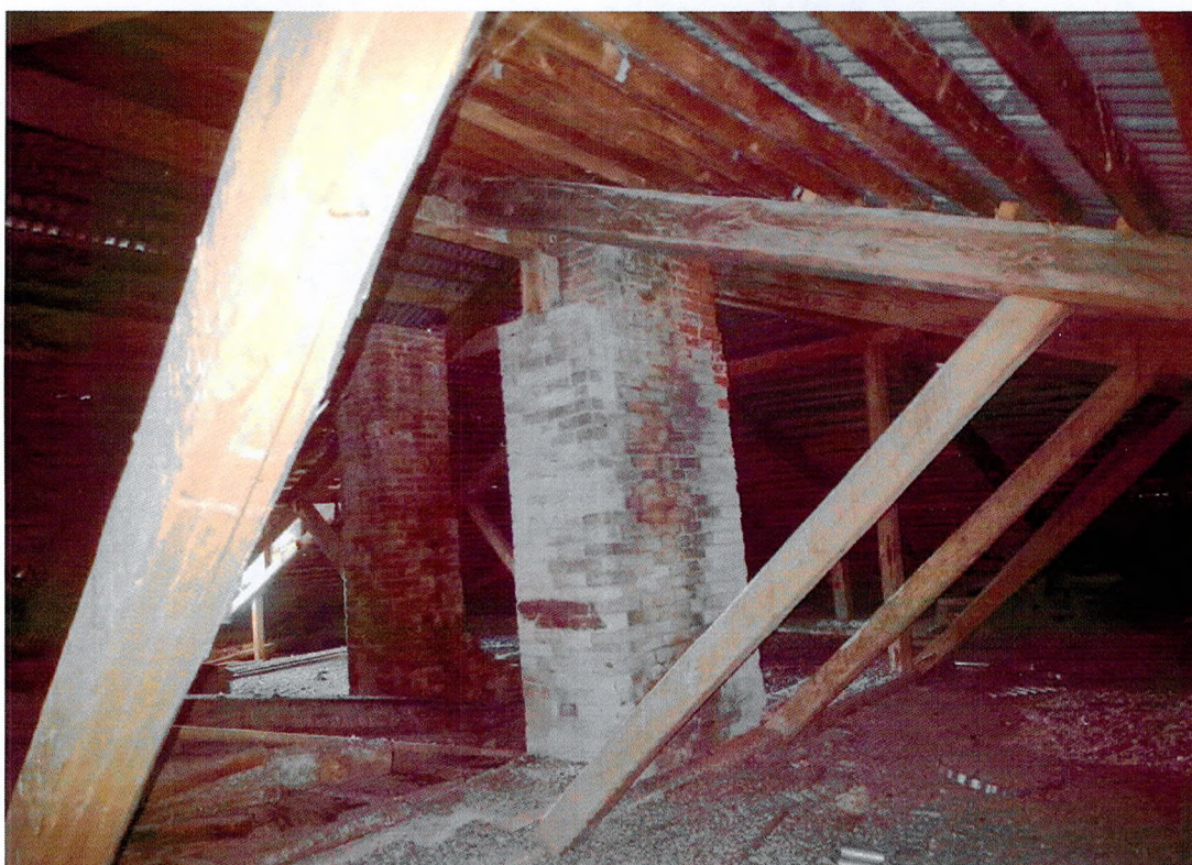
Фото 28. Фрагмент стропильной системы. Кирпичные дымоходы.