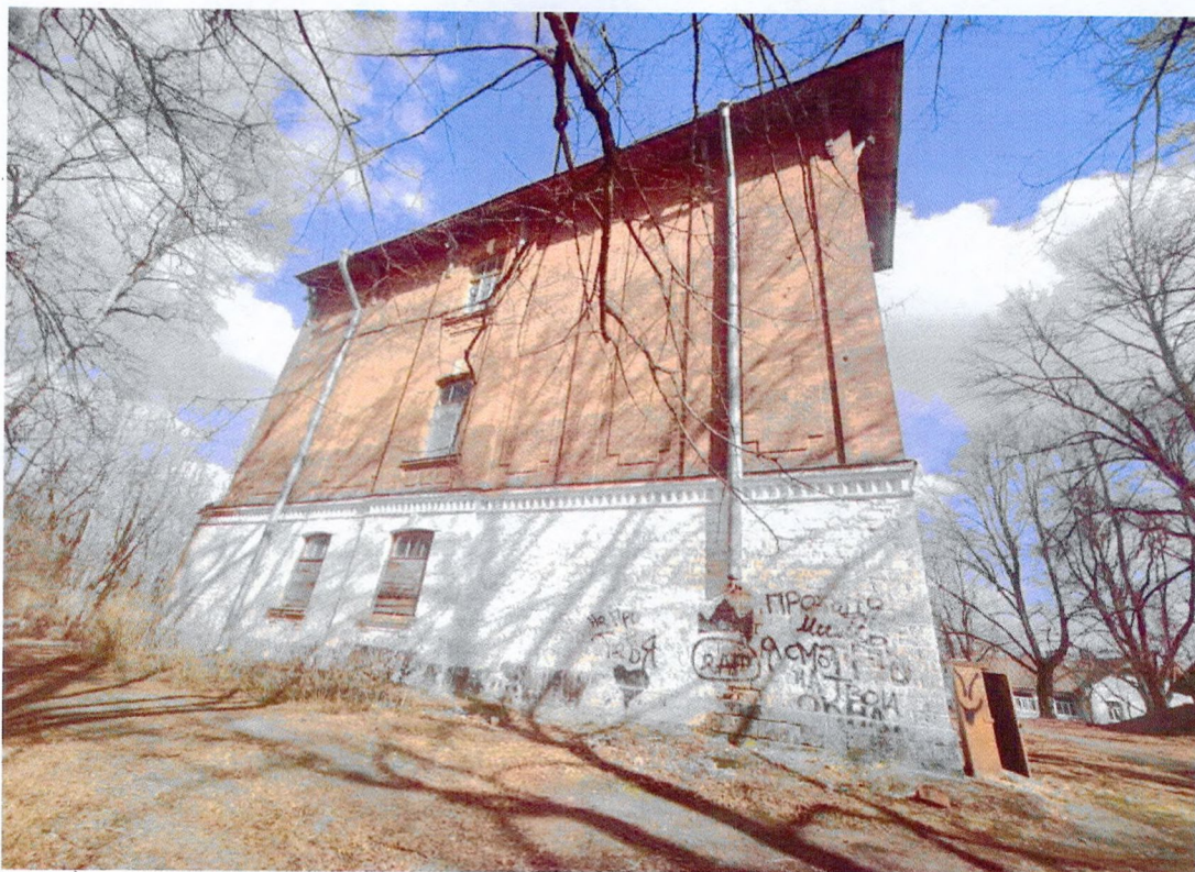
Фото 9. Западный фасад. Оформление первого этажа белокаменным рустом. Кирпичная лицевая кладка второго и третьего этажа без штукатурки, украшена лопатками. Оконные проемы первого этажа защиты досками.