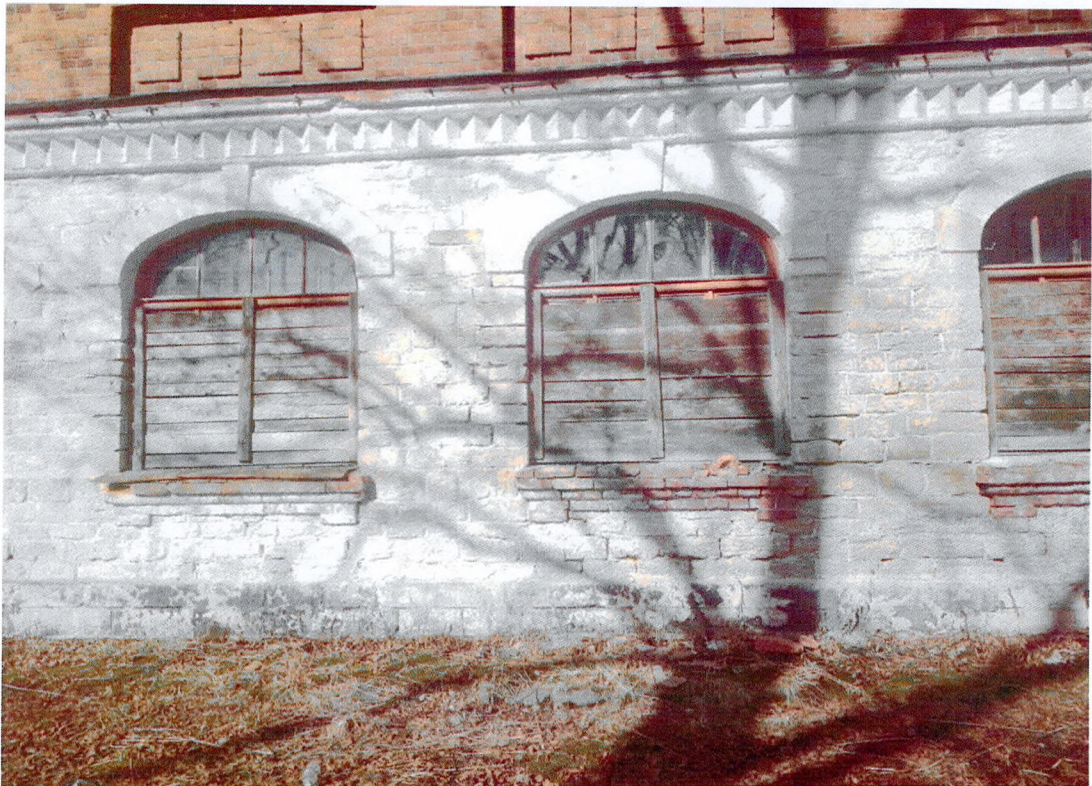
Фото 4. Фрагмент главного фасада. Оформление первого этажа белокаменным рустом. Оконные проемы первого этажа защиты досками. Оконные заполнения деревянные многочастные, с калевками.