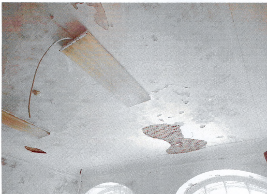
Фото 20. Перекрытие первого этажа в одном из помещений.