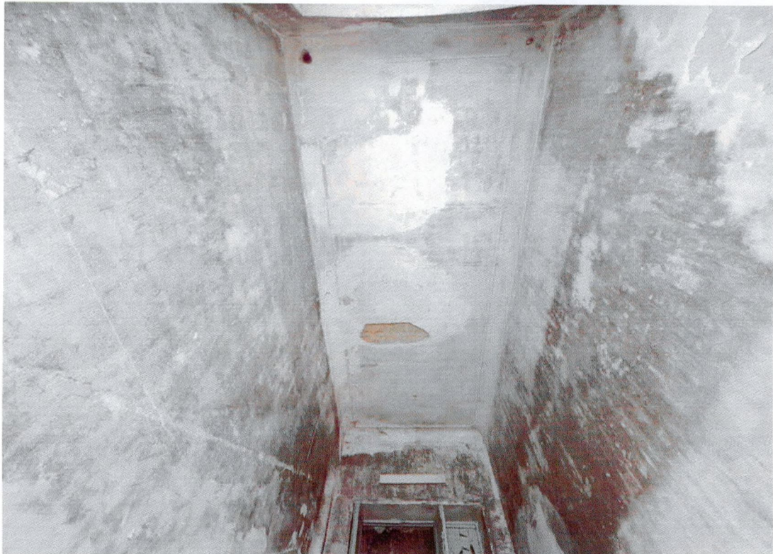
Фото 24. Перекрытие третьего этажа (чердачное) в зоне лестничной клетки.