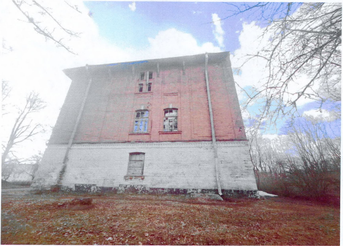
Фото 17. Восточный фасад. Оформление первого этажа белокаменным рустом. Кирпичная лицевая кладка второго и третьего этажа без штукатурки, украшена лопатками. Оконный проем первого этажа зашит досками.