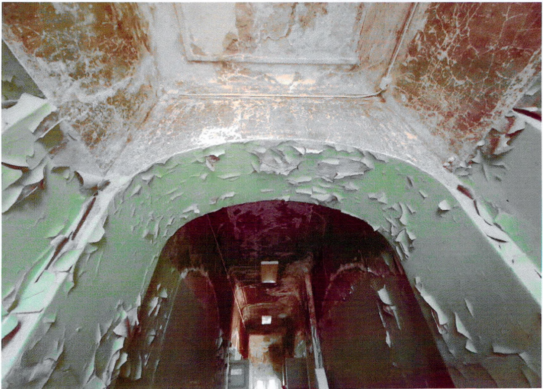
Фото 26. Коридор на третьем этаже.