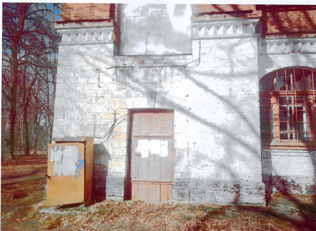
Фото 7. Фрагмент главного фасада. Оформление юго-западного входа белокаменным рустом. Перемычка с замковым камнем. Дверное заполнение деревянное.