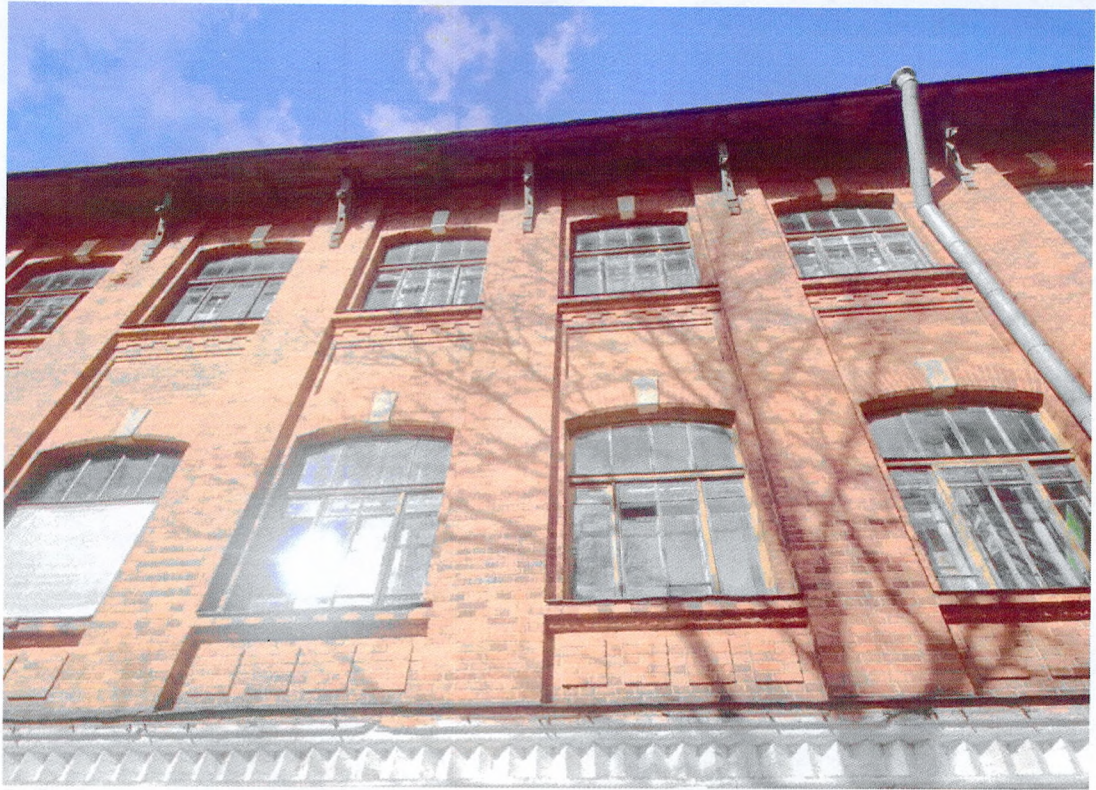
Фото 5. Фрагмент главного фасада. Кирпичная лицевая кладка без штукатурки. Карниз кровли деревянный выступающий с фигурными кронштейнами. Рельефные сандрики оконных проемов второго и третьего этажа со штукатурной имитацией замков. Оконные заполнения деревянные многочастные, с калевками.