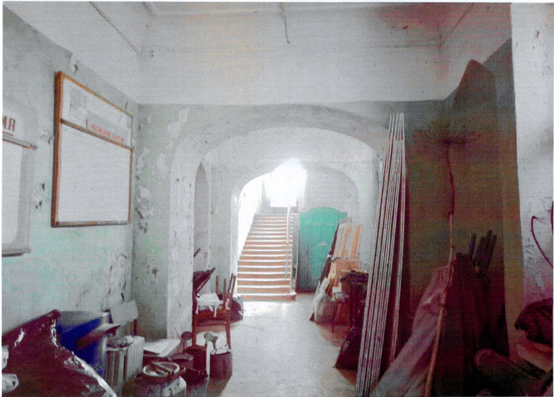
Фото 18. Помещение на первом этаже.