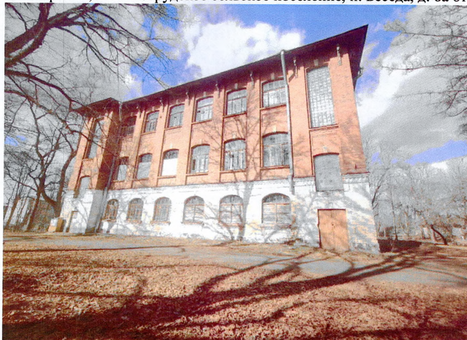
Фото 1. Главный (южный) фасад.

Фотофиксация объекта культурного наследия регионального значения «Здание земского сельскохозяйственного училища» по адресу: Ленинградская область, Волосовский муниципальный район, Большеврудское сельское поселение, п. Беседа, д. 8а от 24.03.2026