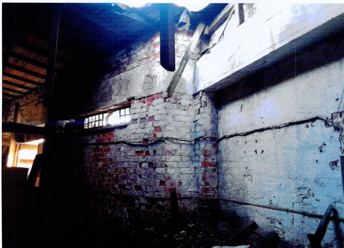
Фото 32. «1-этажный корпус - гараж (литера АЗ)». Утраты отделочного слоя стен. Деструкция кирпичной кладки.