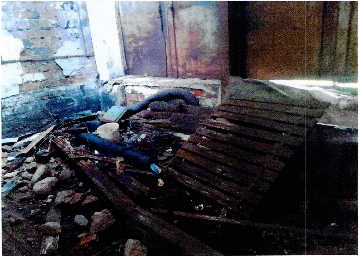
Фото 34. «1-этажный корпус - гараж (литера А3)». Полы.