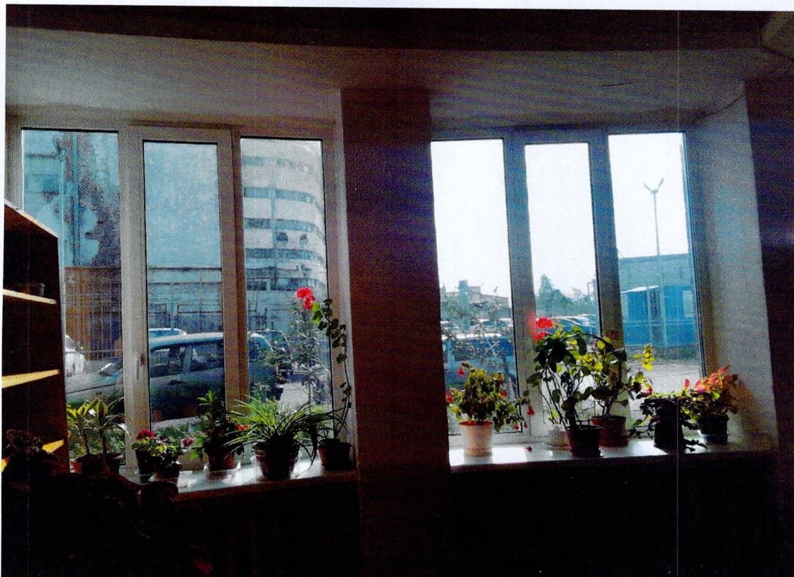
Фото 13. «Административный корпус (лит. А)». Помещение на 2 этаже.