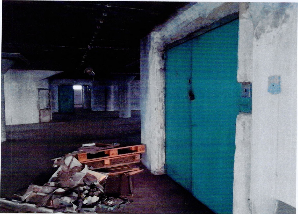
Фото 25. «Склады - основной объем (литера А1)». Лифт.