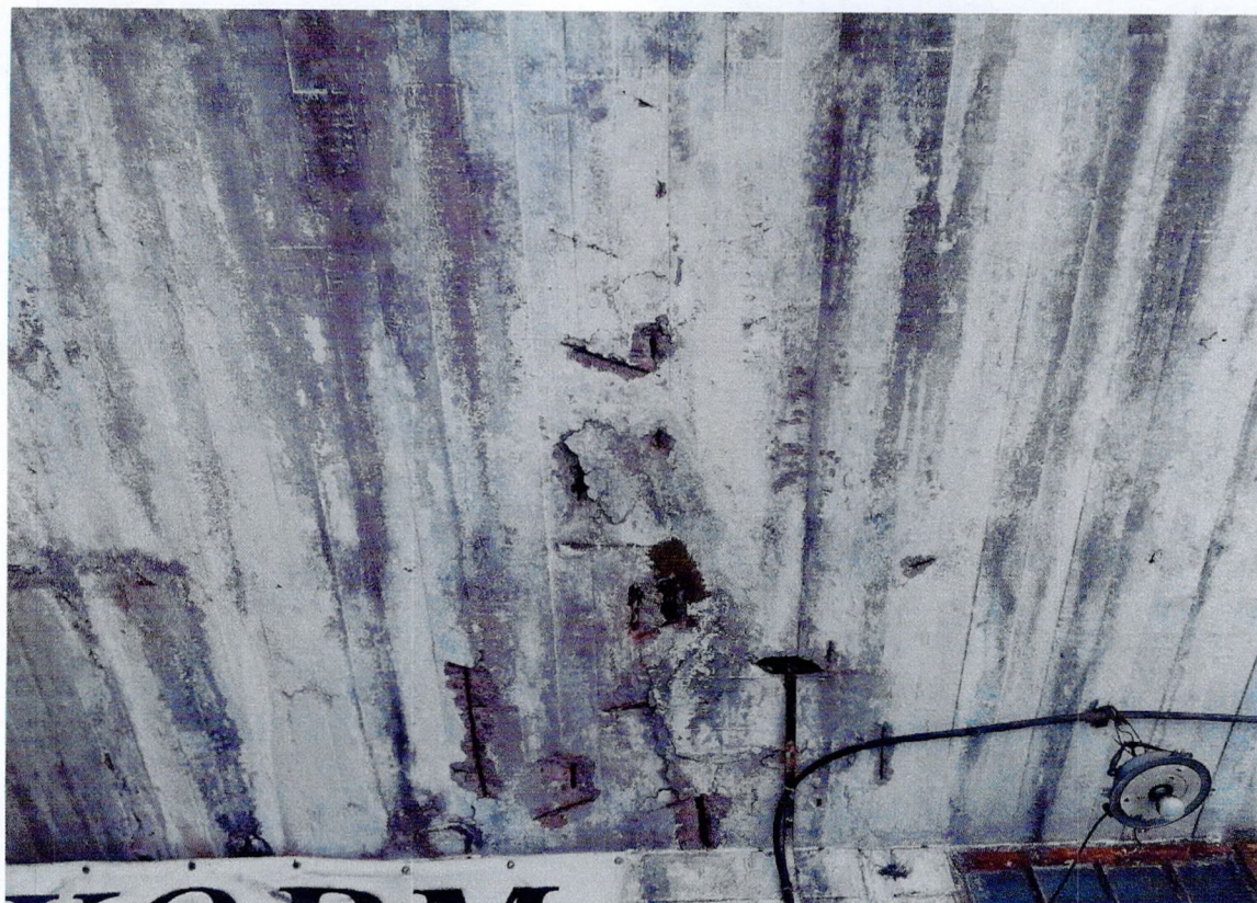
Фото 18. «Склады - основной объем (литера А1)». Фрагмент восточного фасада. Коррозия арматуры плиты козырька.