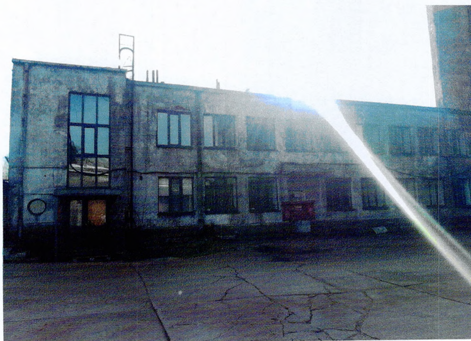
Фото 2. «Административный корпус (лит. А)». Западный фасад.