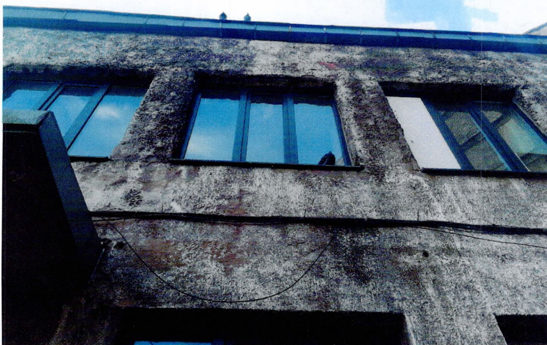
Фото 6. «Административный корпус (лит. А)». Фрагмент западного фасада. Отслоения штукатурного слоя. Утрата защитного слоя бетона перемычки.