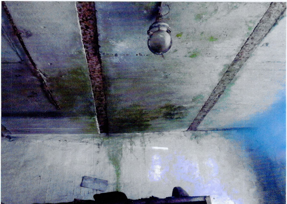
Фото 38. «1-этажный корпус - гараж (литера А3)». Коррозия металлических балок покрытия, биоповреждения.