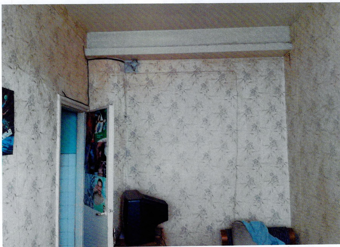
Фото 12. «Административный корпус (лит. А)». Помещение на 2 этаже.