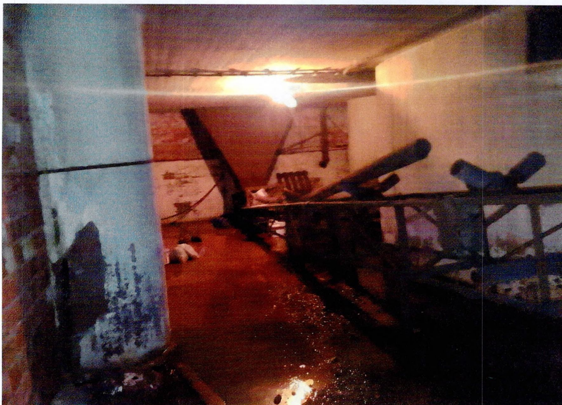
Фото 22. «Склады - основной объем (литера А1)». Помещение в подвале. Затопление полов.