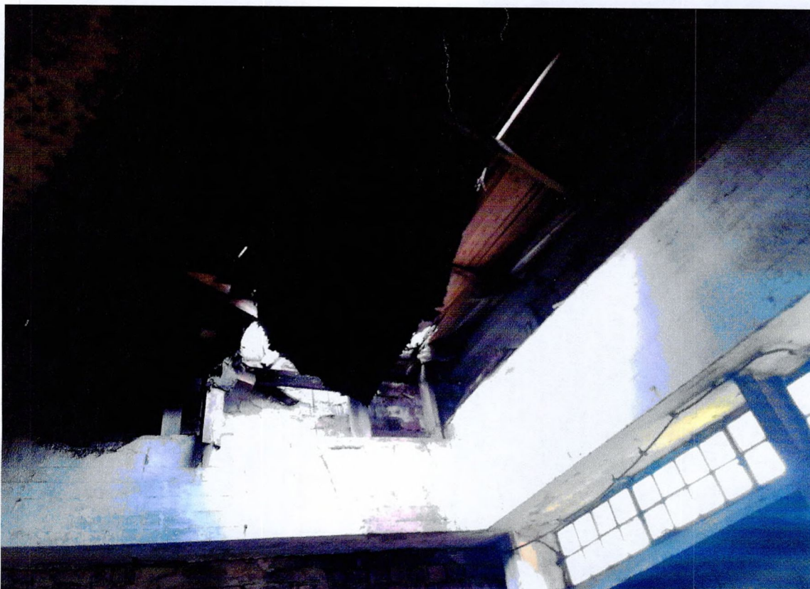
Фото 31. «1-этажный корпус - гараж (литера АЗ)». Обрушение покрытия кровли.