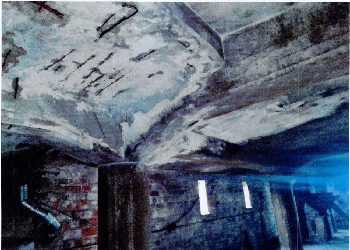
Фото 26. «Склады - основной объем (литера А1)». Помещение на 8 этаже. Оголение и коррозия арматуры покрытия.