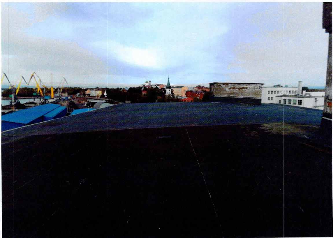
Фото 28. «Склады - основной объем (литера А1)». Кровля.