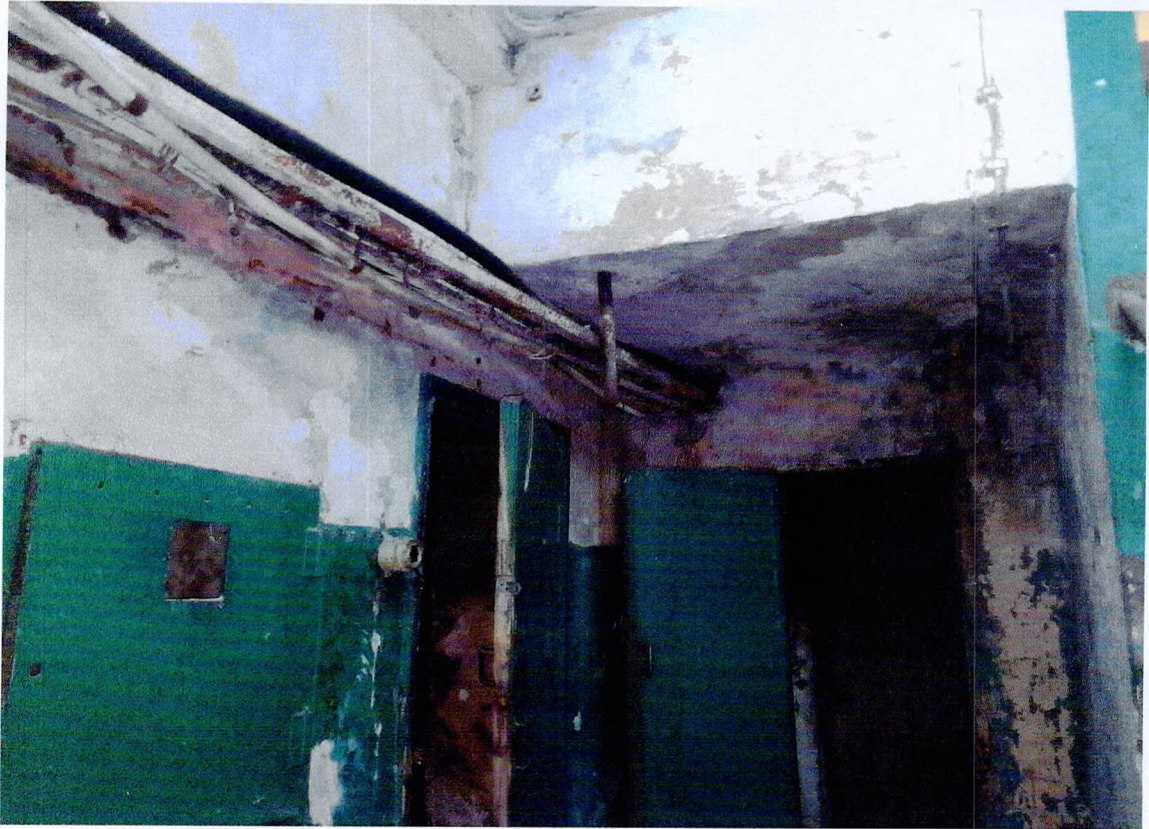
Фото 23. «Склады - основной объем (литера А1)». Помещение в подвале. Отслоение отделочного слоя стен и потолков.