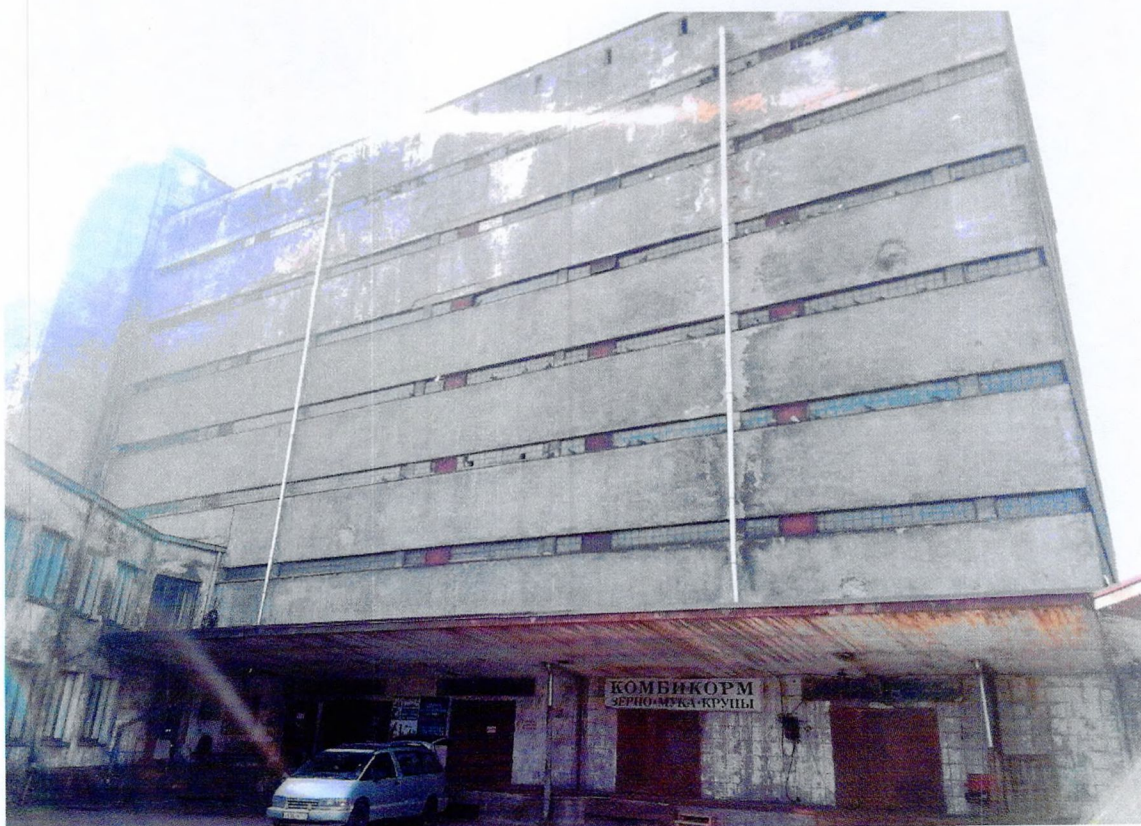
Фото 16. «Склады - основной объем (литера А1)». Восточный фасад.