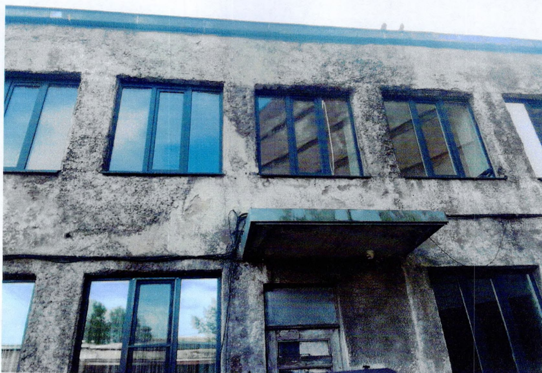
Фото 5. «Административный корпус (лит. А)». Фрагмент западного фасада. Отслоения штукатурного слоя.