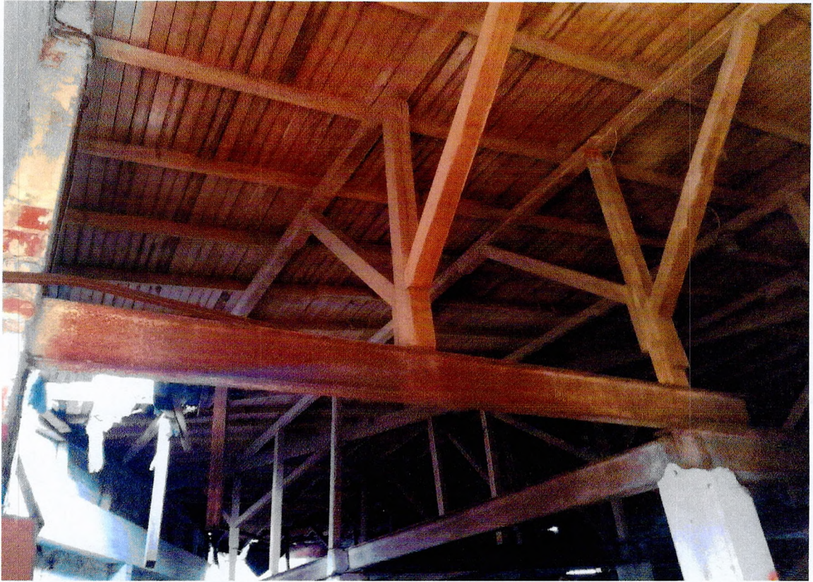
Фото 33. «1-этажный корпус - гараж (литера А3)». Общий вид конструкций внутри здания.