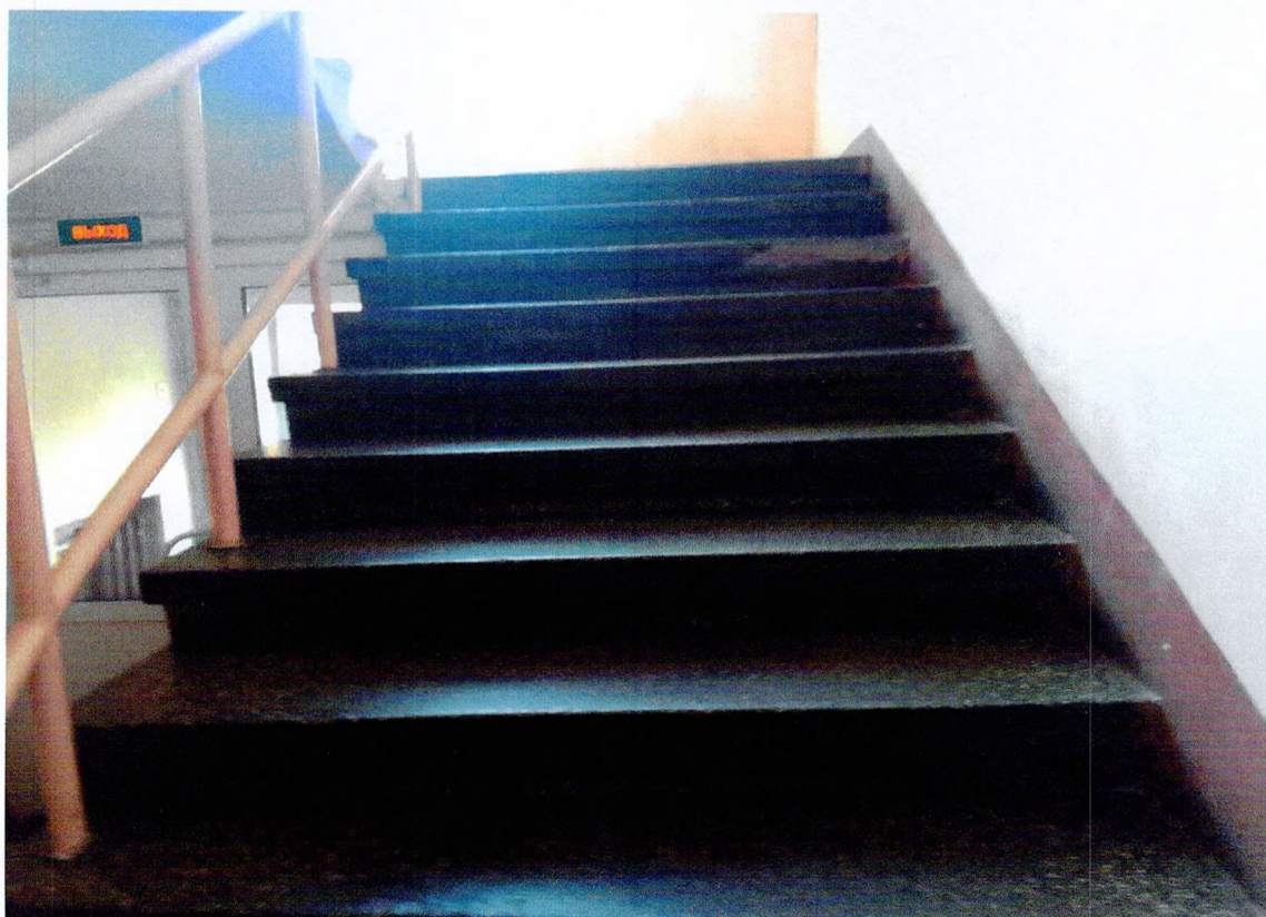
Фото 14. «Административный корпус (лит. А)». Лестница.