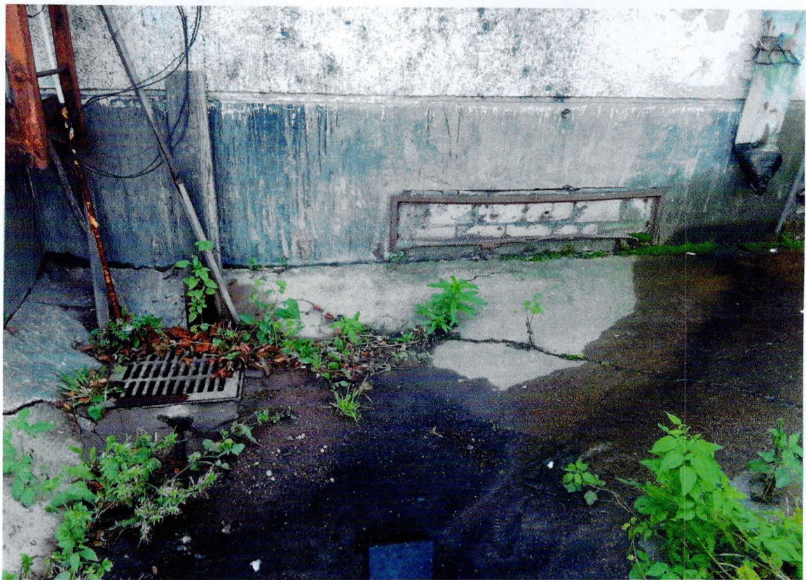
Фото 4. «Административный корпус (лит. А)». Фрагмент западного фасада, биоповреждения, трещины, нарушения уклона отмостки.