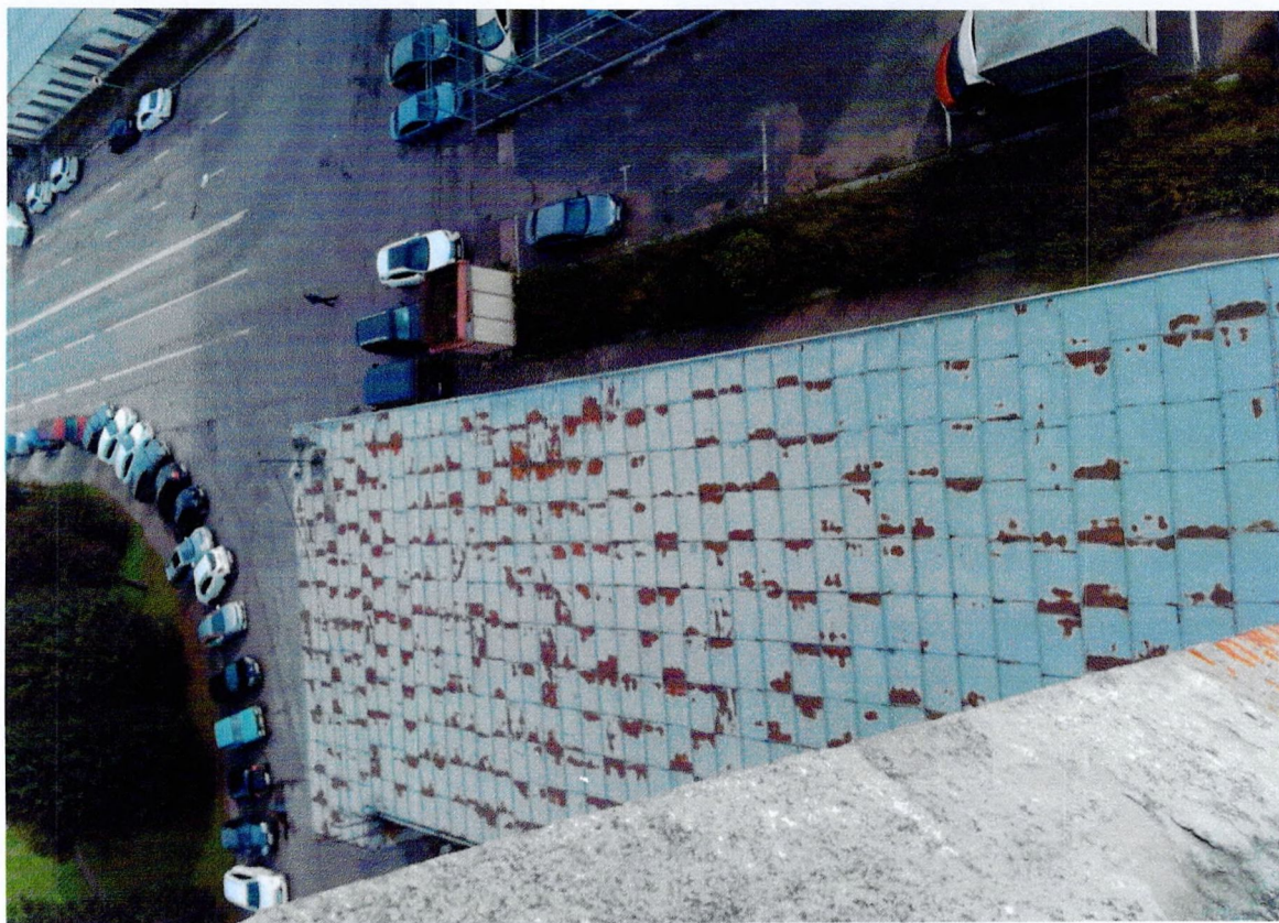
Фото 8. «Административный корпус (лит. А)». Поверхностная коррозия кровли.