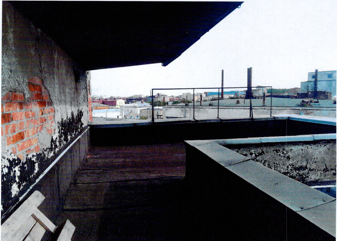
Фото 27. «Склады - основной объем (литера А1)». Кровля.