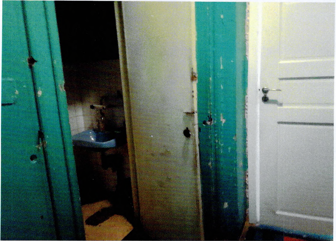
Фото 9. «Административный корпус (лит. А)». Помещения на 1 этаже.