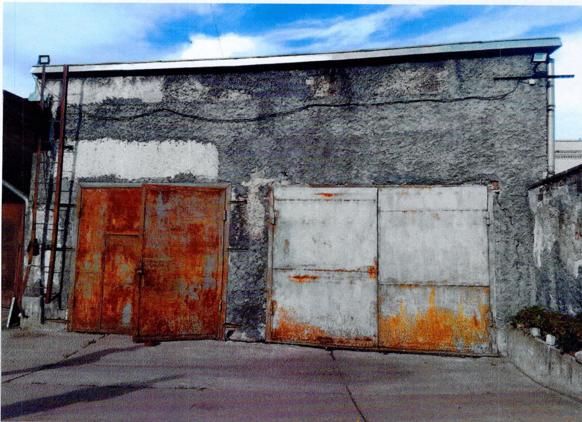
Фото 35. «1-этажный корпус - гараж (литера А3)». Южный фасад. Отслоение штукатурного слоя. Поверхностная коррозия металлических дверей.