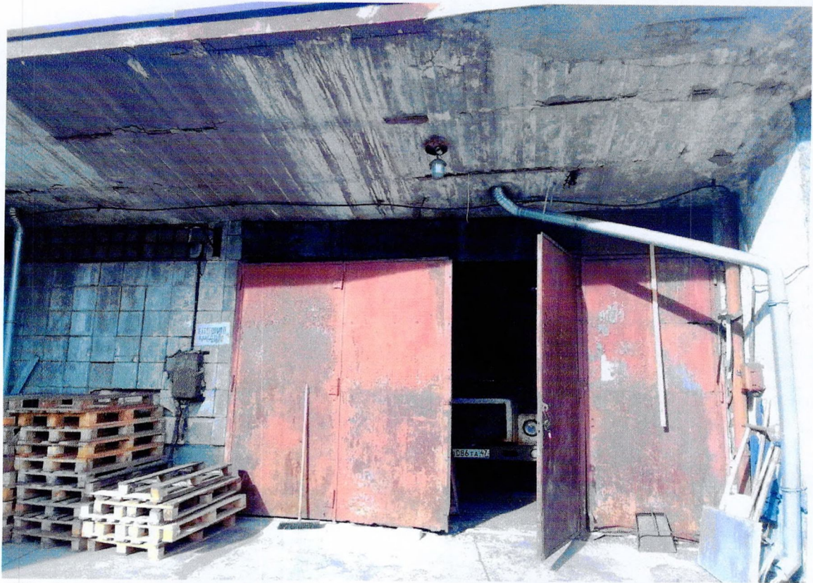
Фото 29. «1-этажный корпус - гараж (литера АЗ)». Южный фасад. Сколы плиток облицовки фасада. Оголение и коррозия арматуры плиты козырька. Поверхностная коррозия металлической двери.