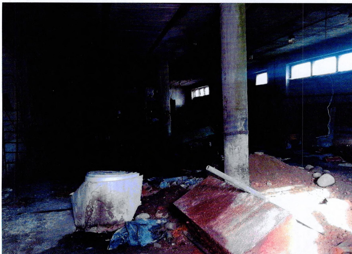
Фото 36. «1-этажный корпус - гараж (литера А3)». Общий вид конструкций внутри здания.