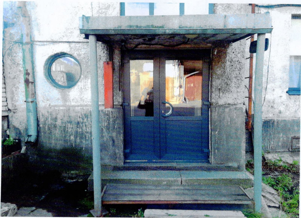
Фото 3. «Административный корпус (лит. А)». Фрагмент западного фасада. Поздние стойки козырька.