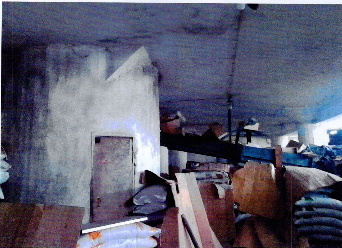
Фото 21. «Склады - основной объем (литера А1)». Бетонный цилиндрический грузовой подъемник.