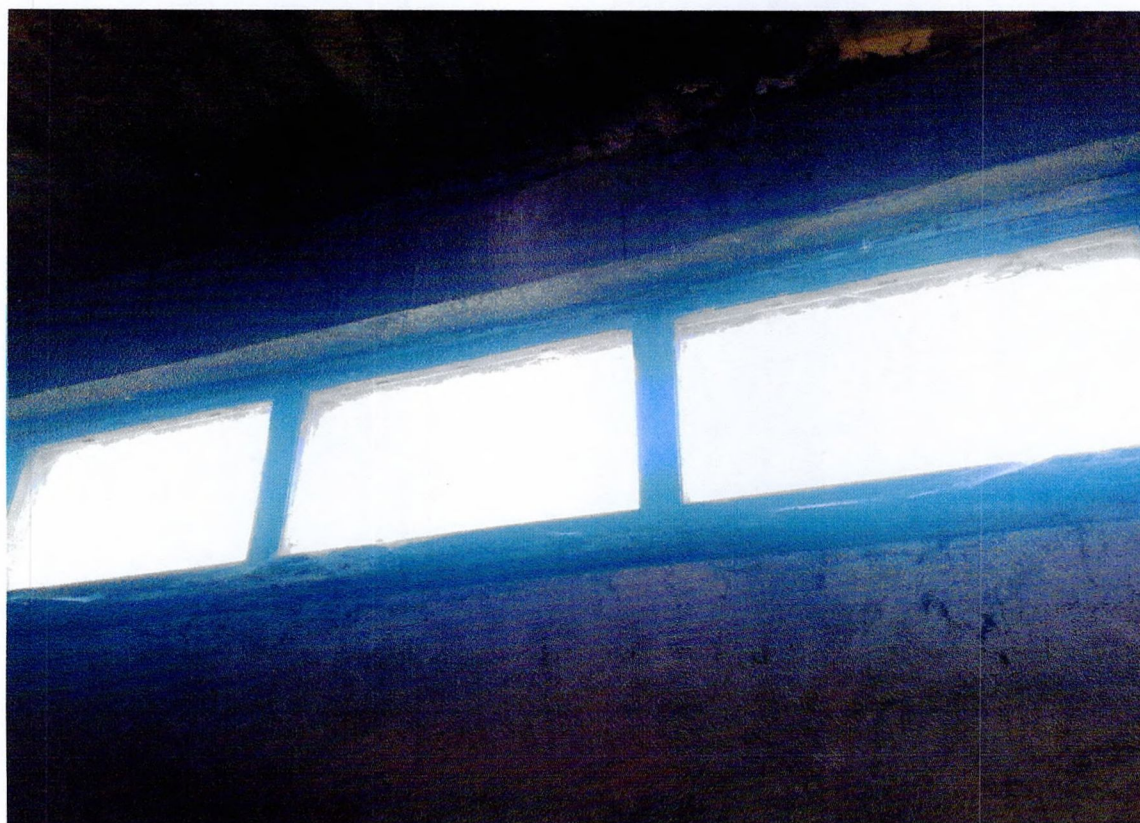
Фото 40. «1-этажный корпус - гараж (литера АЗ). Оконный проем.