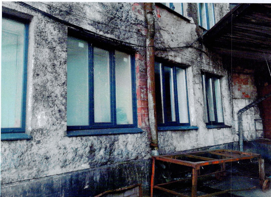
Фото 7. «Административный корпус (лит. А)». Фрагмент западного фасада. Отслоения штукатурного слоя.