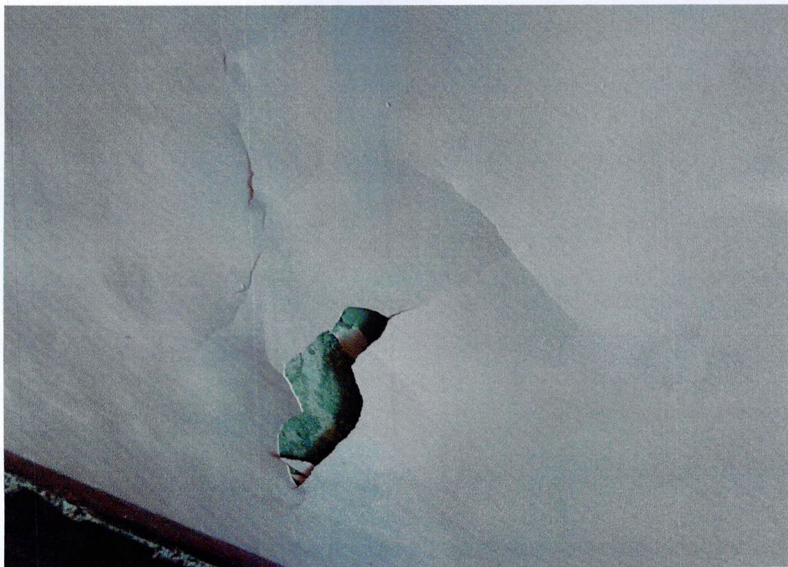
Фото 11. «Административный корпус (лит. А)». Отслоение отделочного слоя стен.