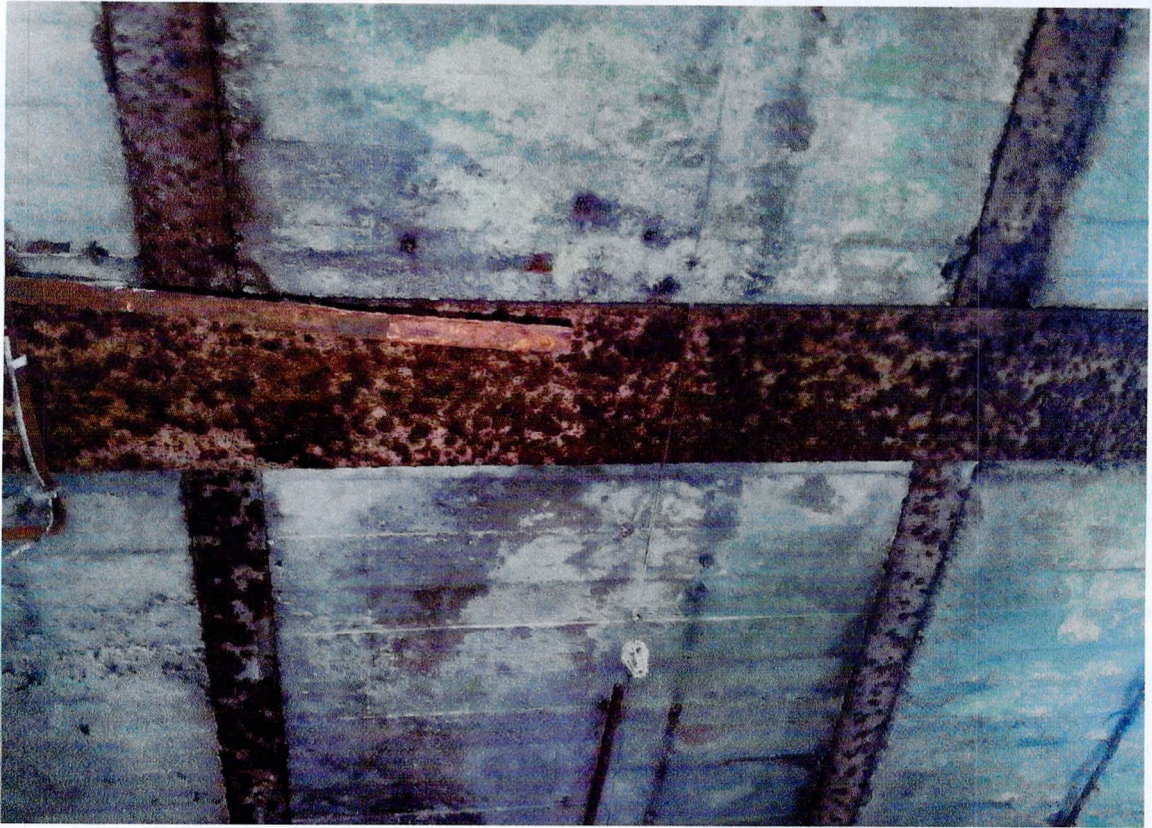
Фото 37. «1-этажный корпус - гараж (литера А3)». Коррозия металлических балок покрытия.