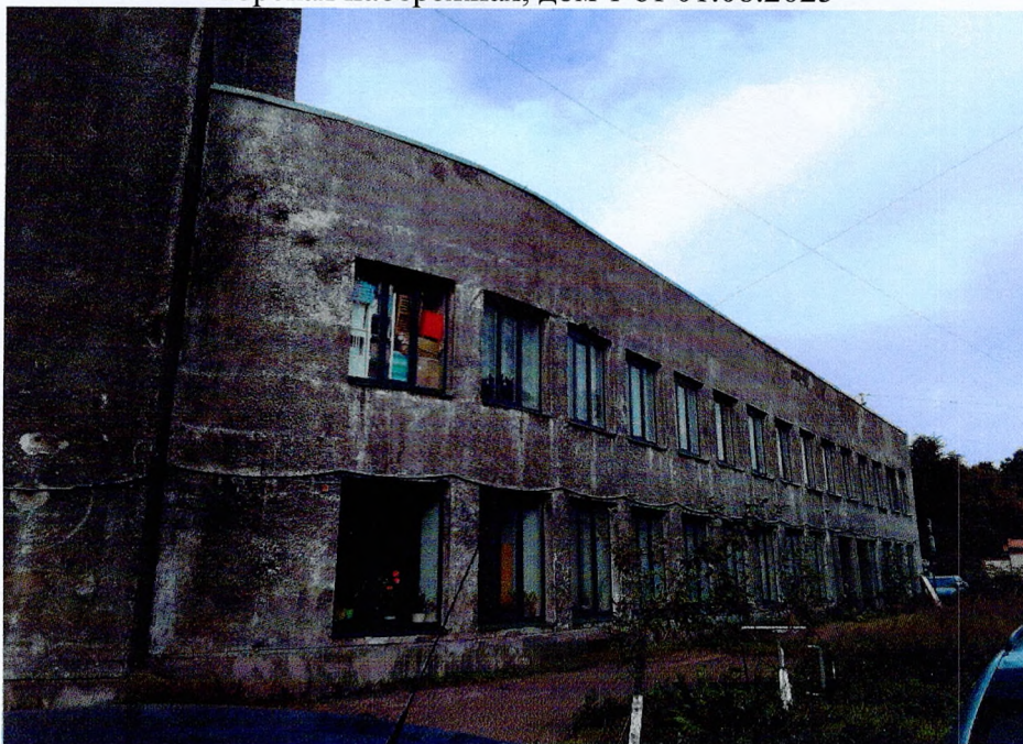
Фото 1. «Административный корпус (лит. А)». Восточный фасад.

Фотофиксация объекта культурного наследия регионального значения «Лицей» по адресу: Ленинградская область, Выборгский район, город Выборг, Морская набережная, дом 1 от 01.08.2025