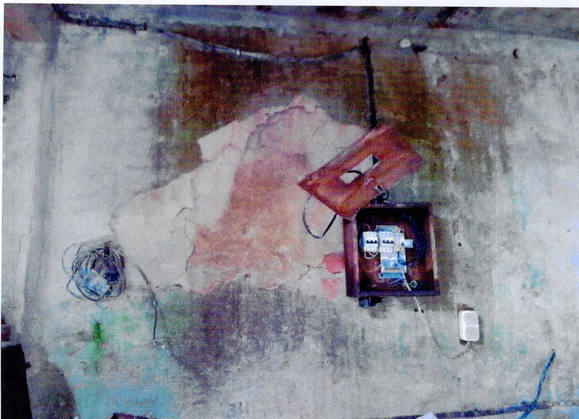
Фото 39. «1-этажный корпус - гараж (литера АЗ)». Отслоение отделочного слоя стен, биоповреждения. Неудовлетворительное состояние системы электроснабжения.