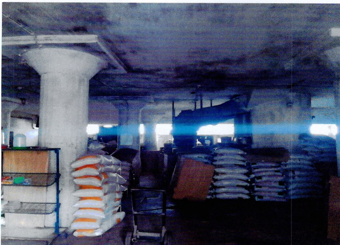
Фото 20. «Склады - основной объем (литера А1)». Общий вид помещения на 1 этаже.