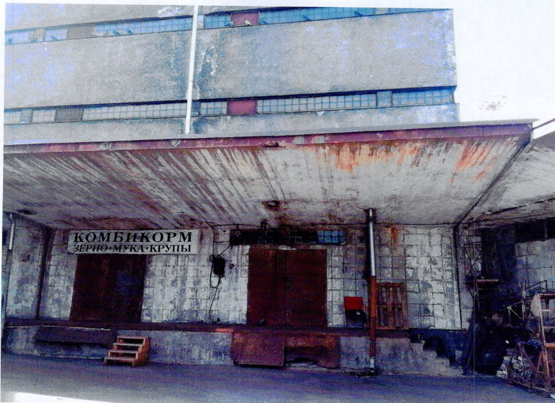
Фото 17. «Склады - основной объем (литера А1)». Фрагмент восточного фасада. Отслоения отделочного слоя. Коррозия водосточных труб.