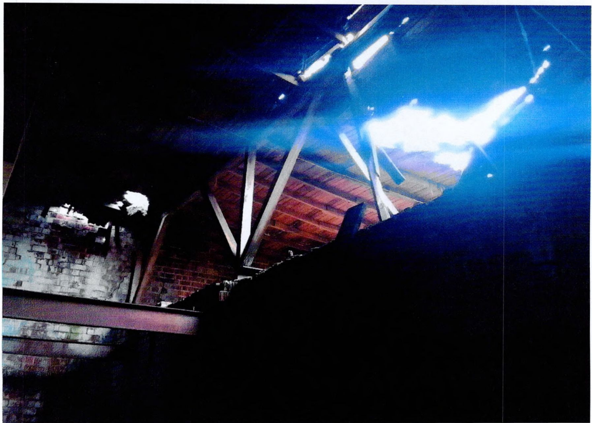
Фото 30. «1-этажный корпус - гараж (литера АЗ)». Общий вид конструкций внутри здания. Обрушения покрытия кровли.