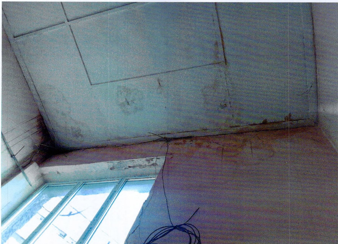
Фото 15. «Административный корпус (лит. А)». Следы протечек кровли на покрытии.