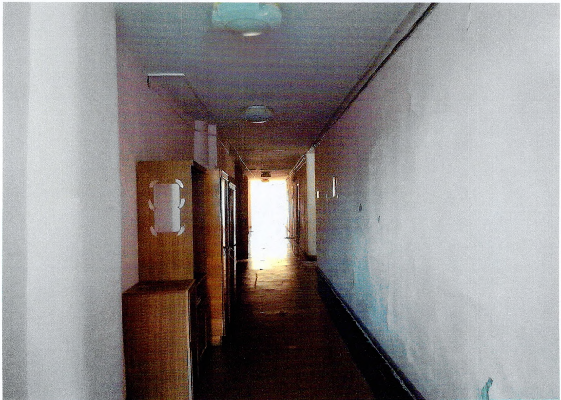
Фото 10. «Административный корпус (лит. А)». Помещение на 2 этаже.