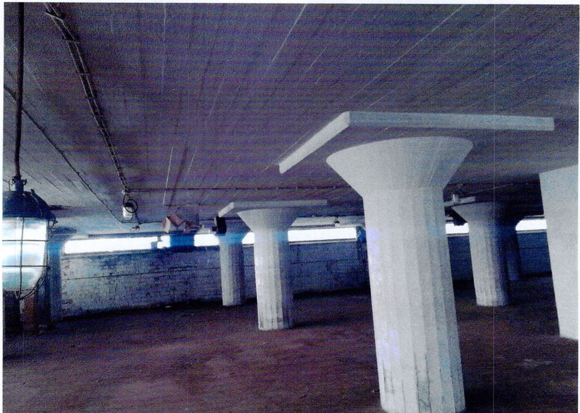
Фото 24. «Склады - основной объем (литера А1)». Общий вид помещения.