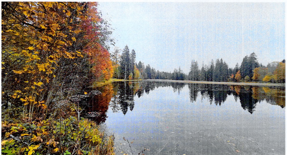
Фото 4. Состояние пруда.