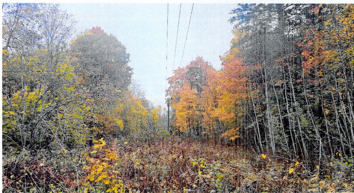
Фото 2. Состояние парка.