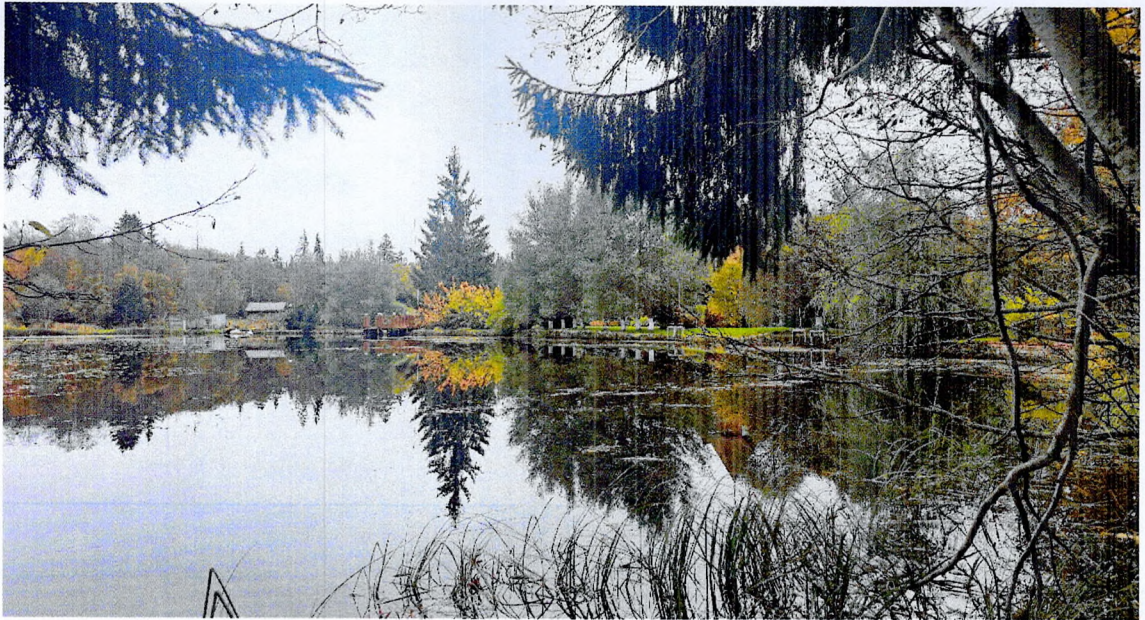
Фото 3. Состояние пруда.